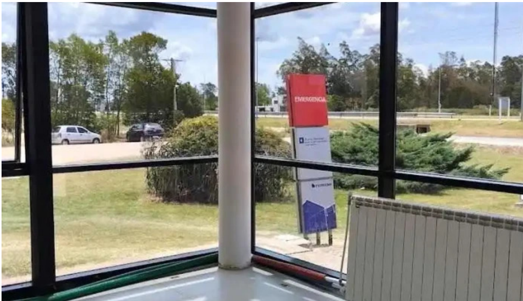
Asociacion medica de san jose ecilda paullier