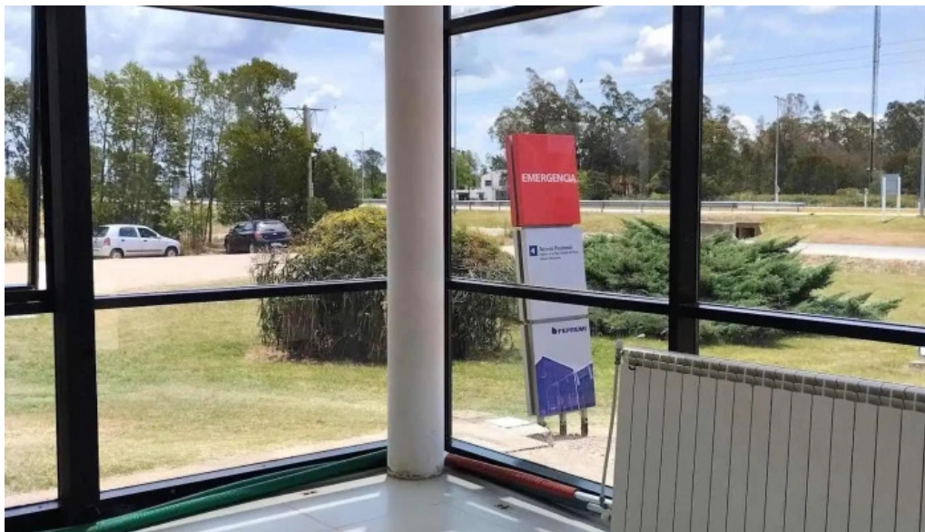
Asociacion medica de san jose puntaje