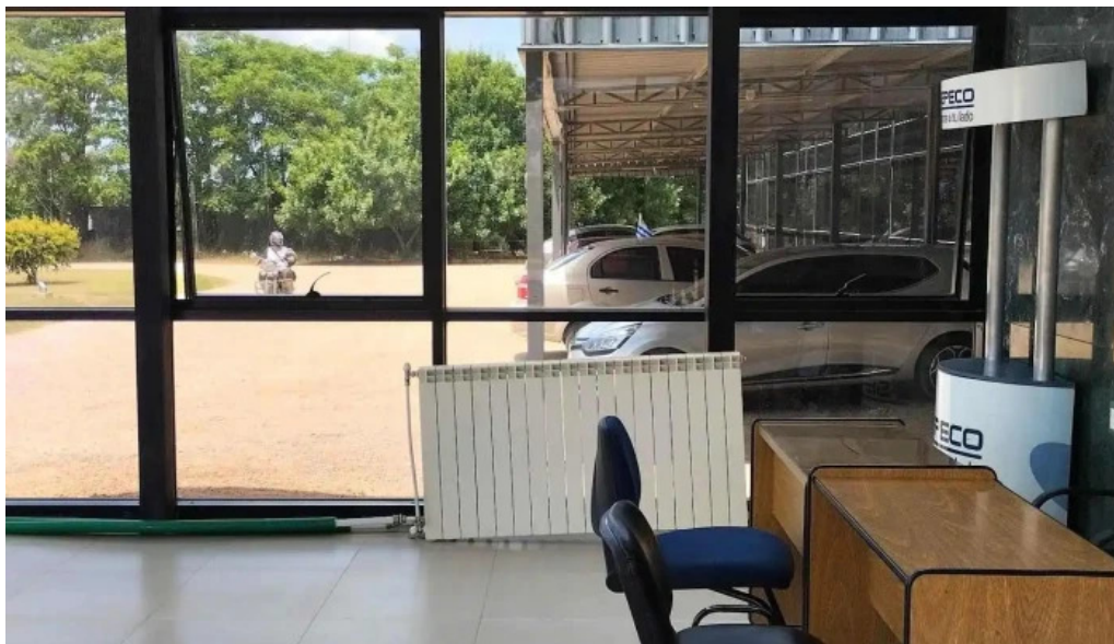
Asociacion medica de san jose edificio