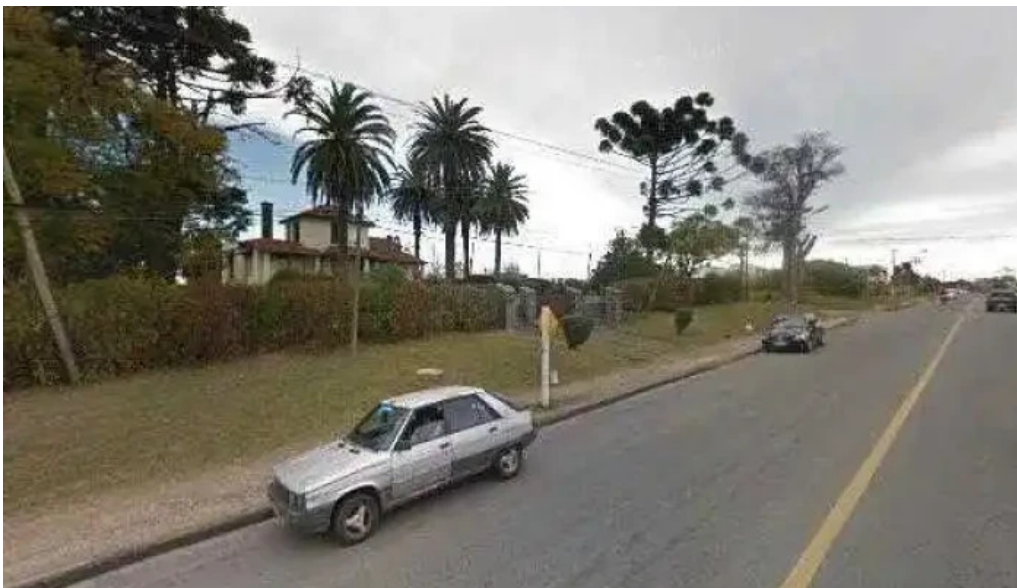
Policlinica camec real de san carlos puntajedeg