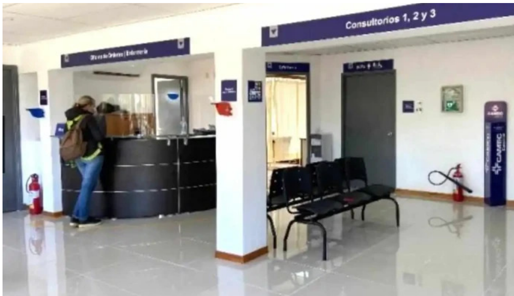
Policlinica camec real de san carlos lobby