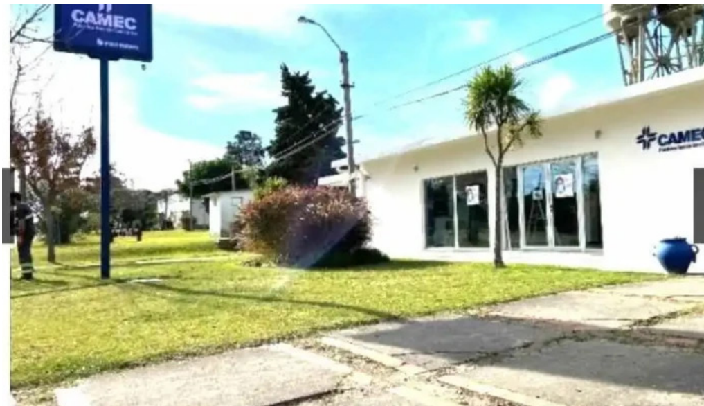
Policlinica camec real de san carlos col del sacramento