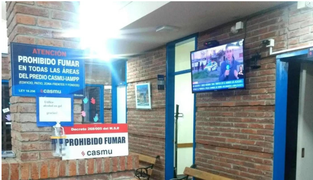
Policlinica casmu Barros Blancos comentarios