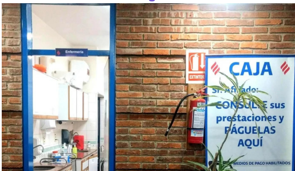
Policlínica casmu barro blancos promoción