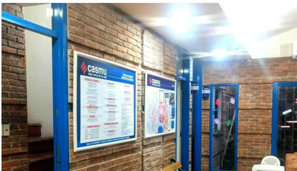
Policlinica casmu Barros Blancos abierto ahora