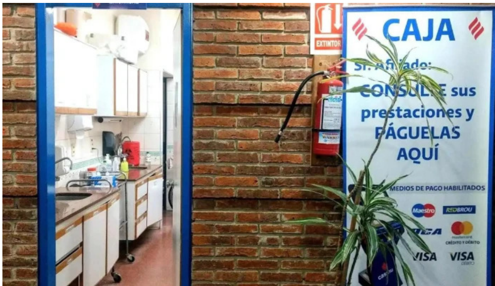
Policlinica casmu Barros blancos edificio