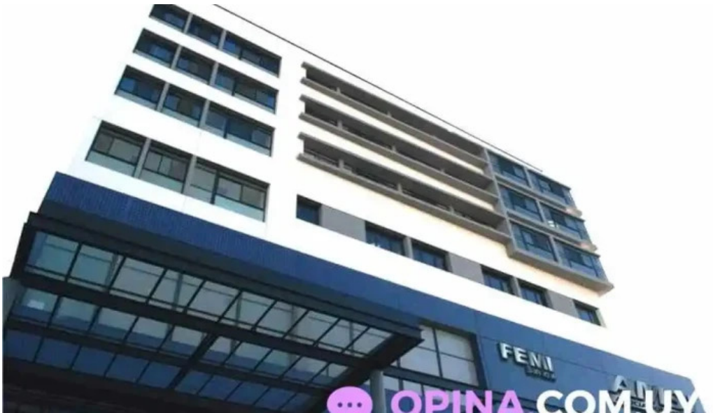
Sanatorio asociacion medica de san jose san jose de mayo