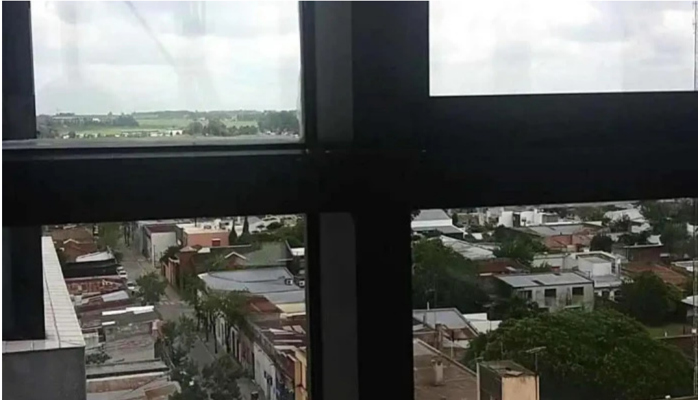
Sanatorio asociacion medica de san jose videos