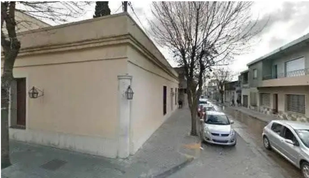
Sanatorio asociacion medica de san jose como llegardeg