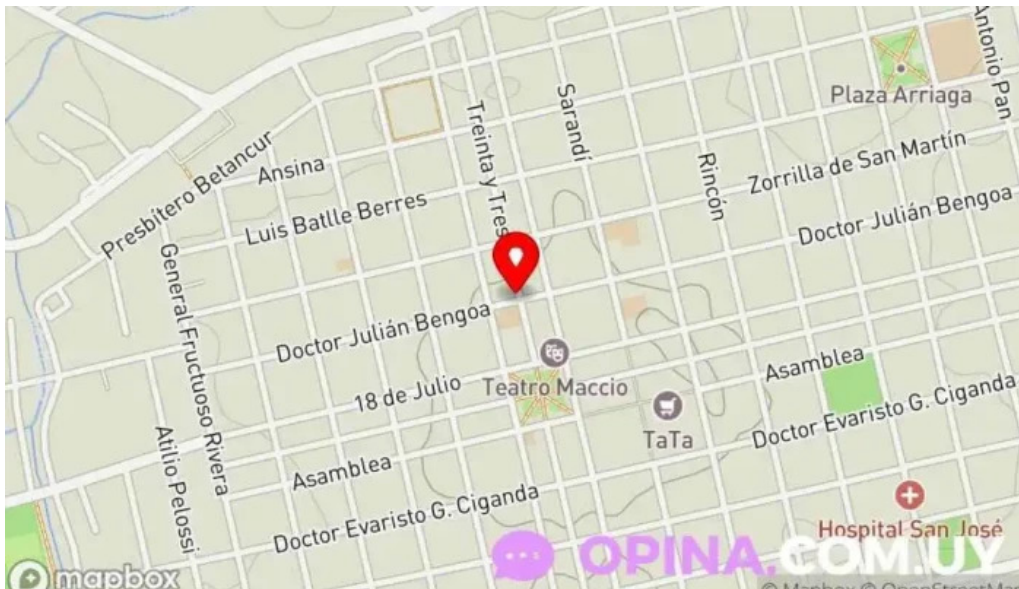
Sanatorio asociacion medica de san jose mapa