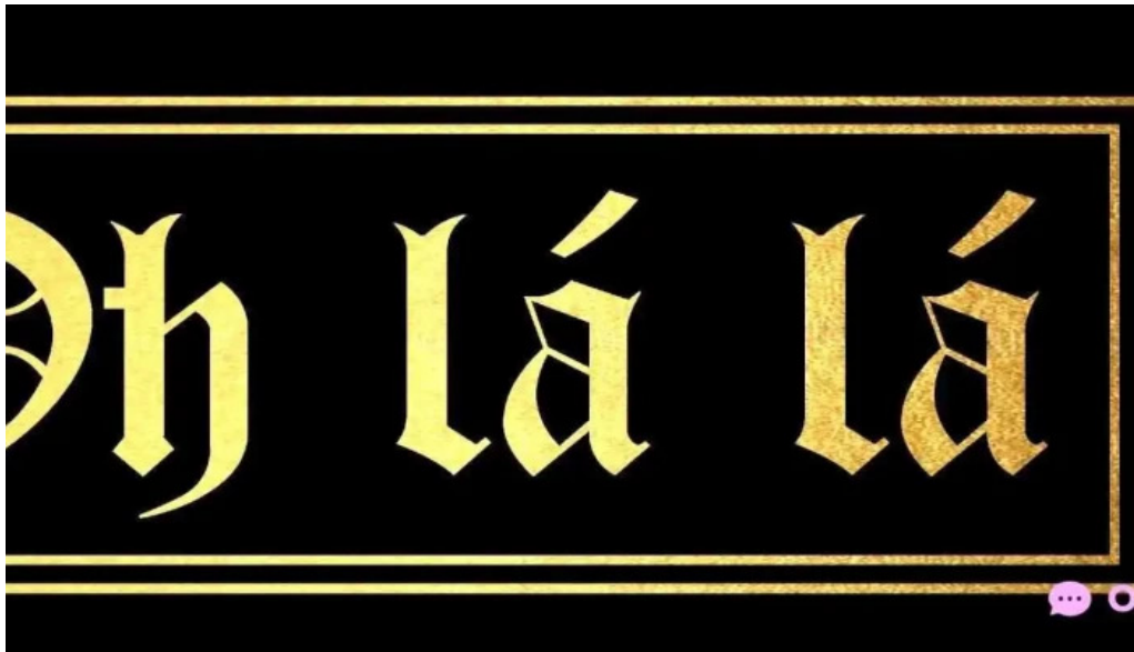
Heladeria oh la la del propietario