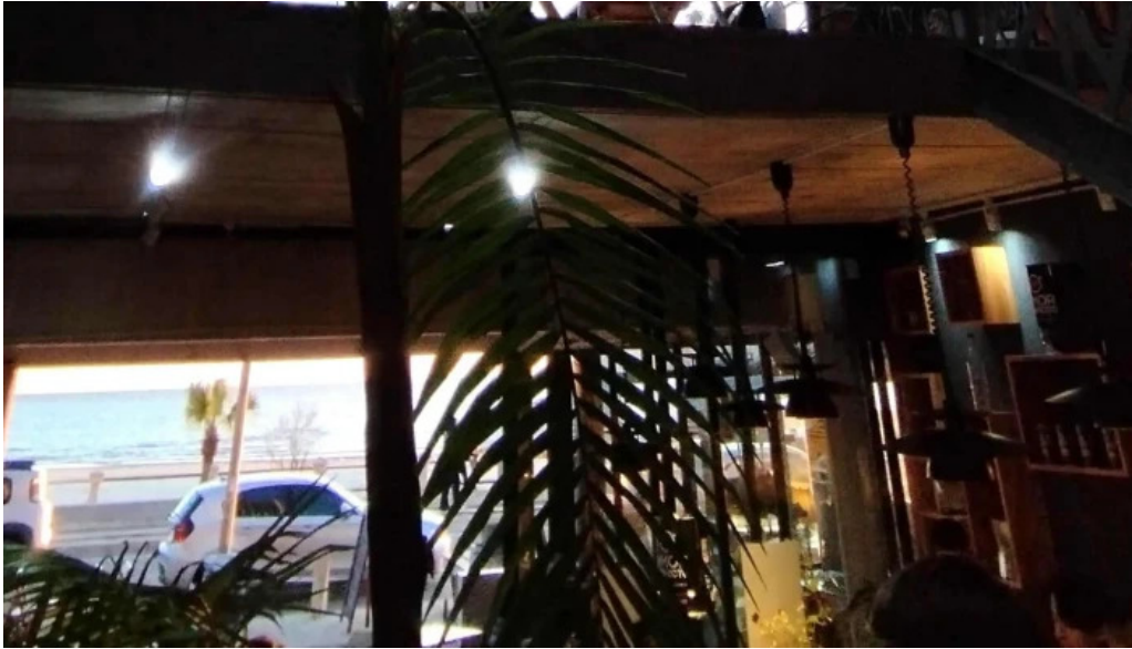
Heladeria oh la la comentario 5