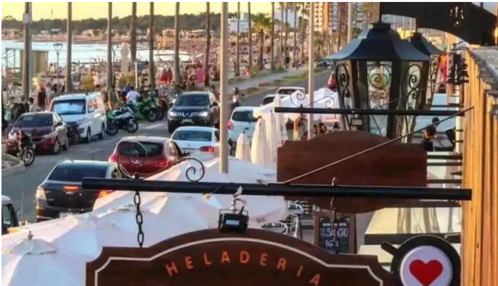
Heladeria oh la la piriapolis