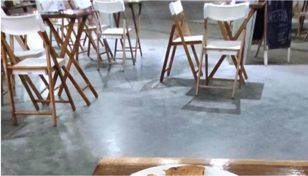
Heladeria oh la la comentario 3