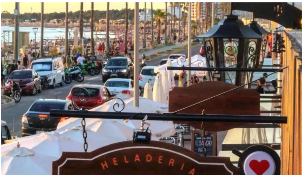
Heladeria oh la la todo