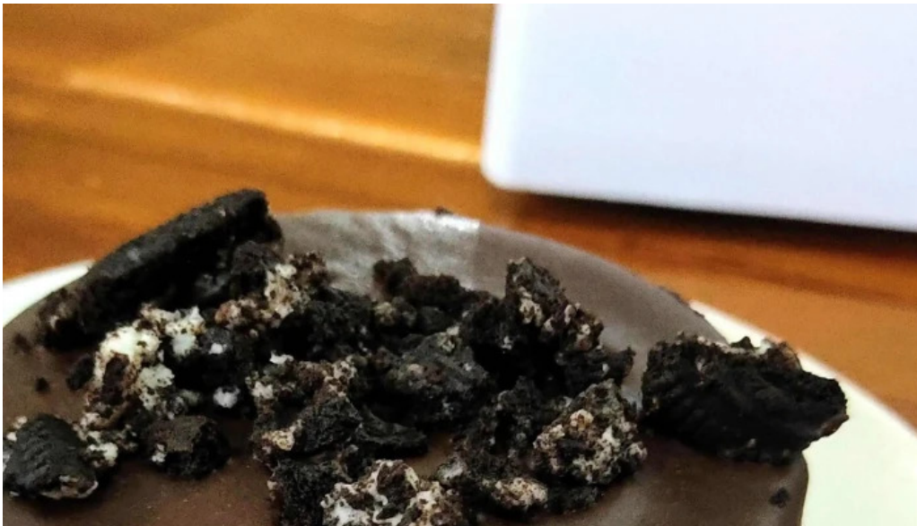
Heladeria oh la la comentario 2