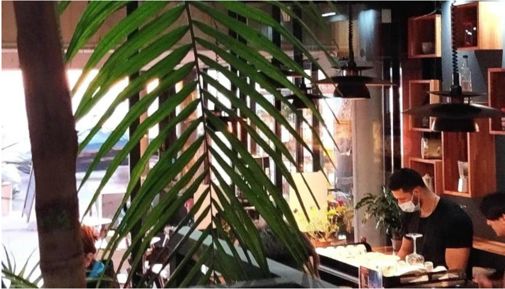
Heladeria oh la la comentario 7