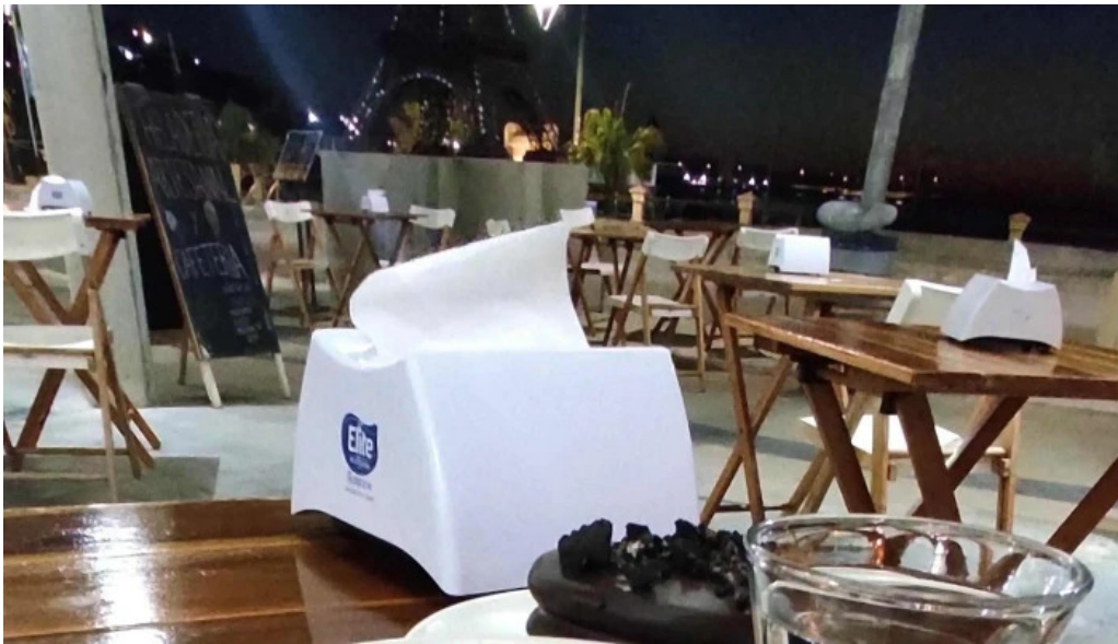
Heladeria oh la la comentario 4