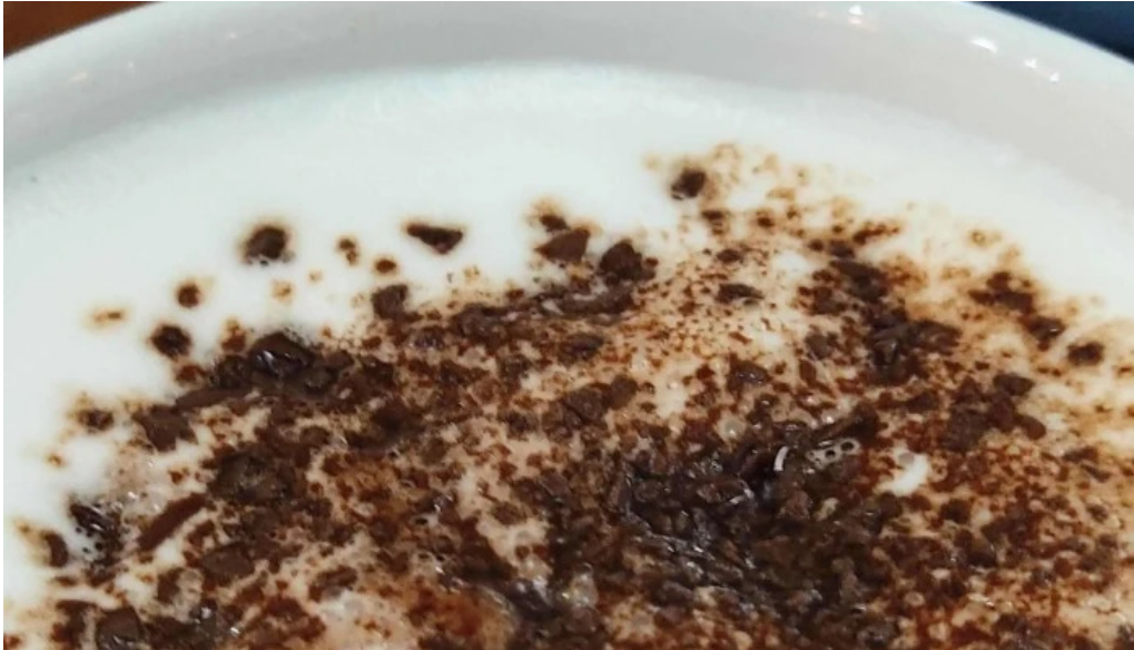
Heladeria oh la la comentario 1