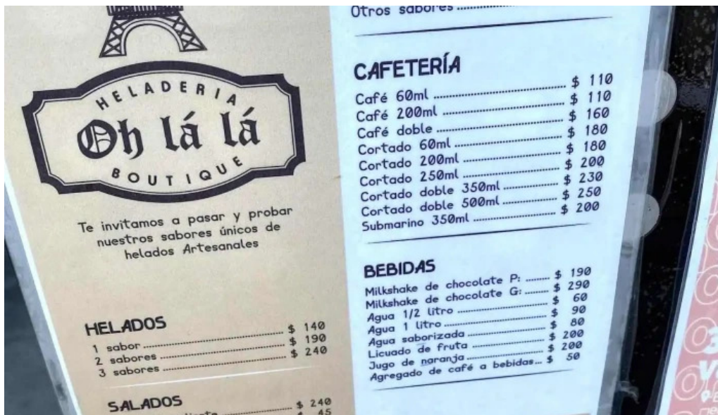
Heladeria oh la la menu