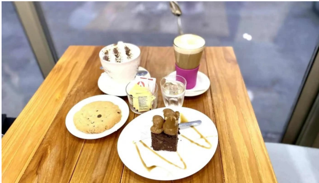
Heladeria oh la la comidas y bebidas