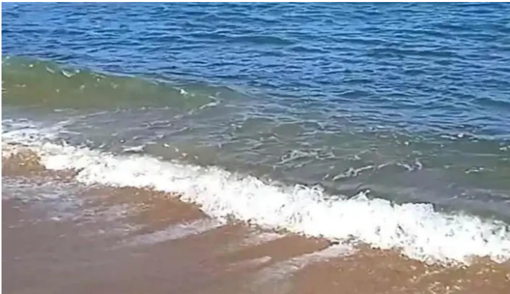
Heladeria oh la la videos