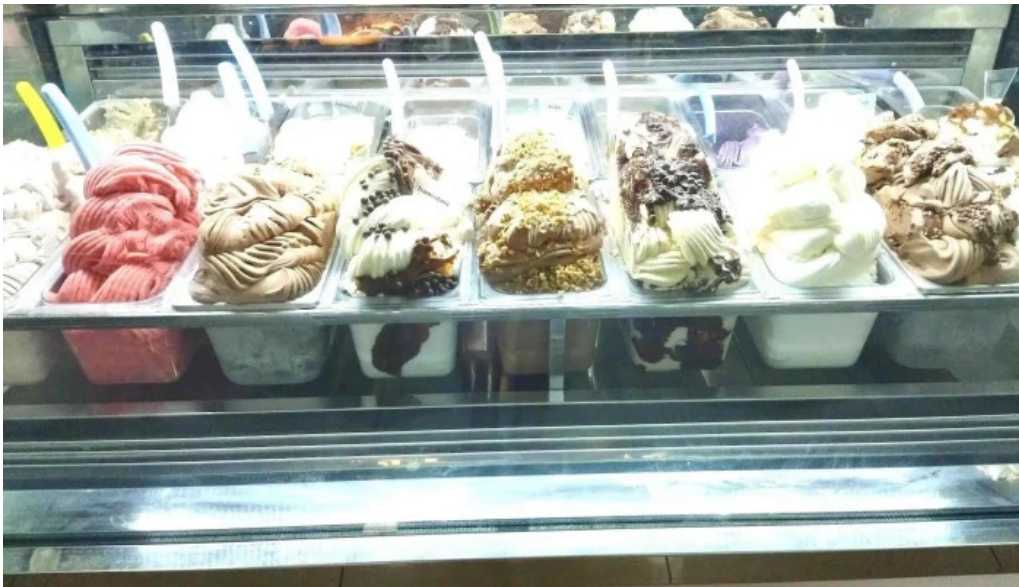
Heladeria oh la la ambiente