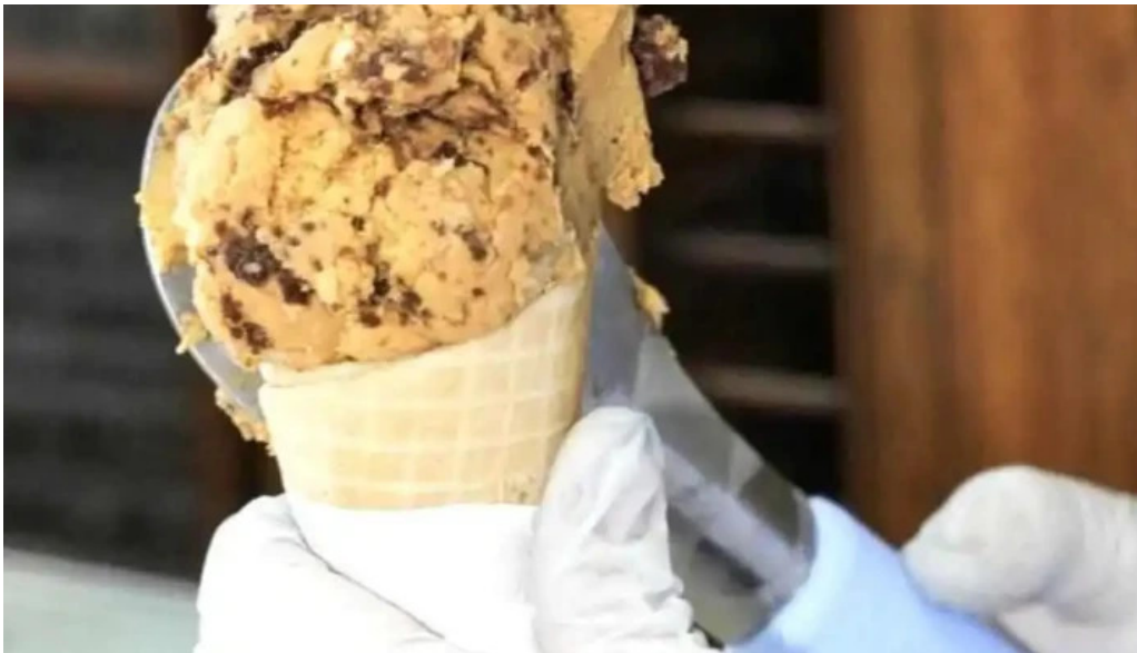
Heladeria oh la la recientes