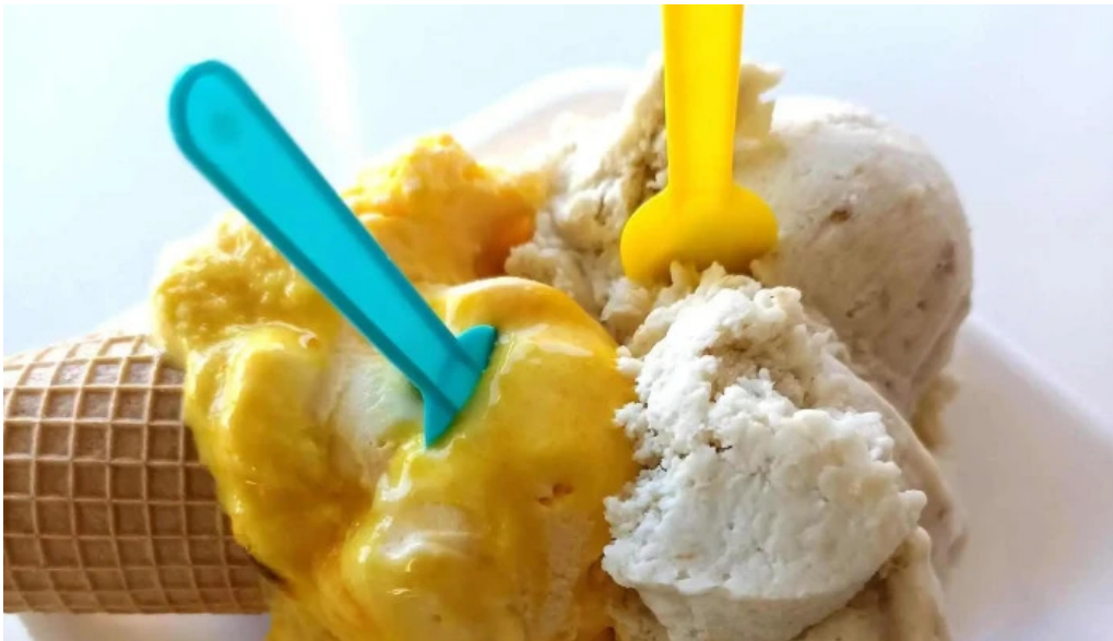
La cremeria comentario 6