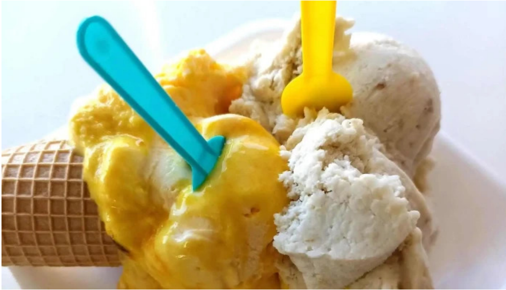
La cremeria comidas y bebidas