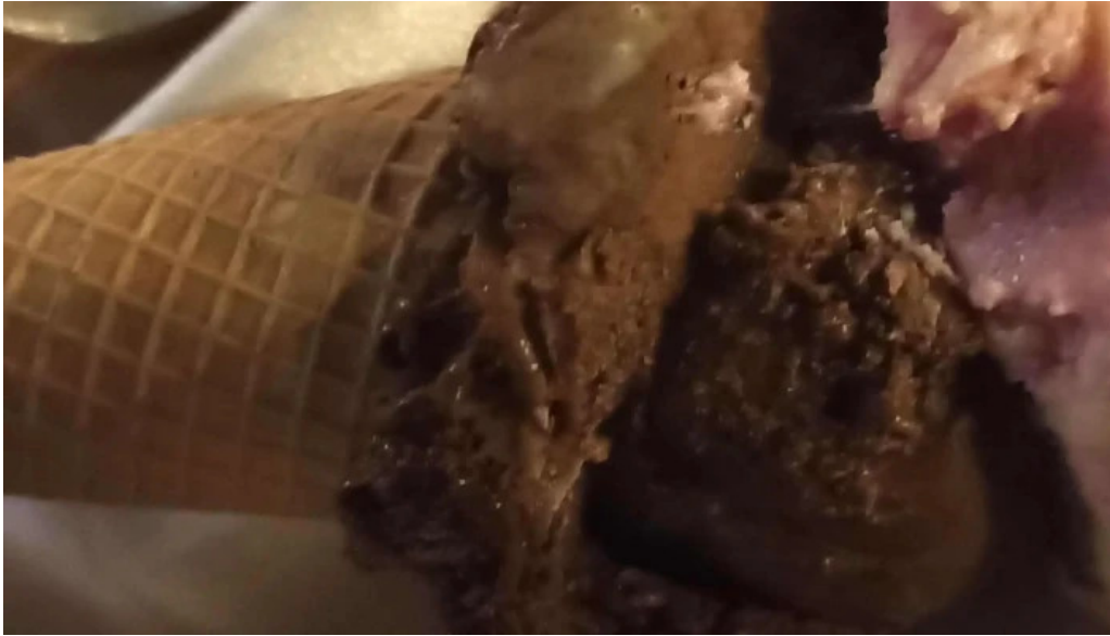
La cremeria comentario 2