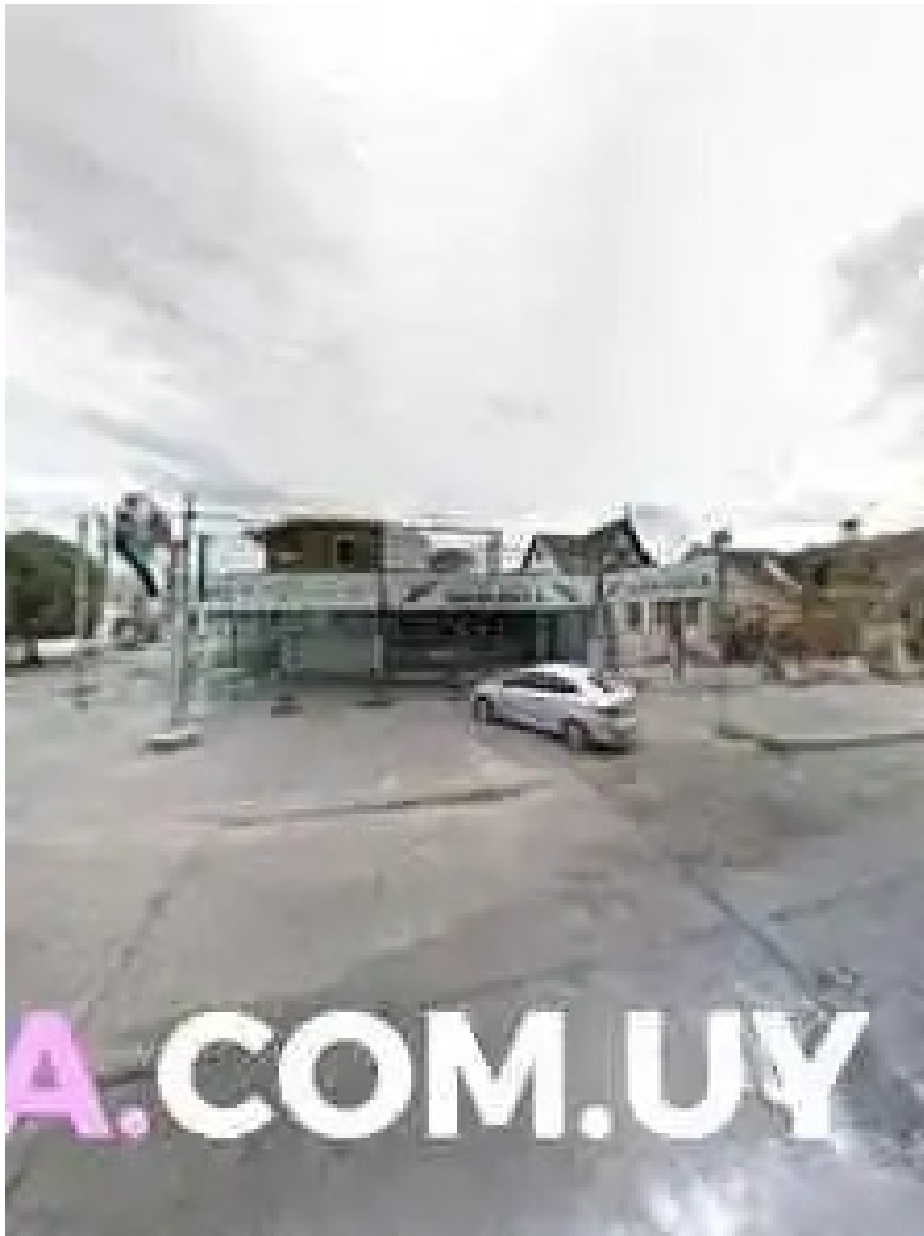
La cremeria street view y 360