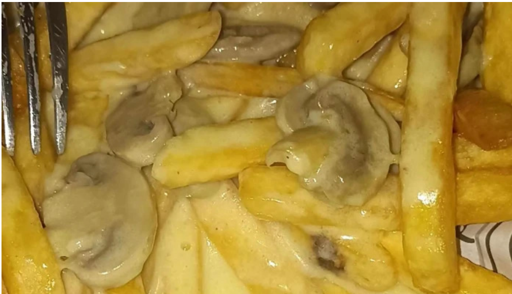
La cremeria comentario 3