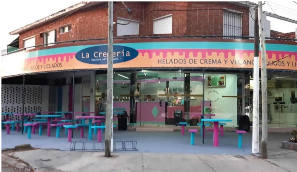
La cremería todo