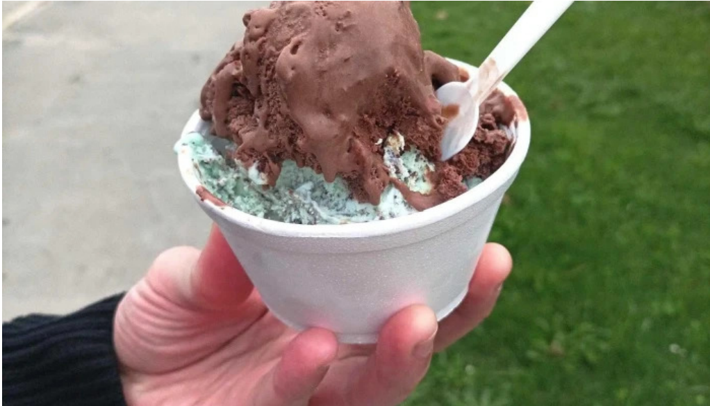
La cremeria comentario 4