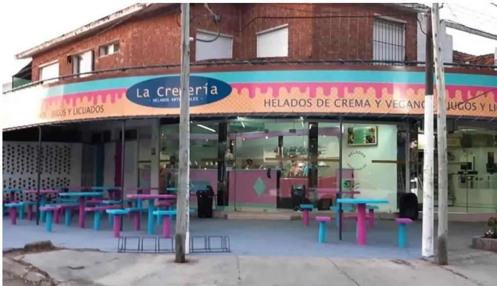
La cremeria la floresta