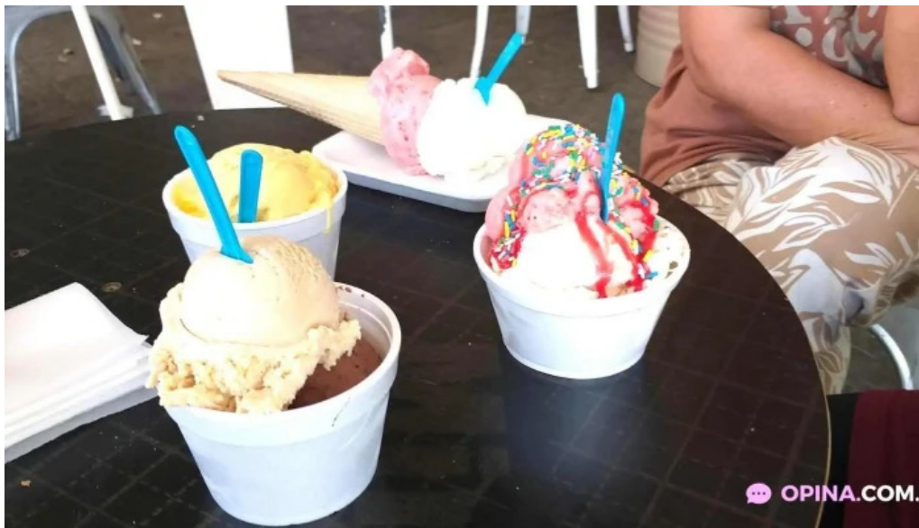
La cremeria helado