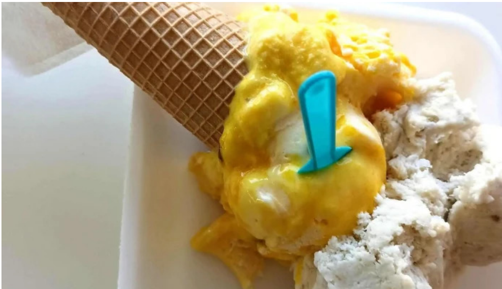
La cremeria comentario 5