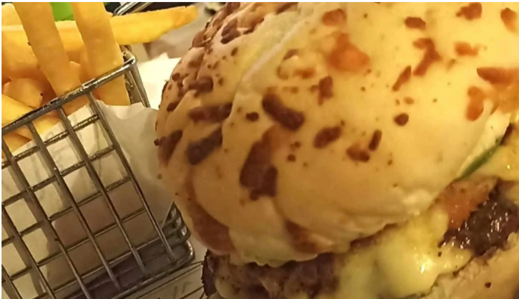
La cremeria comentario 1