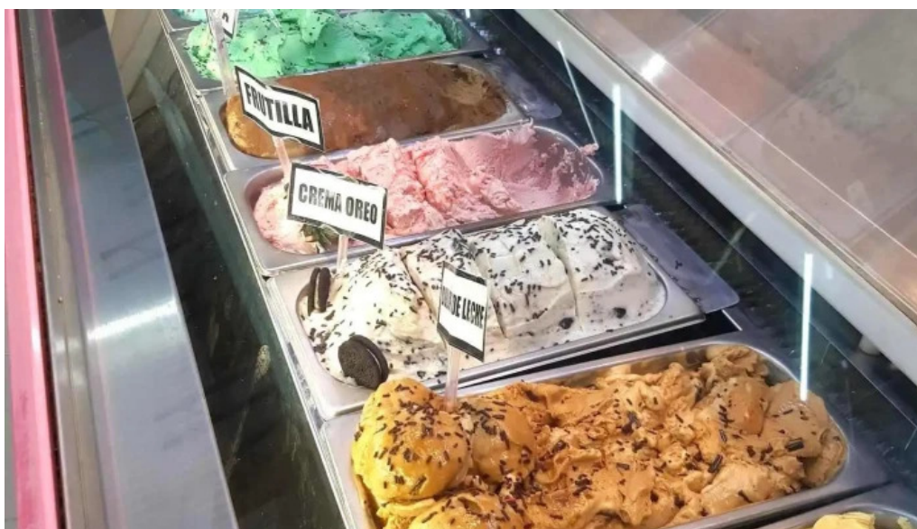
La cremeria ambiente