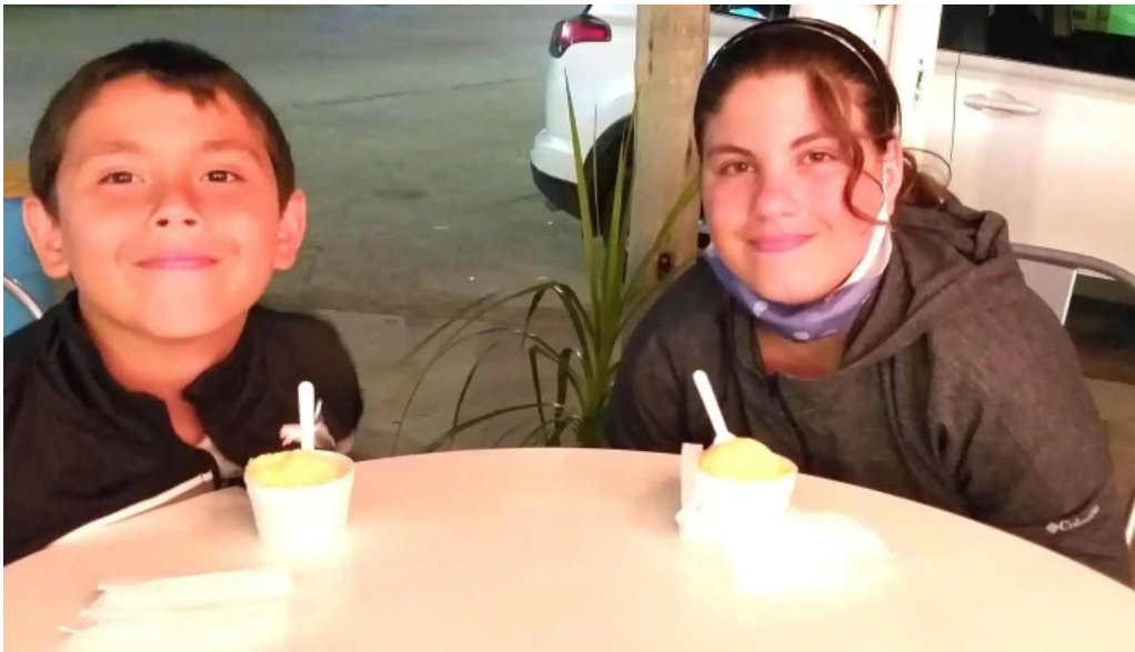
La cremeria comentario 9