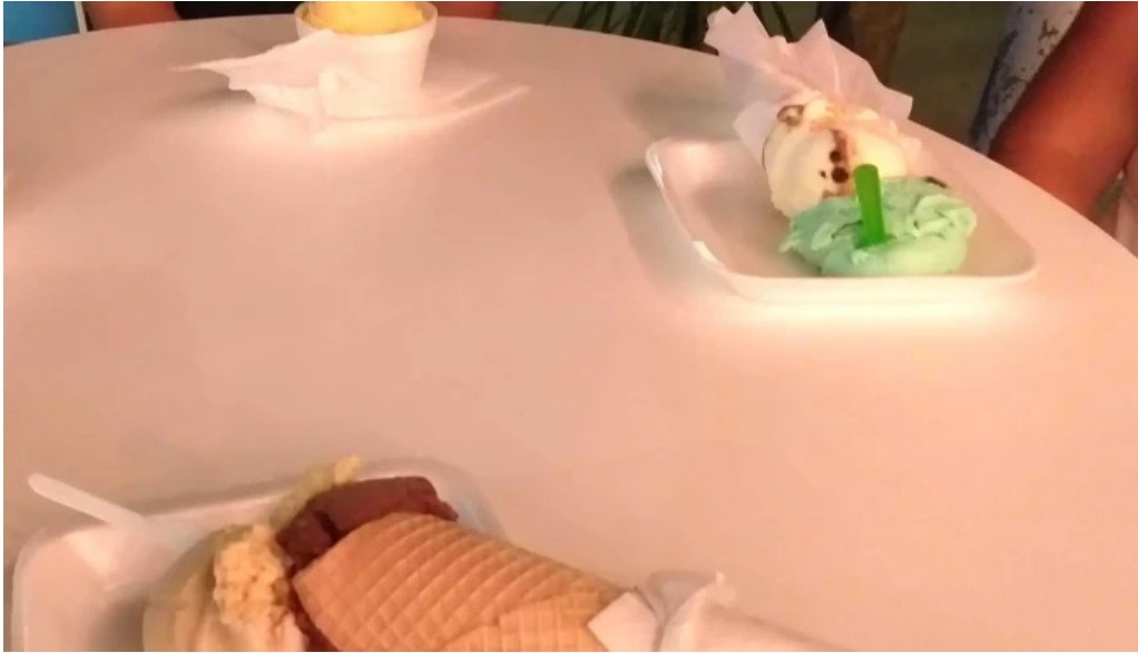
La cremeria comentario 8