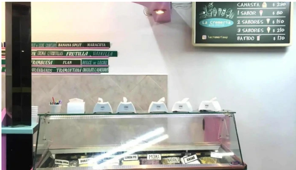
La cremeria menu