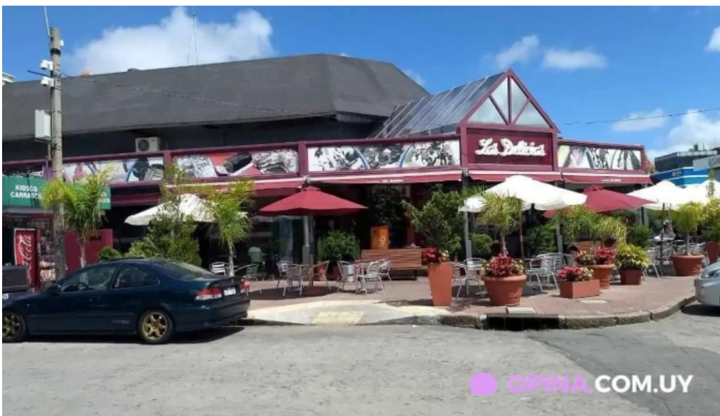
Heladeria las delicias todas