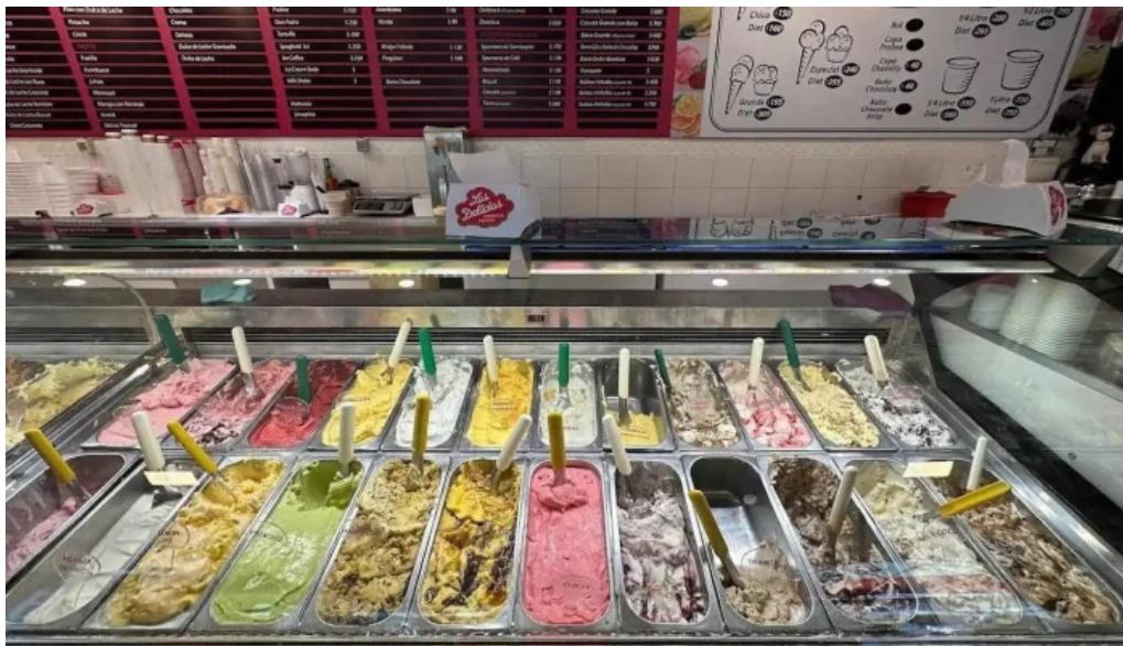
Heladería las delicias ambiente