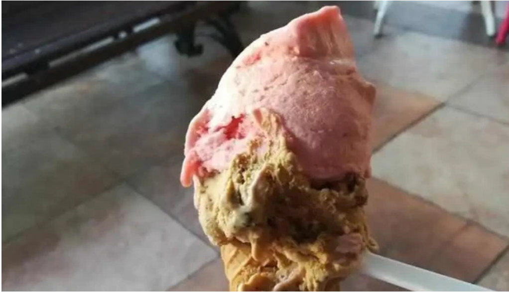
Heladeria las delicias helado