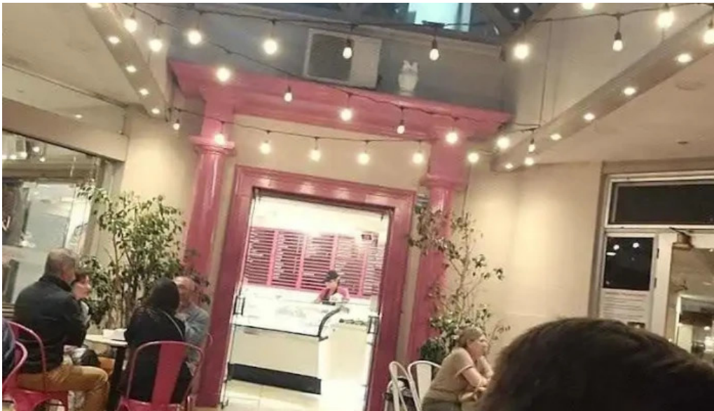
Heladeria las delicias mas recientes