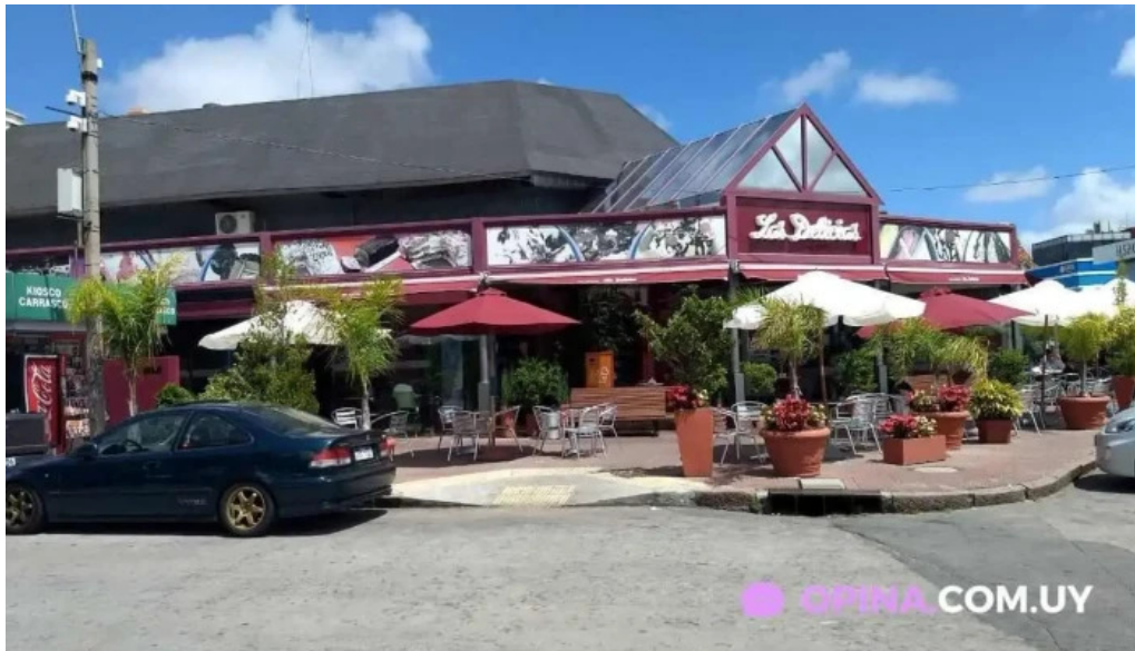
Heladeria las delicias montevideo