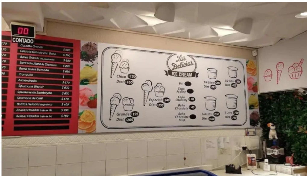
Heladeria las delicias menu