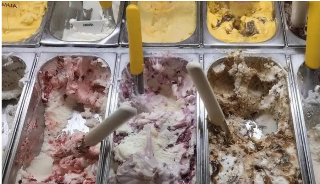
Heladería las delicias comida y bebida