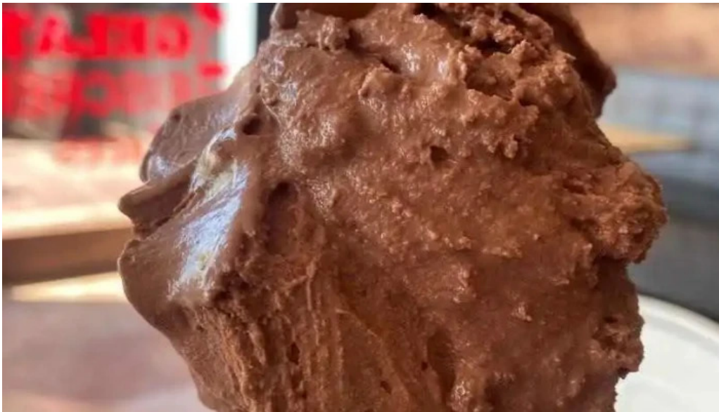
Heladeria las delicias helado italiano