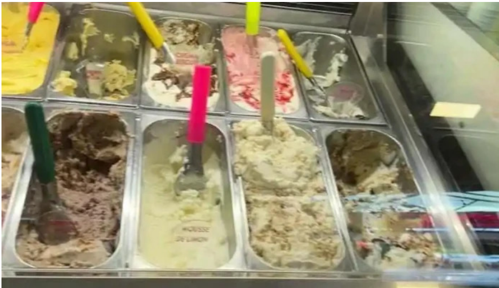
Heladeria las delicias videos