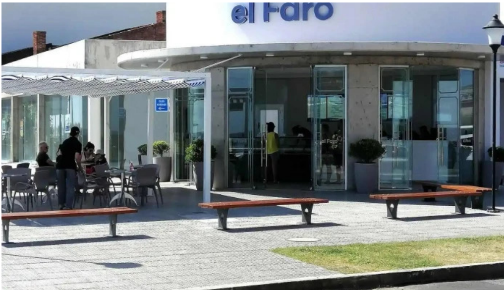
Heladeria el faro todo