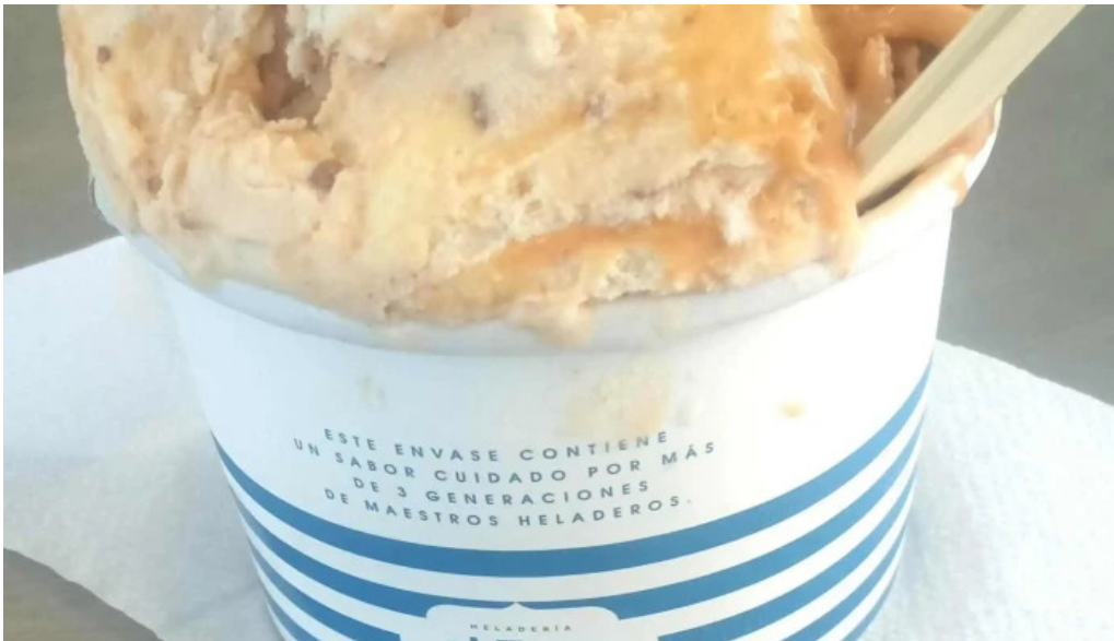
Heladería el faro comentario 7