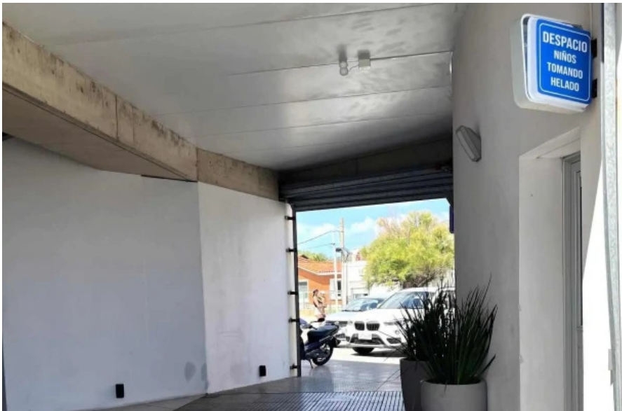
Heladeria el faro comentario 9