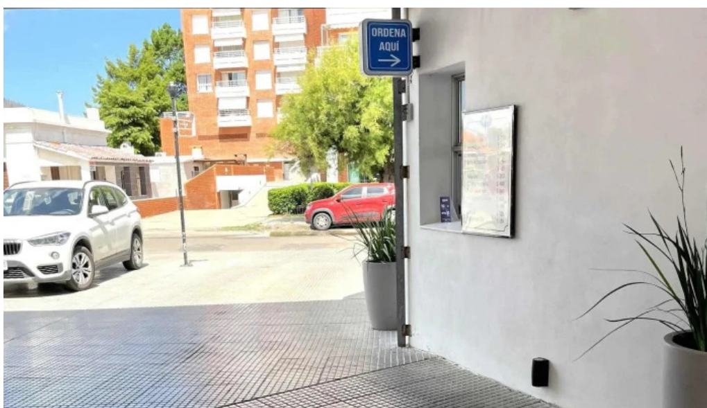
Heladeria el faro comentario 10