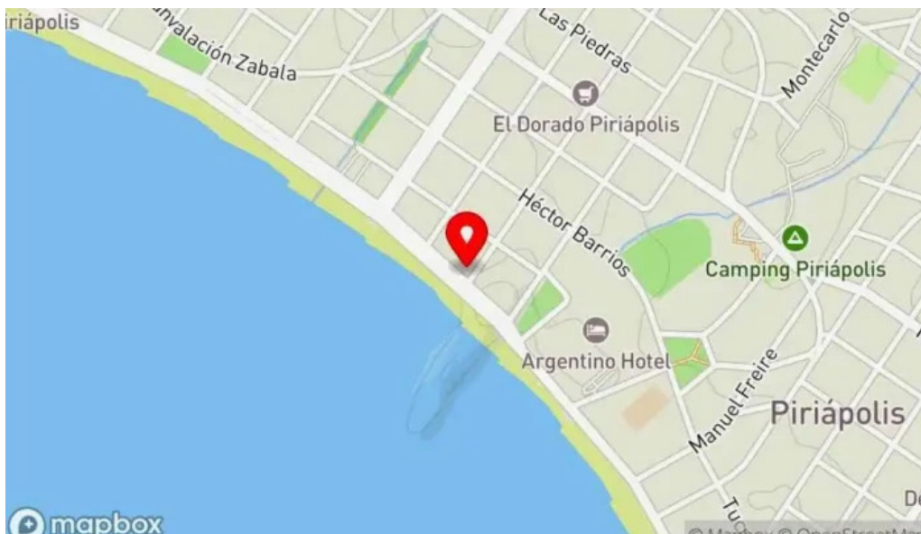
Heladería el faro mapa