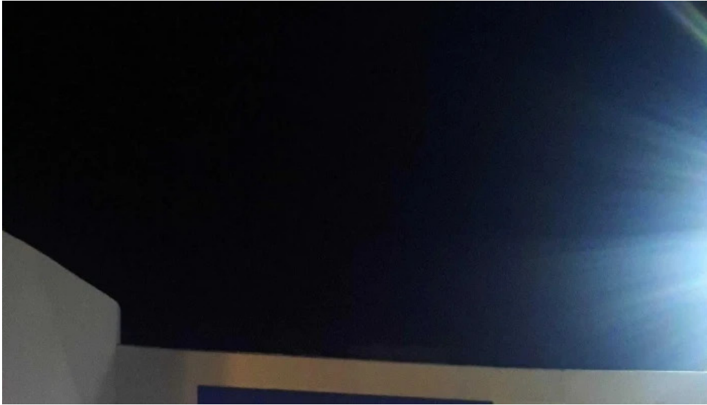
Heladeria el faro comentario 6