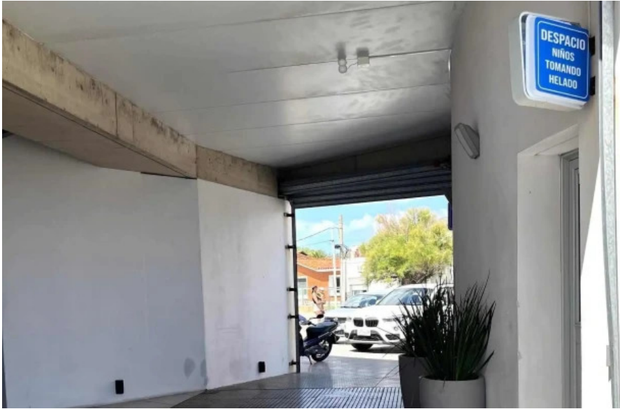
Heladeria el faro comentario 2