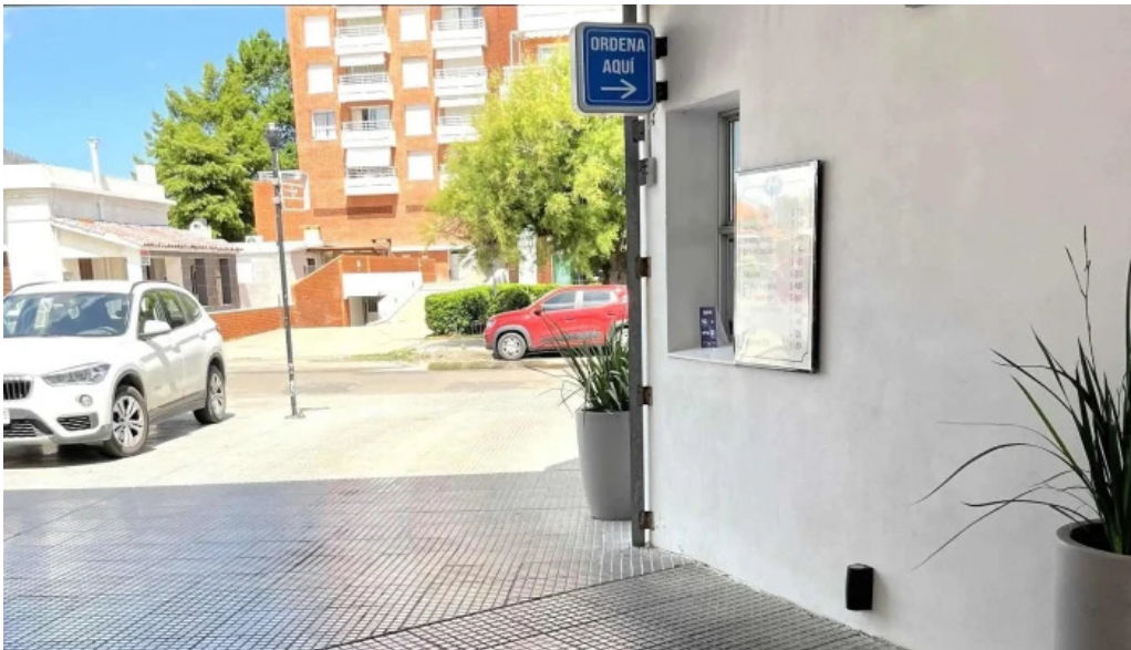
Heladeria el faro comentario 3