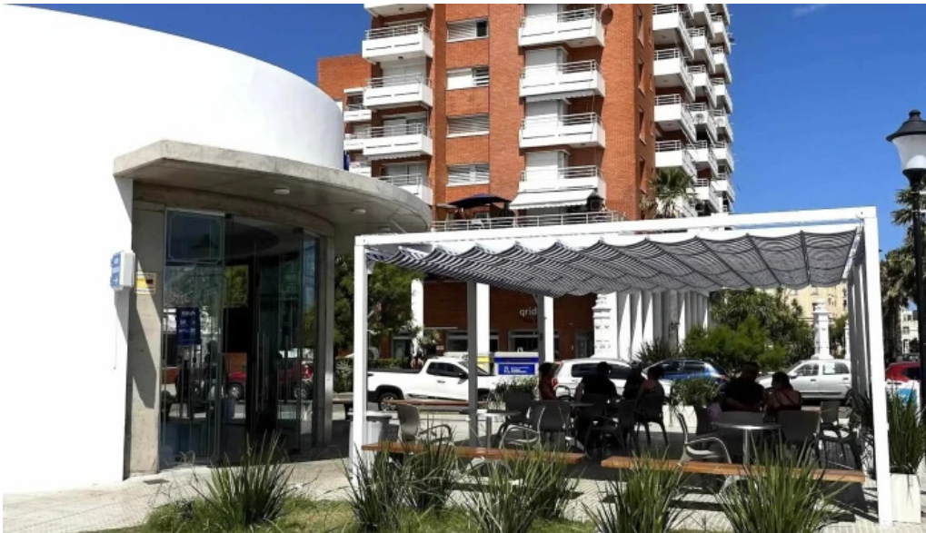
Heladería el faro comentario 8