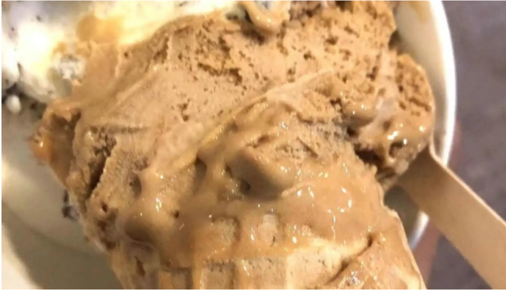
Heladeria el faro comidas y bebidas