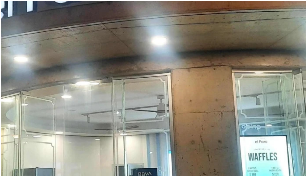
Heladeria el faro comentario 5