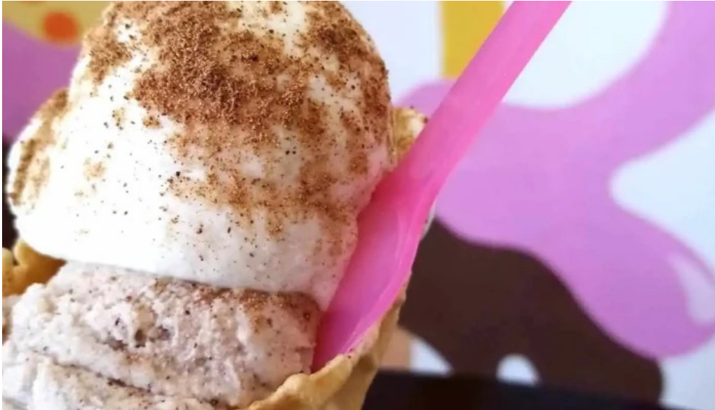
Heladeria del abuelo malvin helado italiano