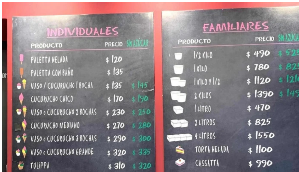
Heladeria del abuelo malvin comentario 1