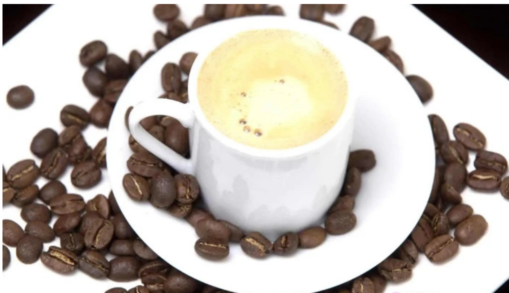
Heladeria del abuelo malvin cafe