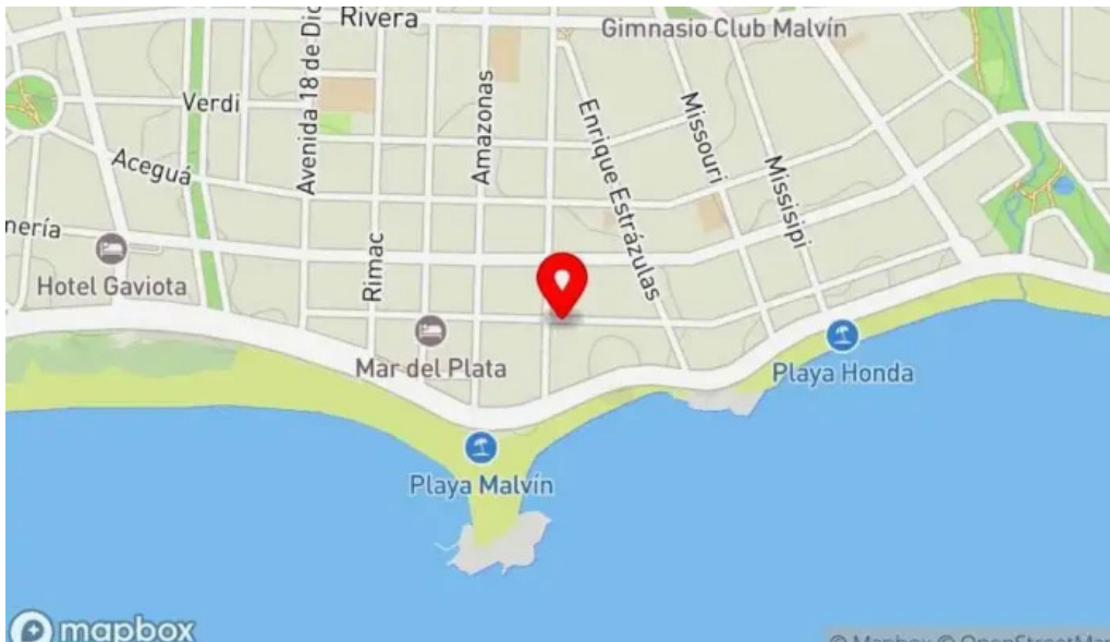
Heladería del abuelo malvin mapa