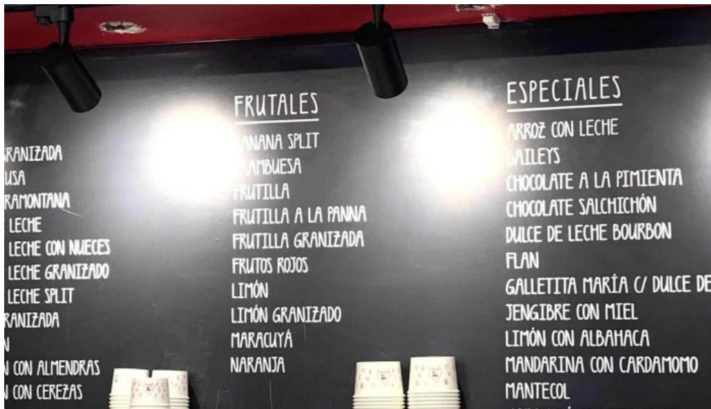
Heladería del abuelo malvin comentario 4