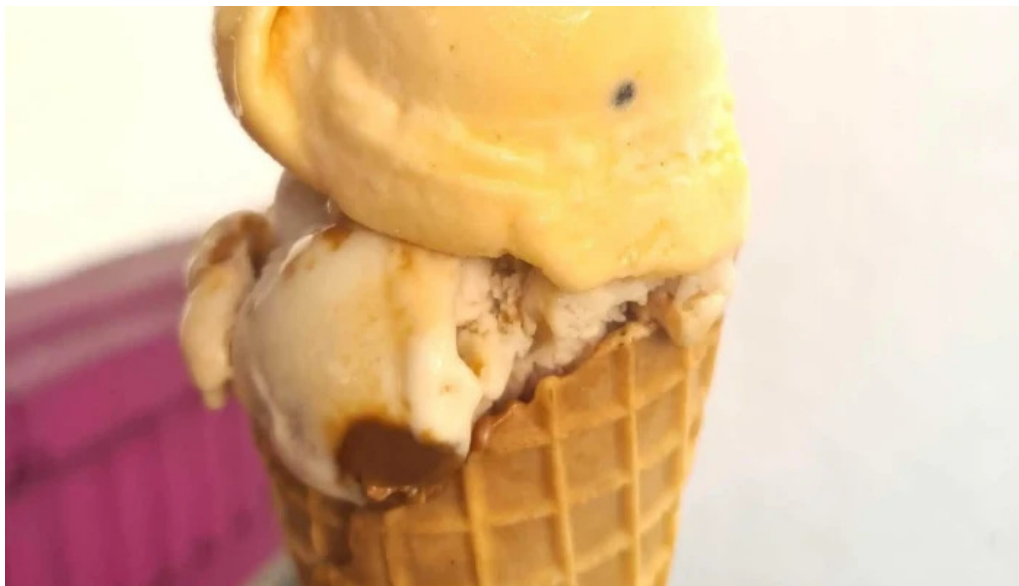
Heladeria del abuelo malvin comentario 5