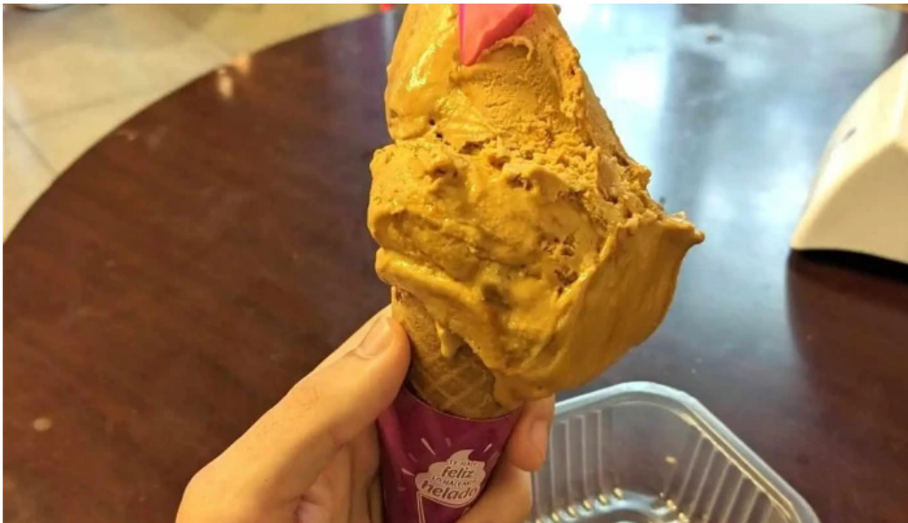
Heladería del abuelo malvin helado