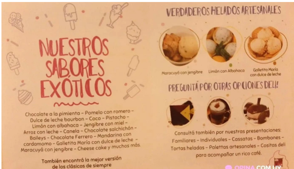
Heladeria del abuelo malvin menu