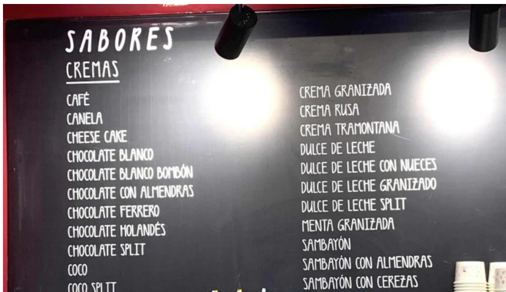
Heladeria del abuelo malvin comentario 2