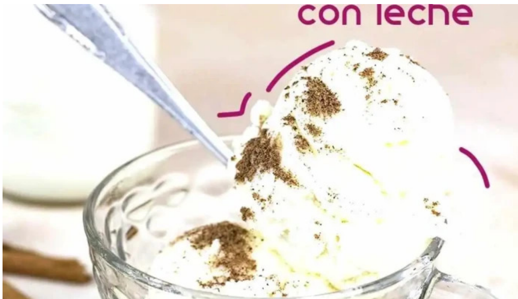
Heladeria del abuelo malvin comidas y bebidas