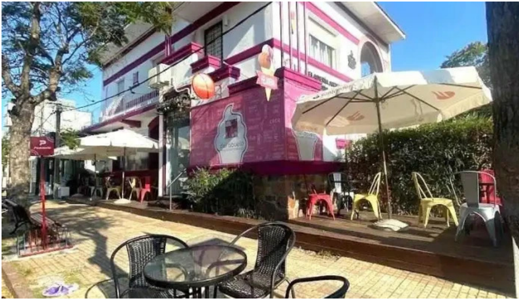
Heladeria del abuelo malvin montevideo