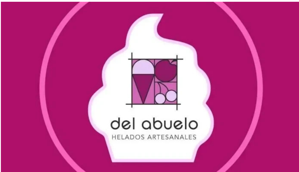
Heladeria del abuelo malvin del propietario