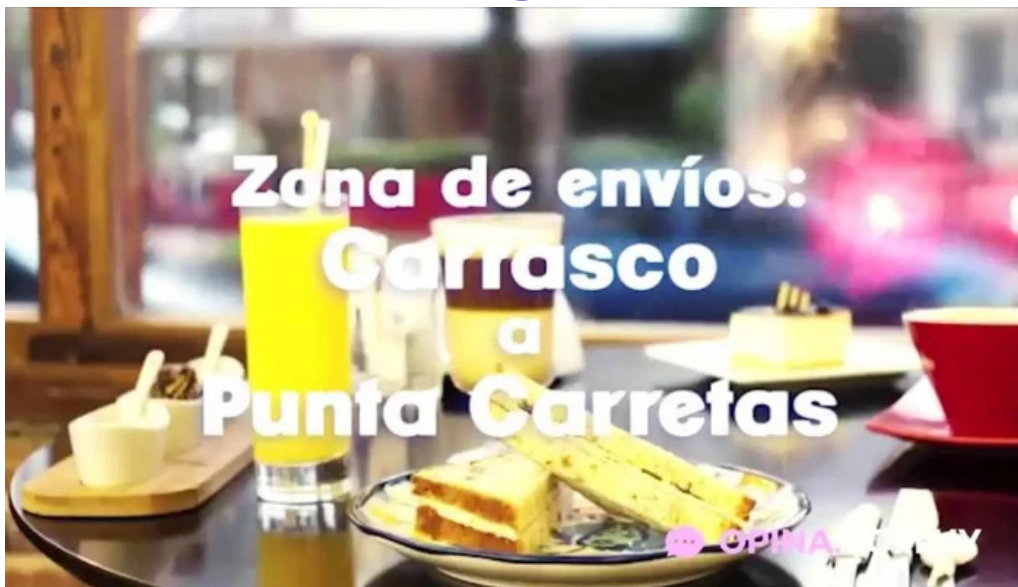
Heladeria del abuelo malvin videos