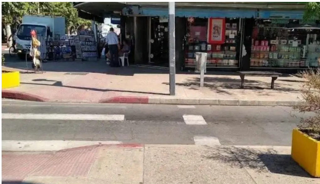
Heladeria artesanal el faro las piedras las piedras