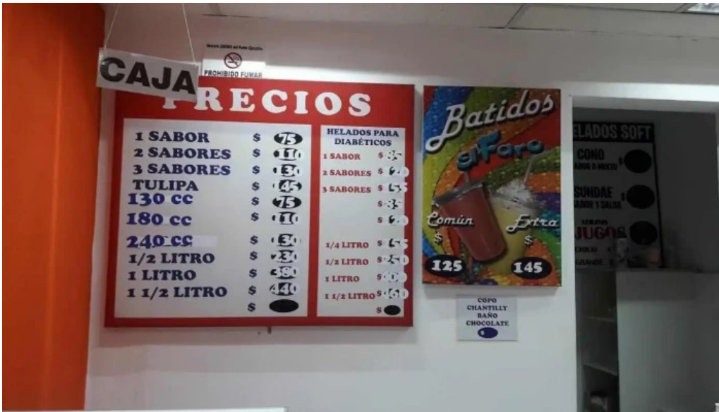
Heladeria artesanal el faro las piedras menu