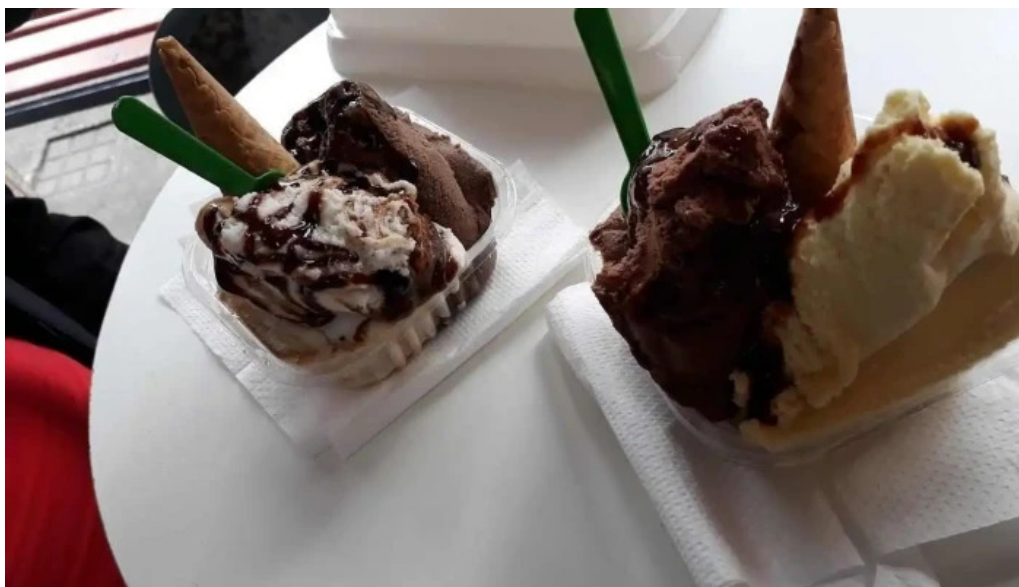
Heladería artesanal el faro las piedras helado