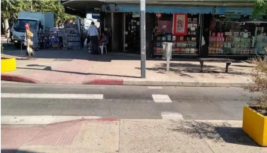
Heladeria artesanal el faro las piedras todas