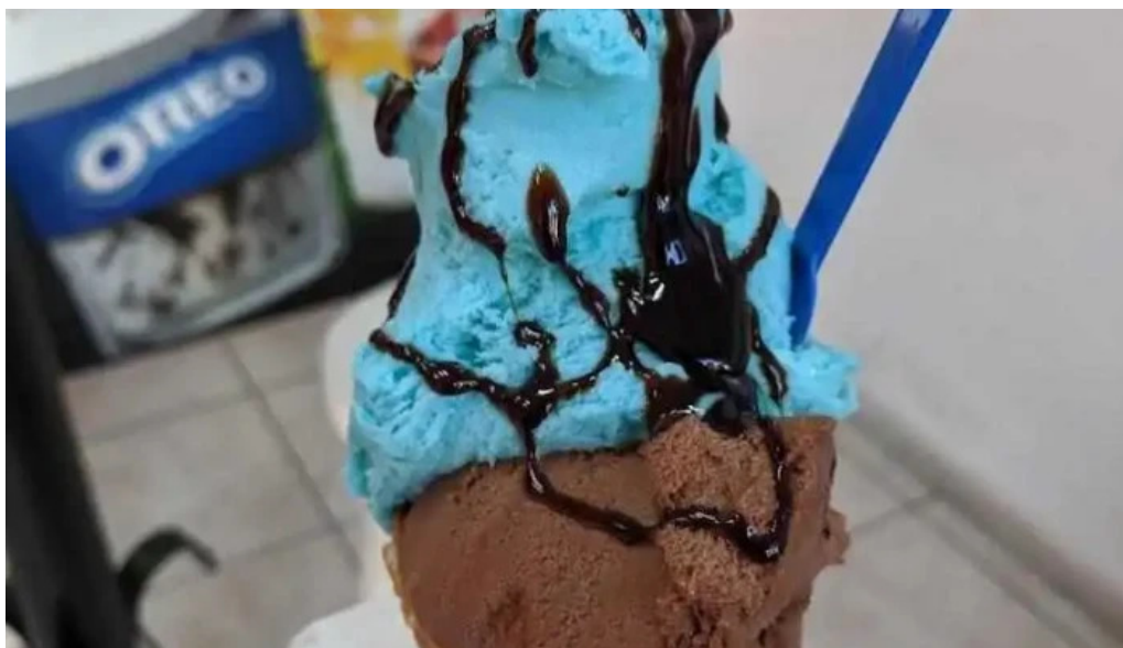
Heladería artesanal el faro las piedras comida y bebida