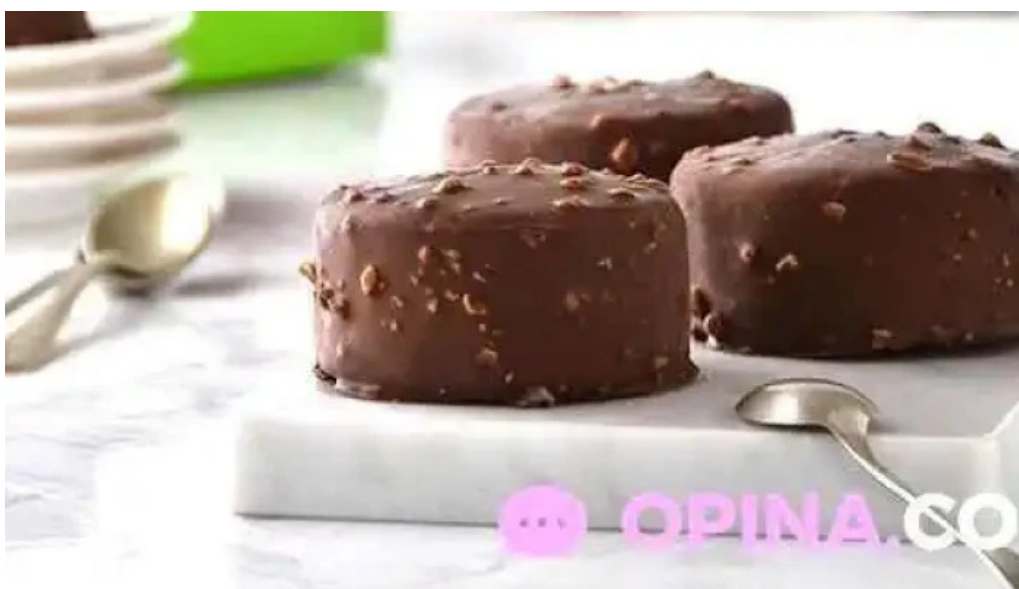
Grido las piedras Il dr pouey comidas y bebidas