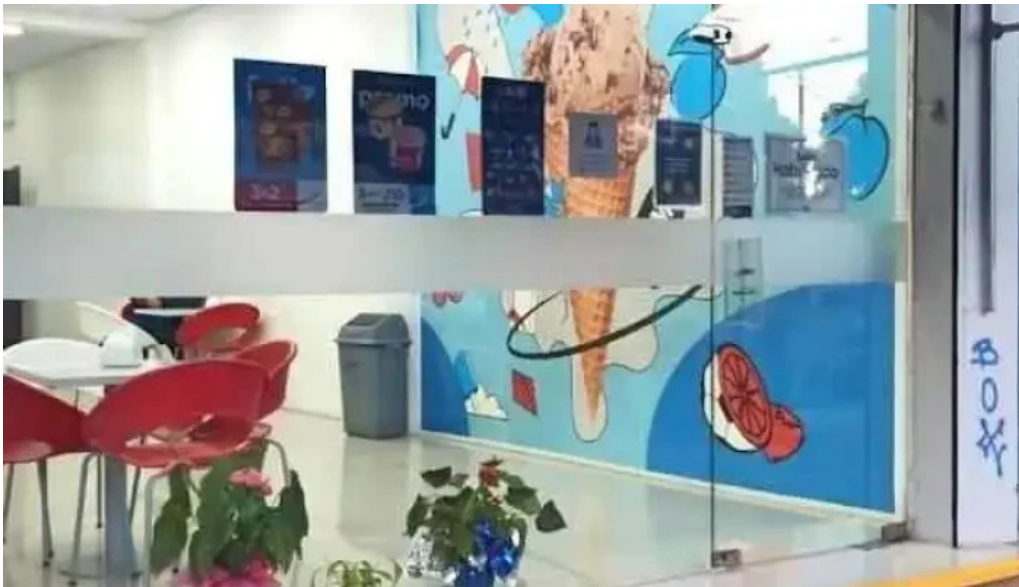
Grido las piedras Il dr pouey las piedras