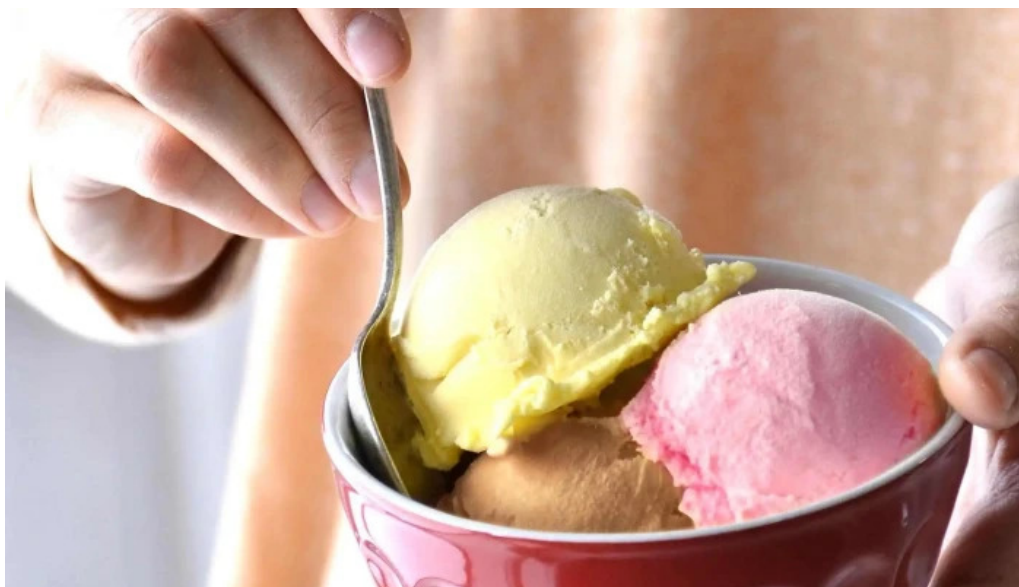
Grido las piedras Il dr pouey del propietario