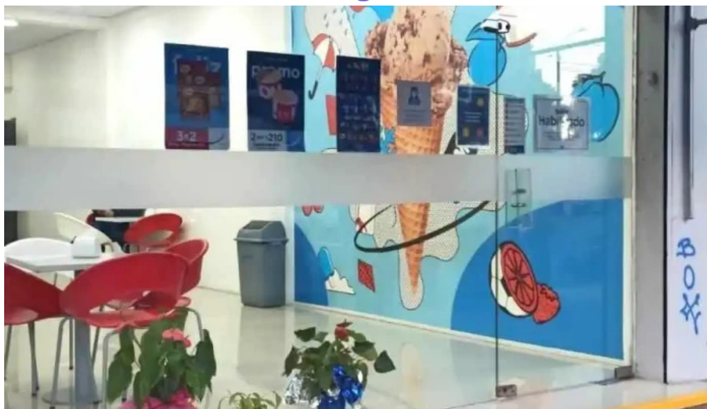
Grido las piedras ll dr pouey todo