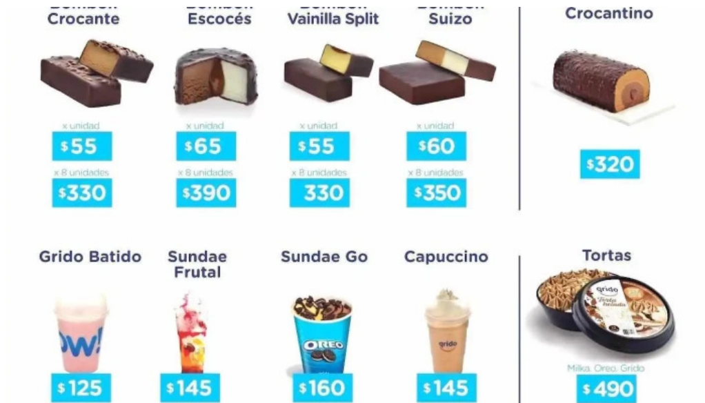
Grido las piedras II dr pouey menu