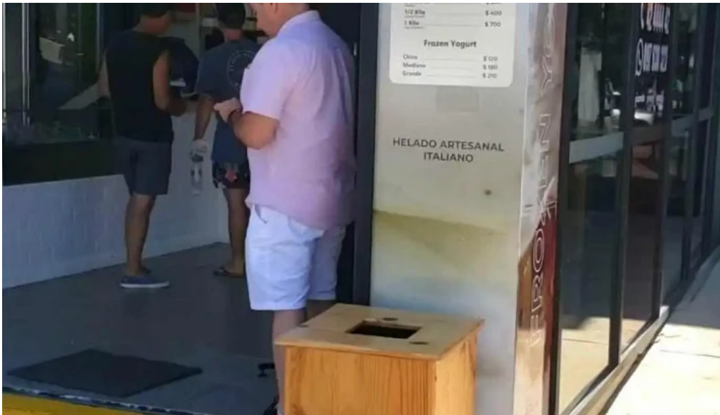
Gelateria il porto helados artesanales menu