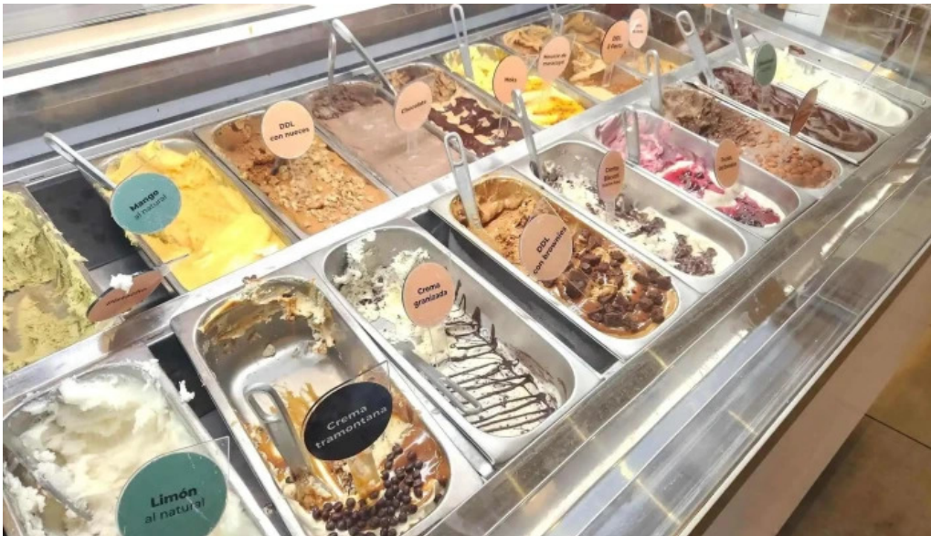
Gelateria il porto helados artesanales ambiente