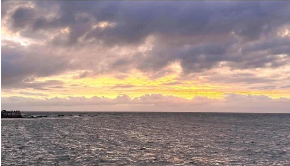
Gelateria il porto helados artesanales comentario 1