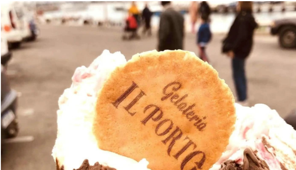
Gelateria il porto helados artesanales comentario 6