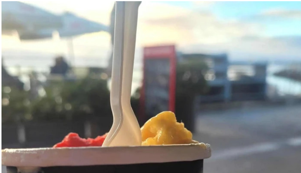
Gelateria il porto helados artesanales comentario 4