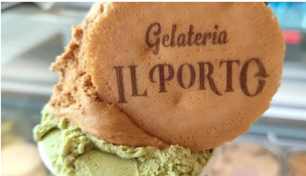
Gelateria il porto helados artesanales helado italiano