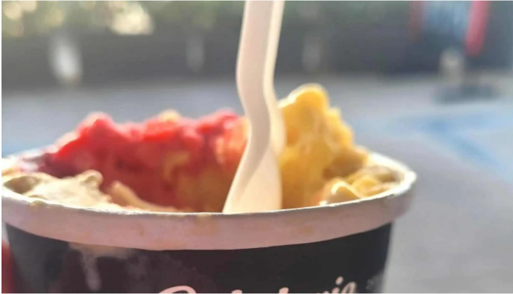
Gelateria il porto helados artesanales comentario 3