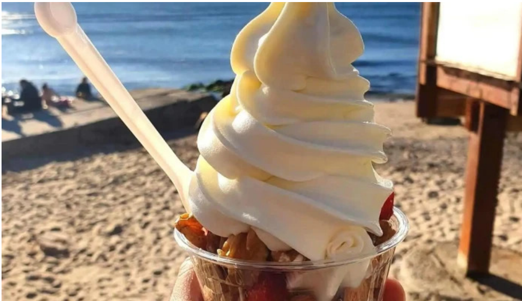
Gelateria il porto helados artesanales helado