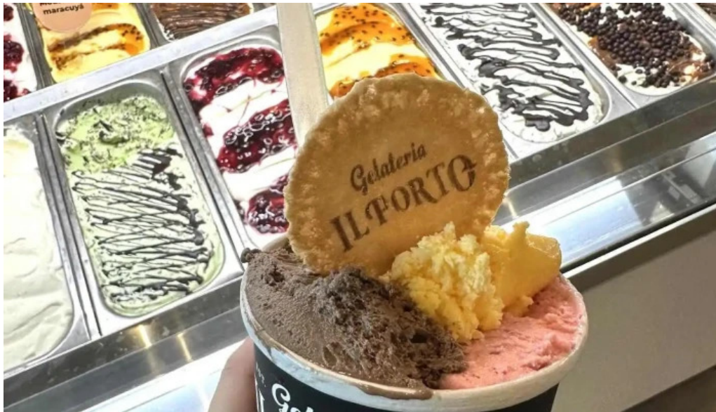
Gelateria il porto helados artesanales recientes