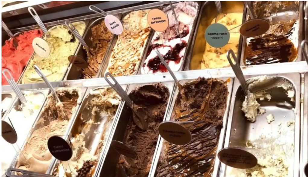
Gelateria il porto helados artesanales comentario 5