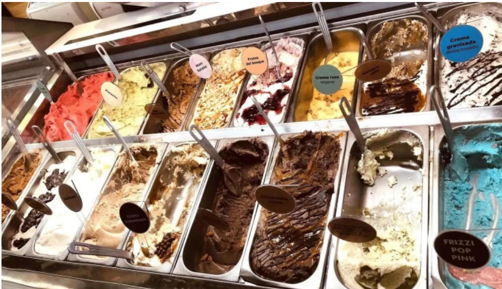
Gelateria il porto helados artesanales comidas y bebidas