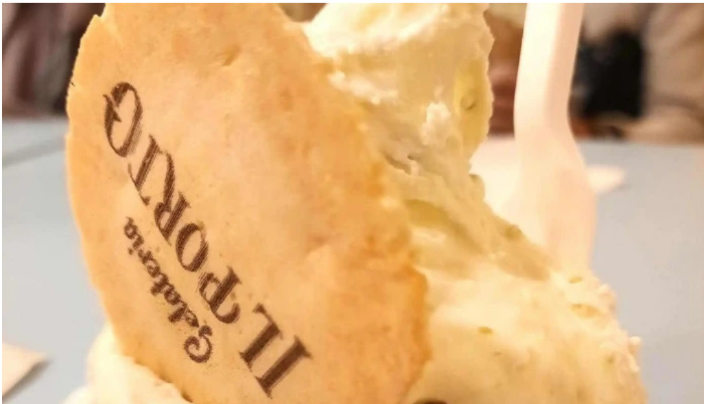
Gelateria il porto helados artesanales comentario 2