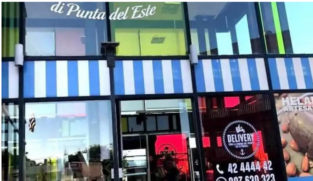
Gelateria il porto helados artesanales punta del este