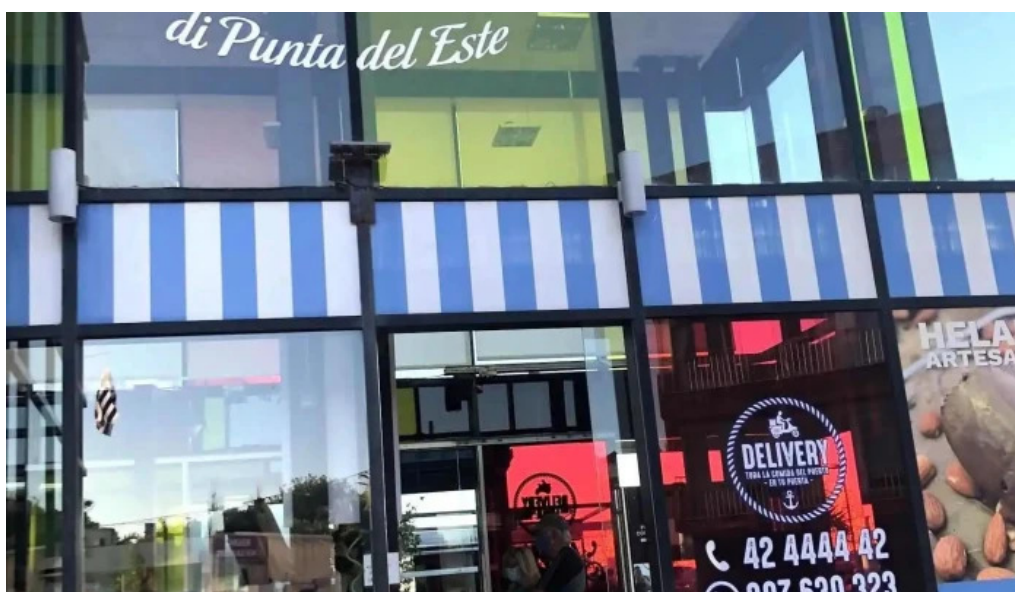
Gelateria il porto helados artesanales todo