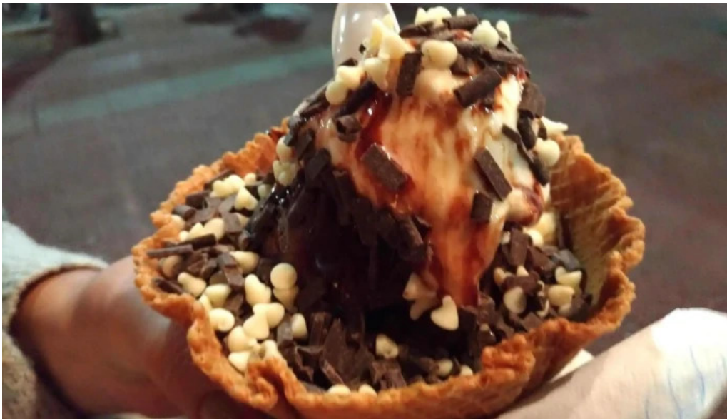
Freddo helado italiano