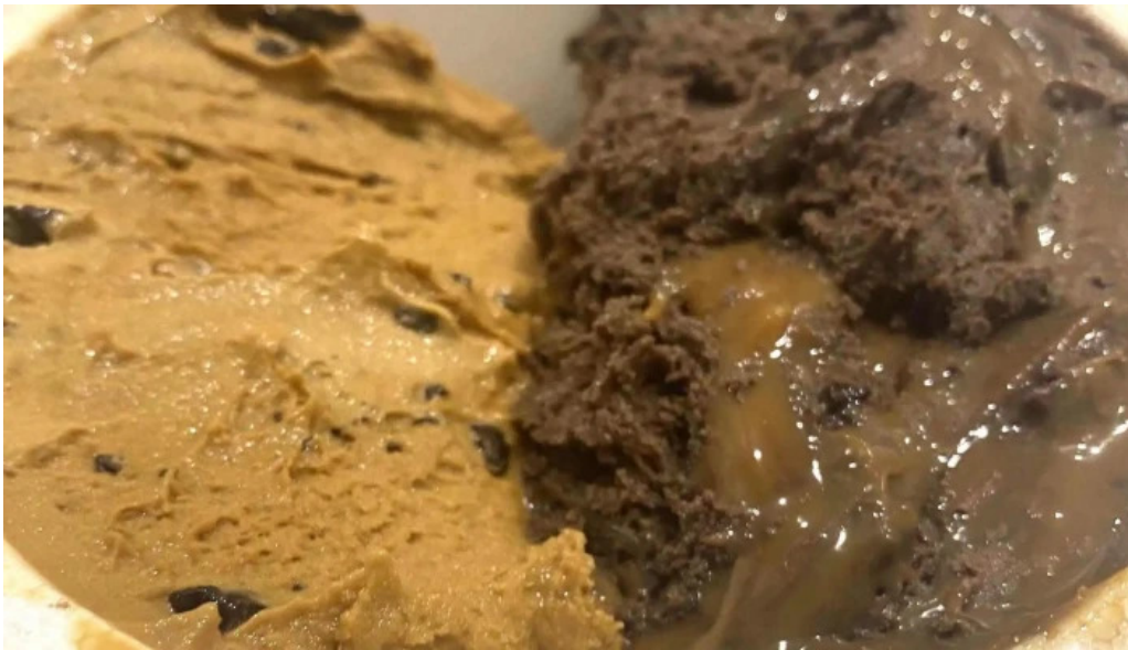
Freddo comentario 1