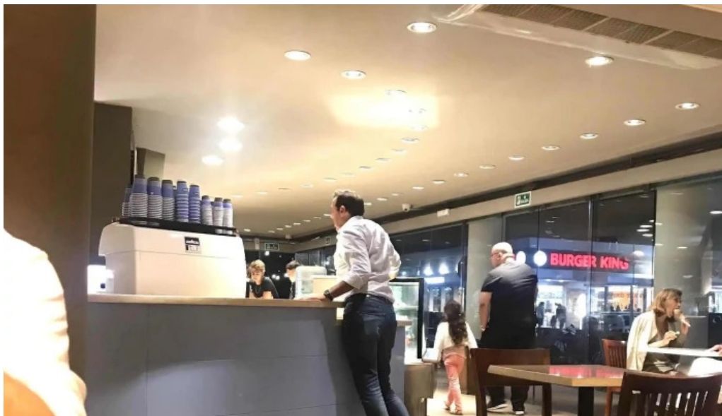
Freddo comentario 3