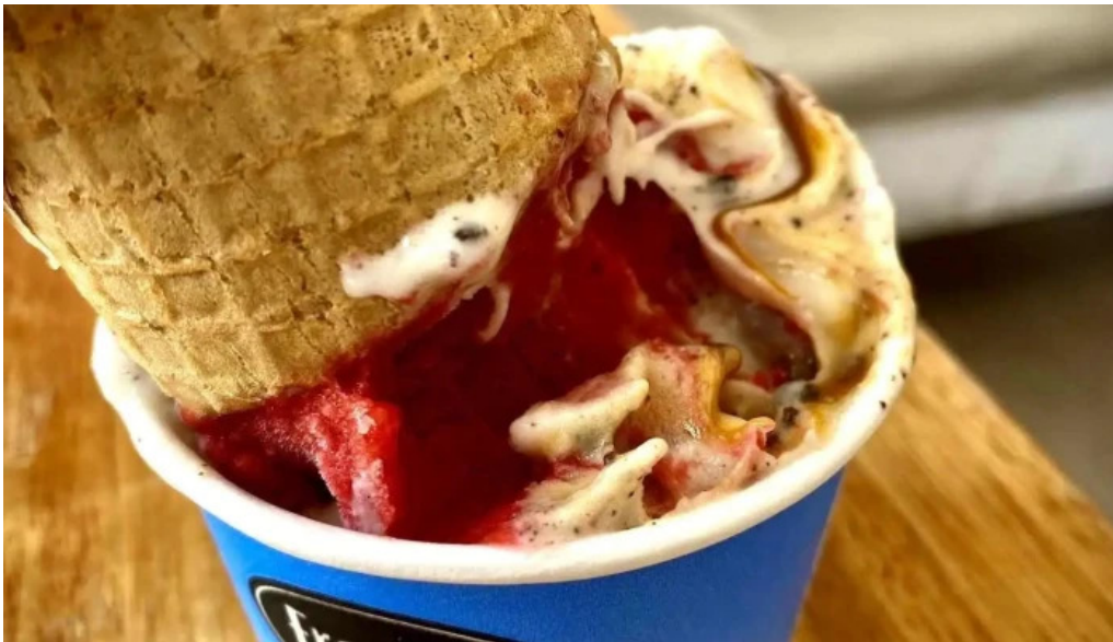
Freddo comidas y bebidas