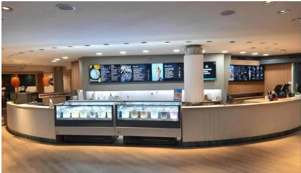
Freddo punta del este