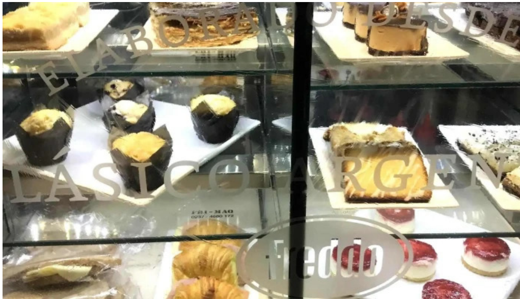
Freddo comentario 4