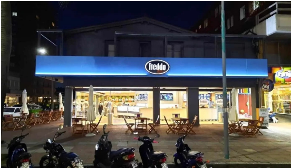
Freddo del propietario