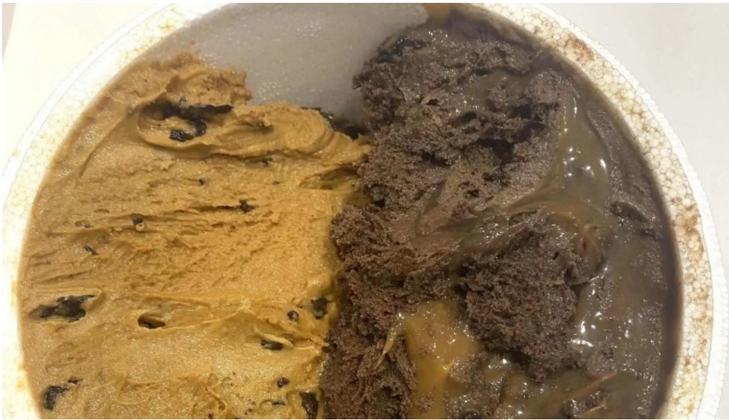
Freddo comentario 2