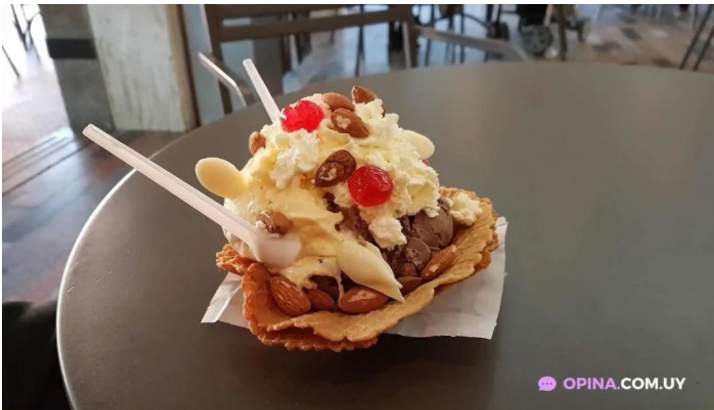
El faro comida y bebida