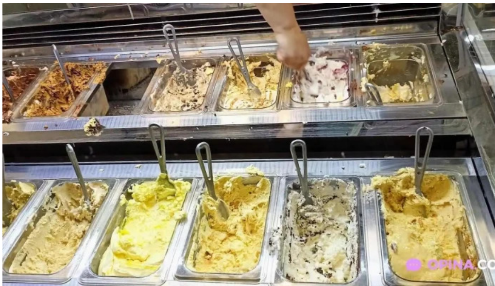
El faro helado