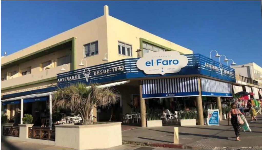
El faro todas