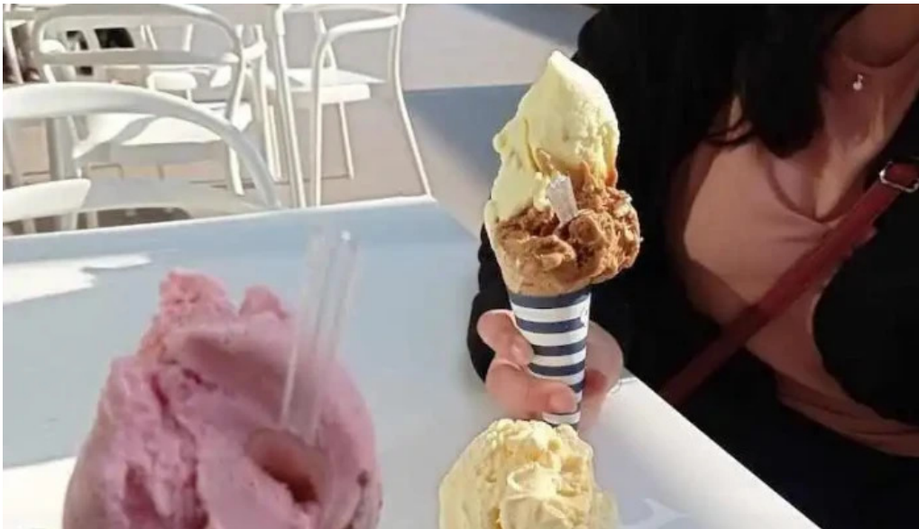
El faro helado italiano