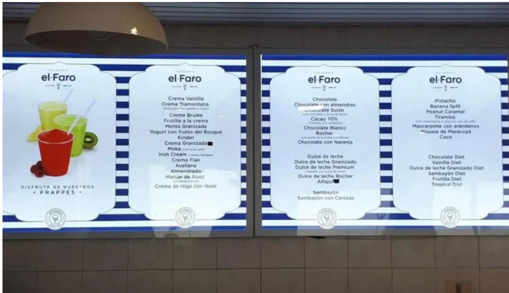
El faro menu