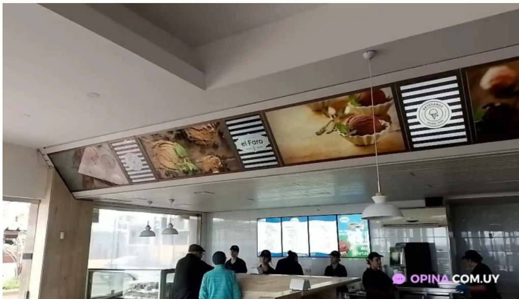
El faro videos