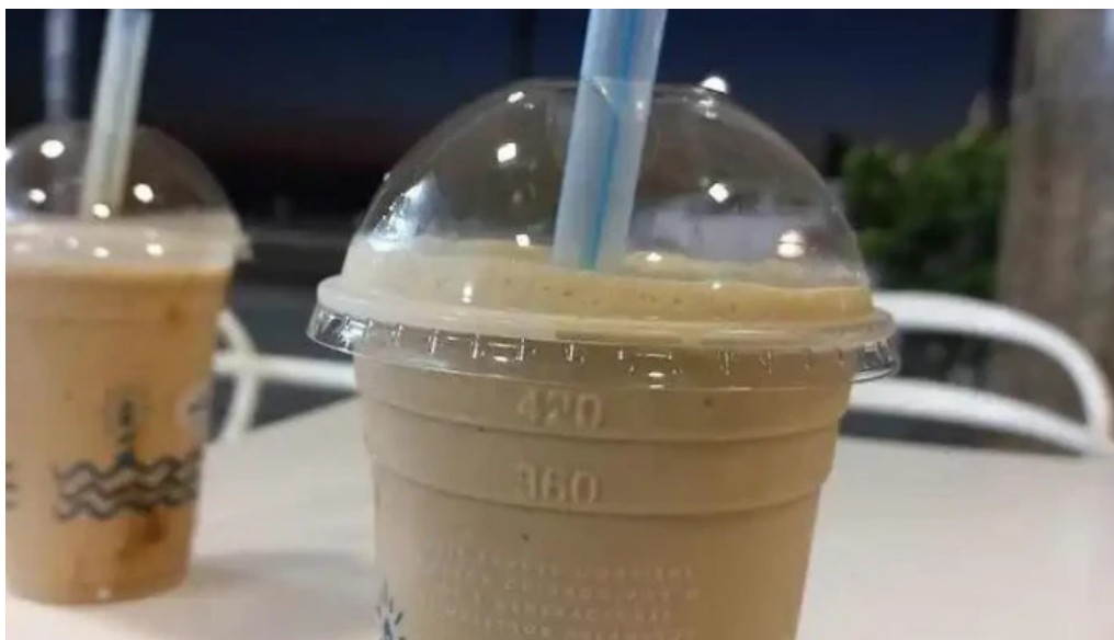
El faro cafe con hielo