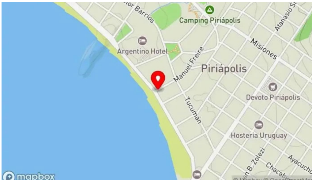
El faro mapa