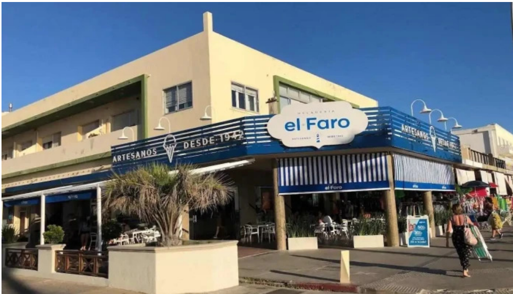
El faro piriapolis