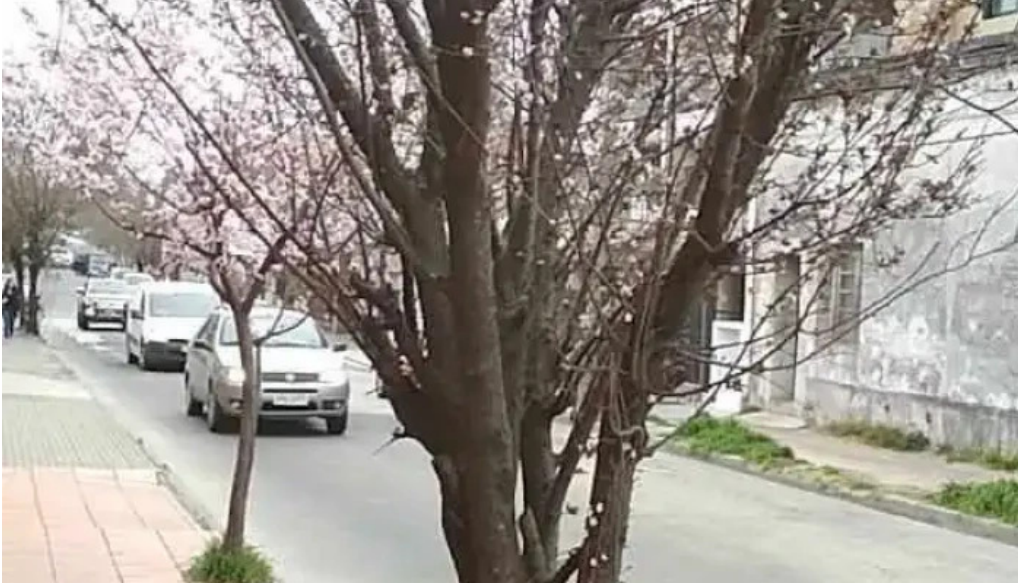
Matador el rey de la hamburguesa videos