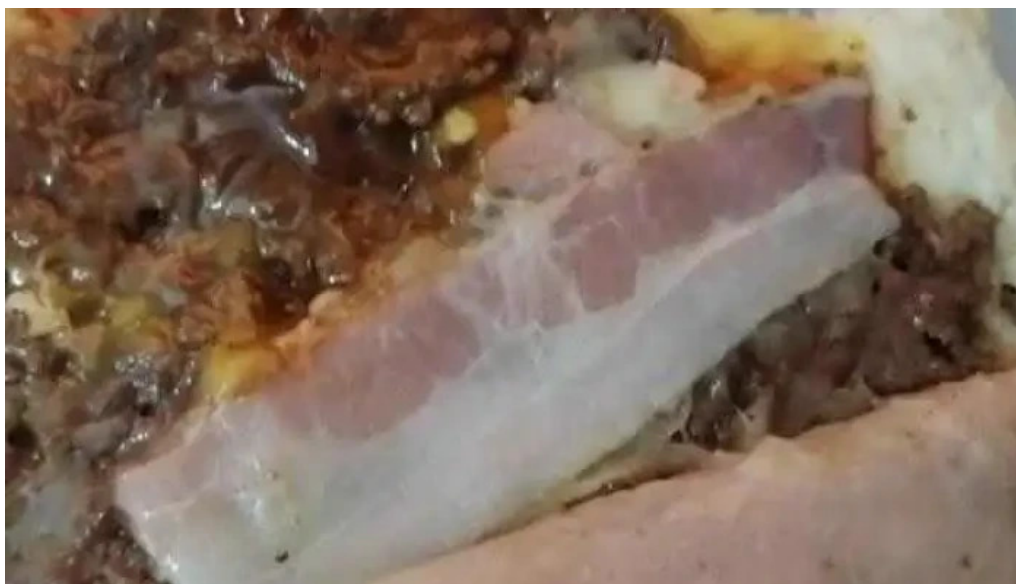
Matador el rey de la hamburguesa comida y bebida