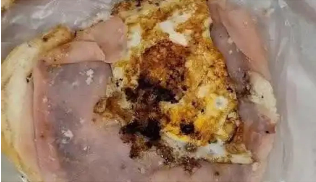
Matador el rey de la hamburguesa pando