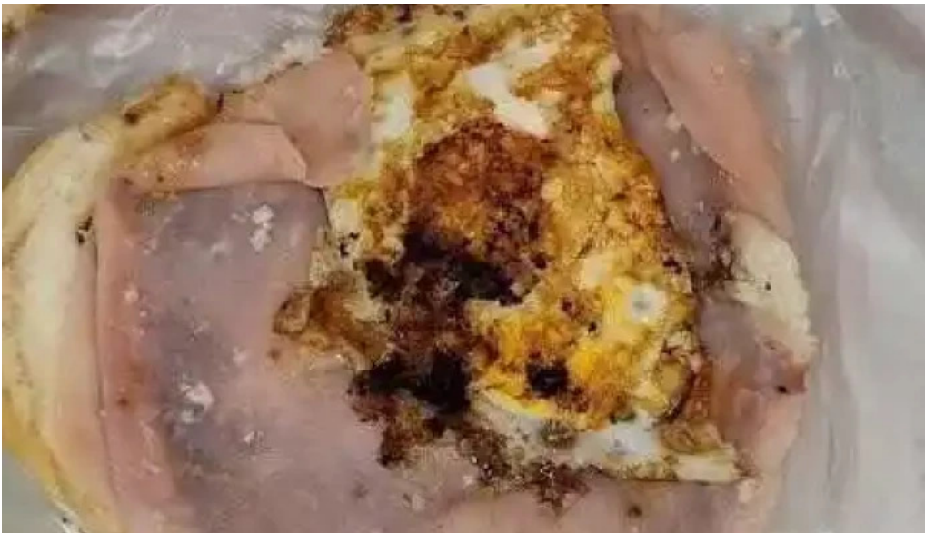
Matador el rey de la hamburguesa todas