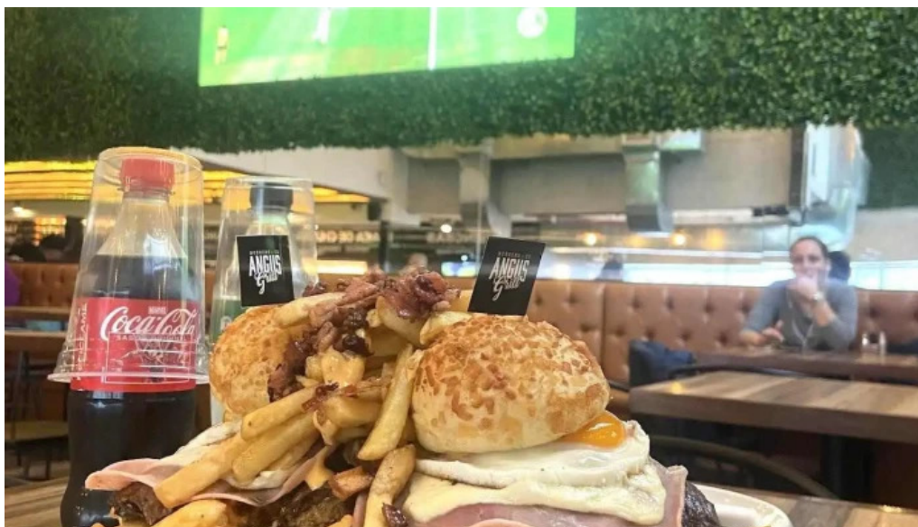
Angus grill hamburguesa