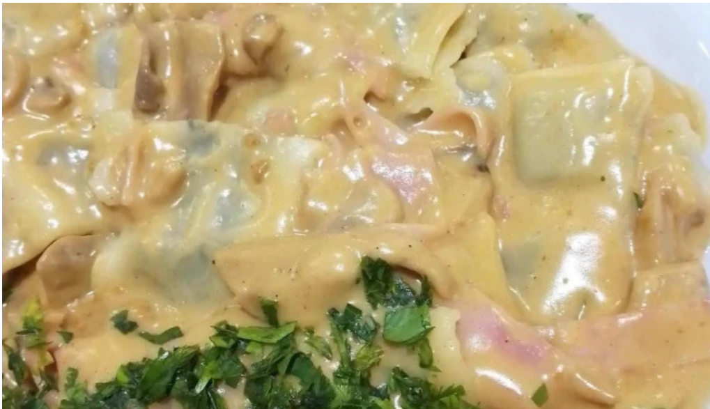
Angus grill papas fritas