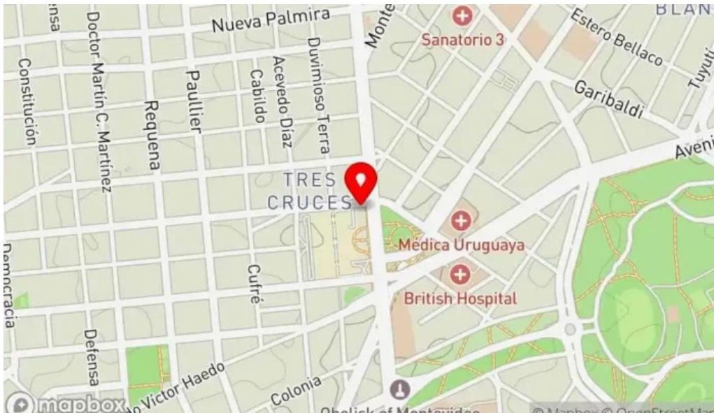
Angus grill mapa