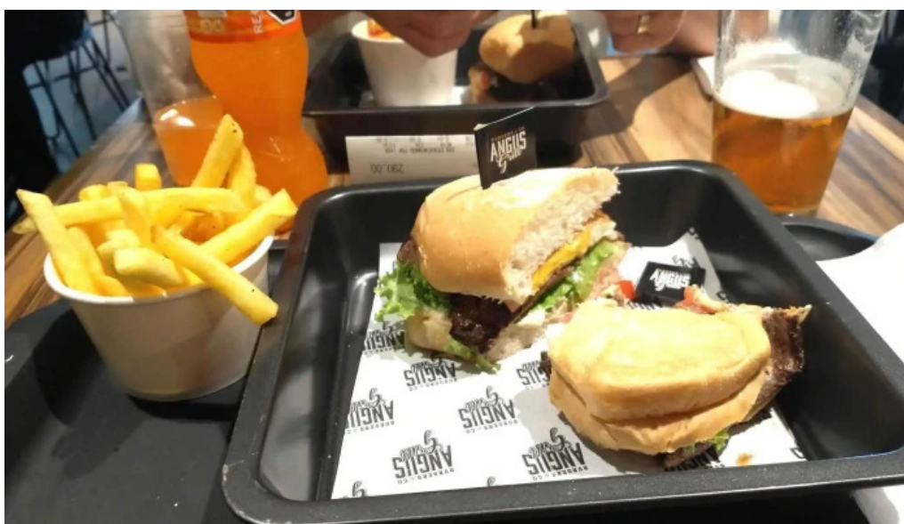
Angus grill comidas y bebidas