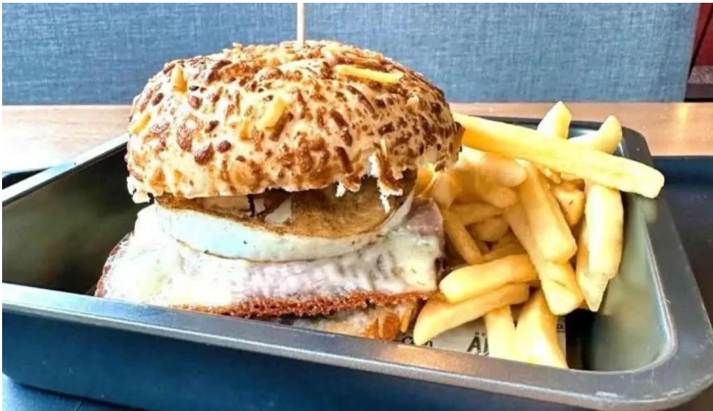
Angus grill montevideo