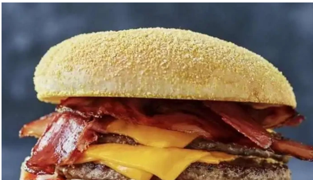
La recorre del propietario