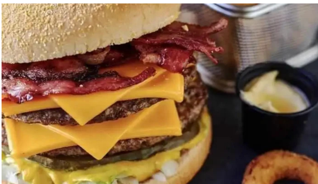
La recorre comida y bebida