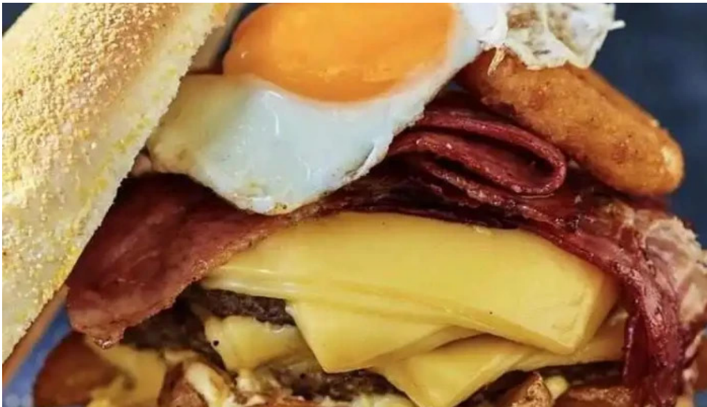
La recorre montevideo