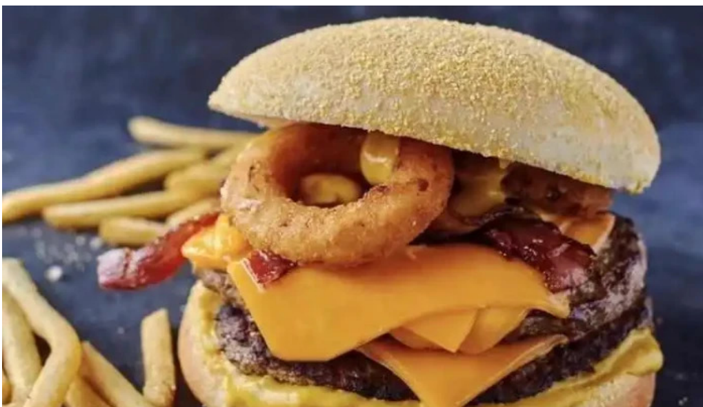
La recorre papas fritas