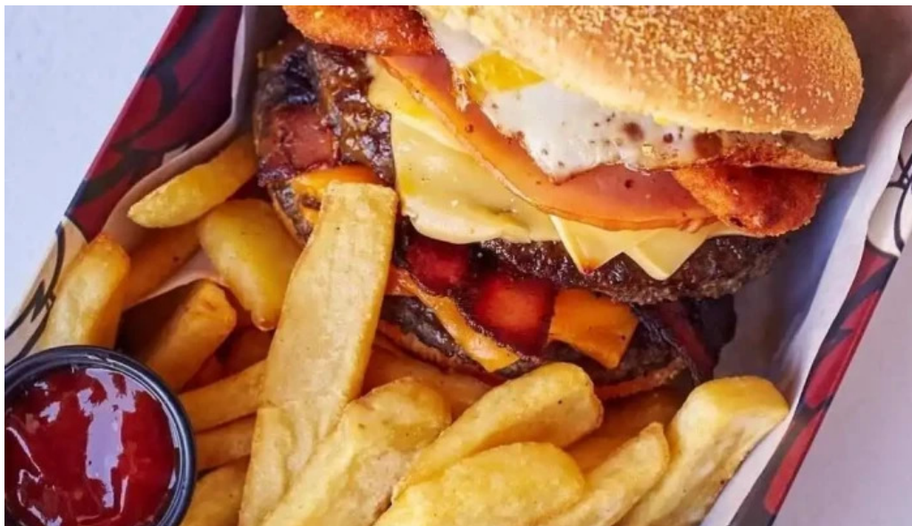
La recorre hamburguesa