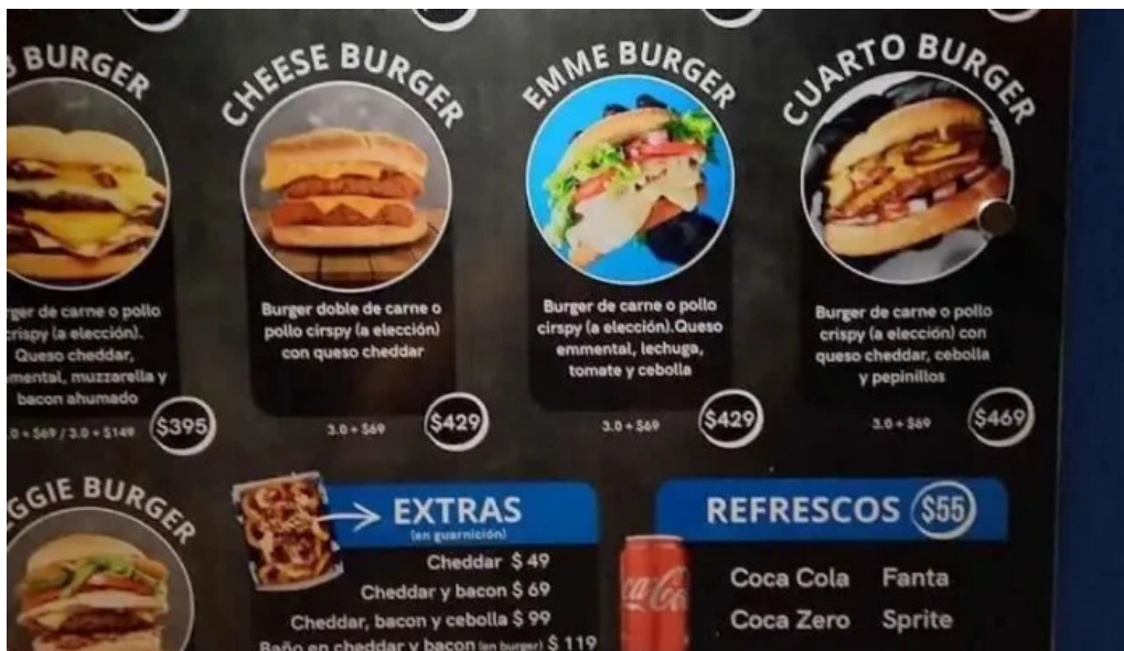
La recorre menu