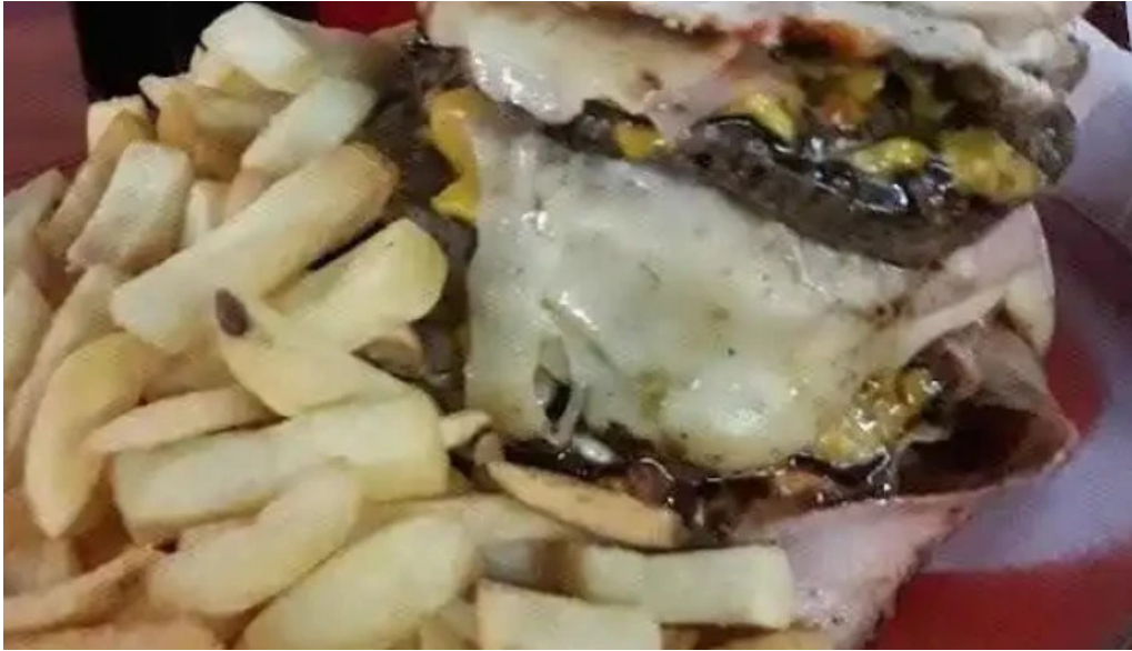
La esquina del sabor hamburguesa