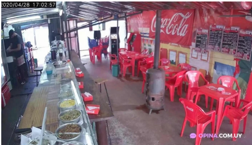
La esquina del sabor ambiente