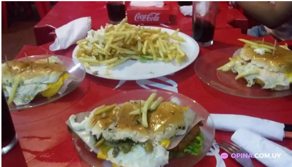
La esquina del sabor ciudad de la costa