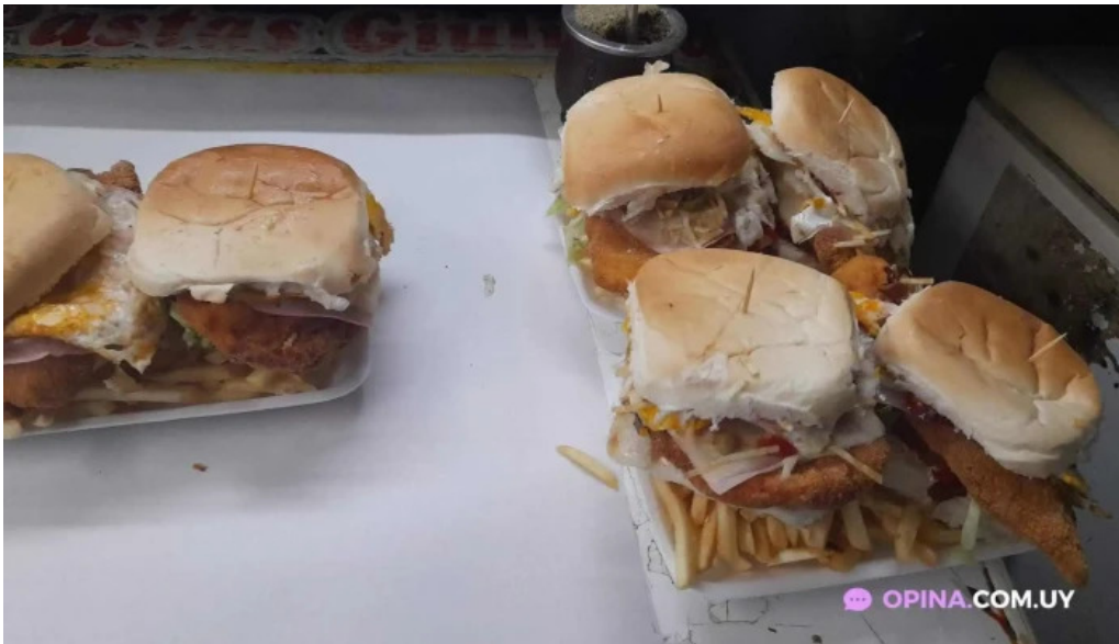
La esquina del sabor comida y bebida