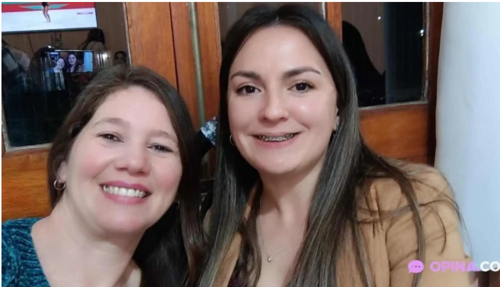
Chiviteria la via todas