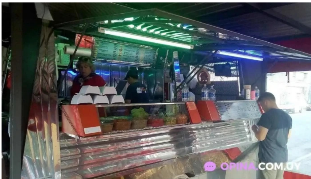
Carrito la nueva terminal ambiente