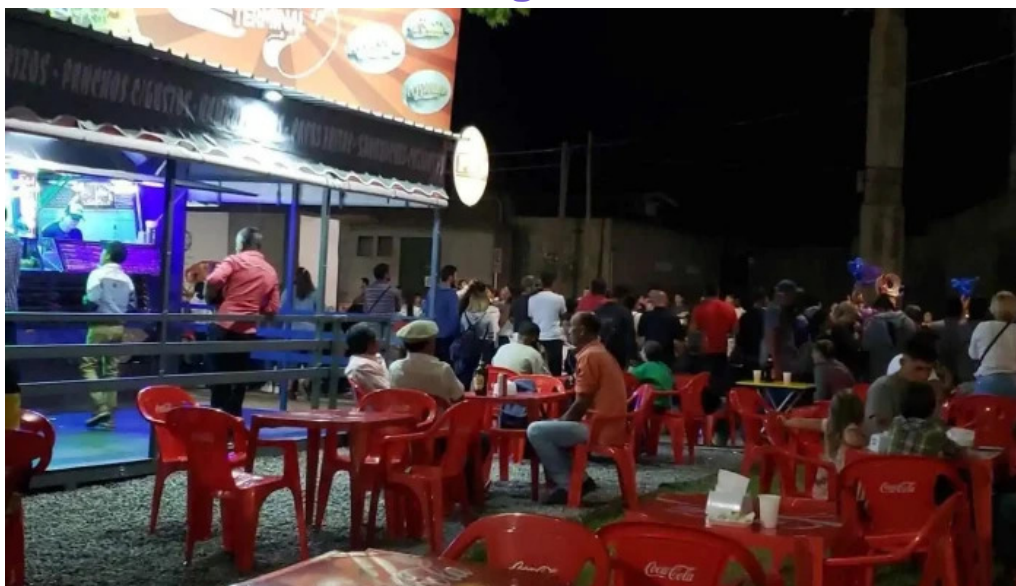
Carrito la nueva terminal todas