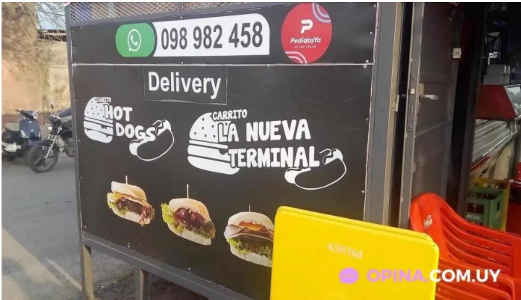
Carrito la nueva terminal menu