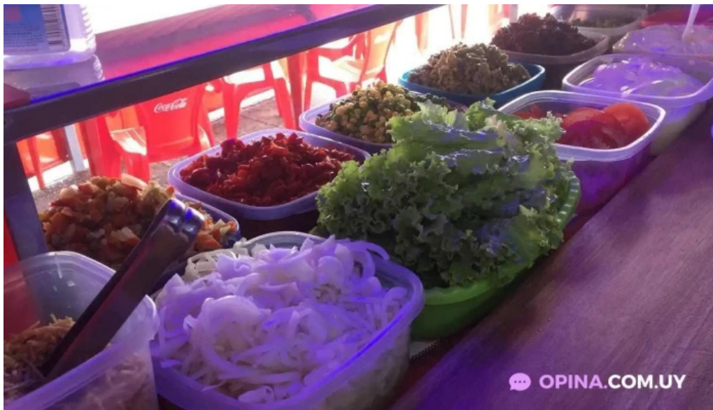
Carrito la nueva terminal comida y bebida