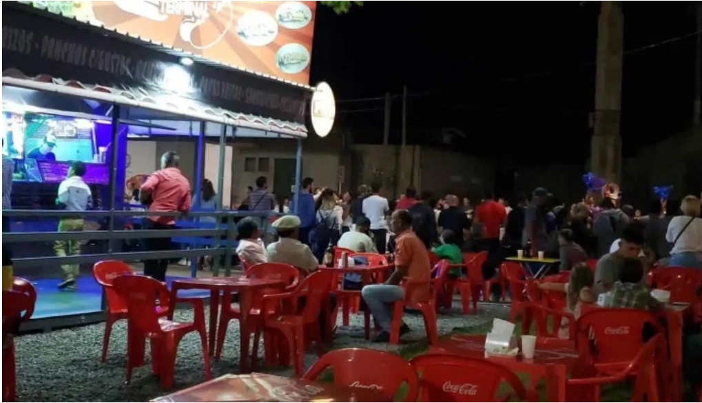
Carrito la nueva terminal paysandu