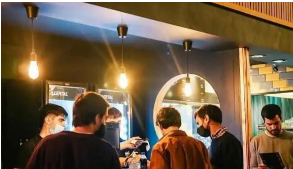
Burger time en mercado arocena carrasco todas