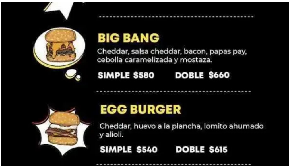
Burger time en mercado arocena carrasco del propietario