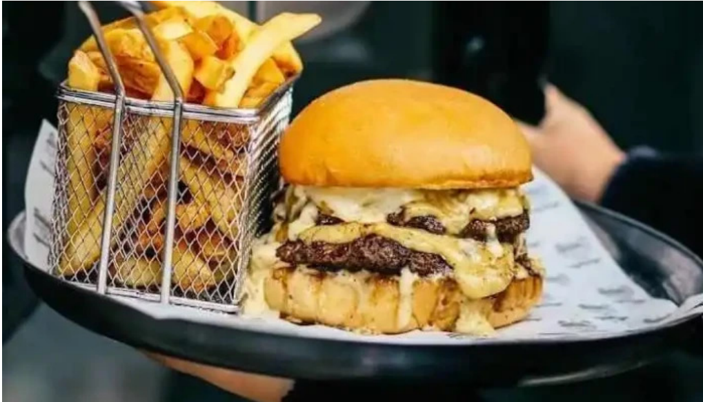
Burger time en mercado arocena carrasco papas fritas