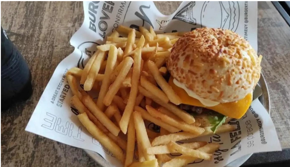
Burger time en mercado arocena carrasco hamburguesa