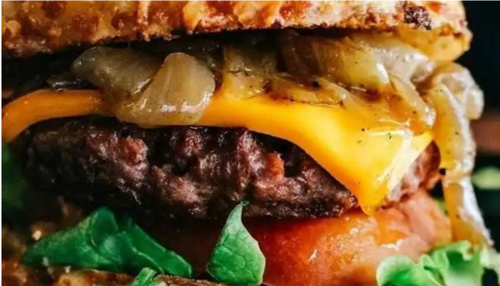
Burger time en mercado arocena carrasco comida y bebida