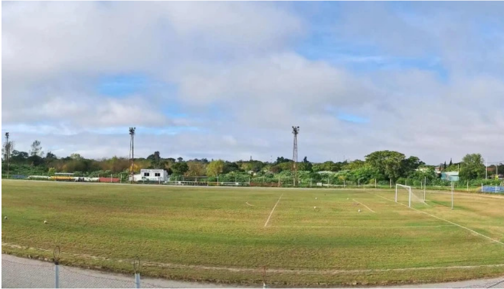
Estadio miguel campomar comentario 7