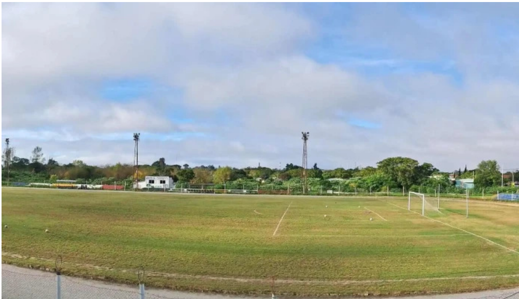
Estadio miguel campomar comentario 5