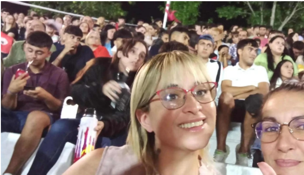
Estadio miguel campomar comentario 6