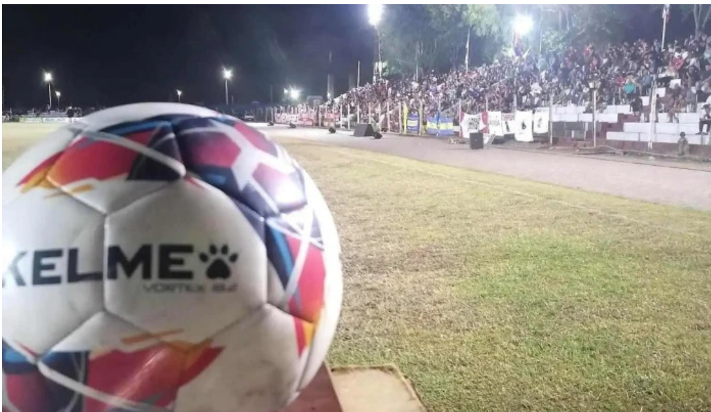
Estadio miguel campomar estadio