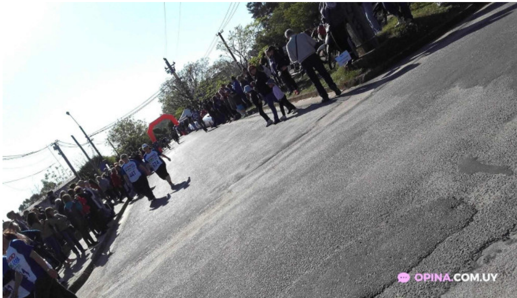
Estadio miguel campomar multitud