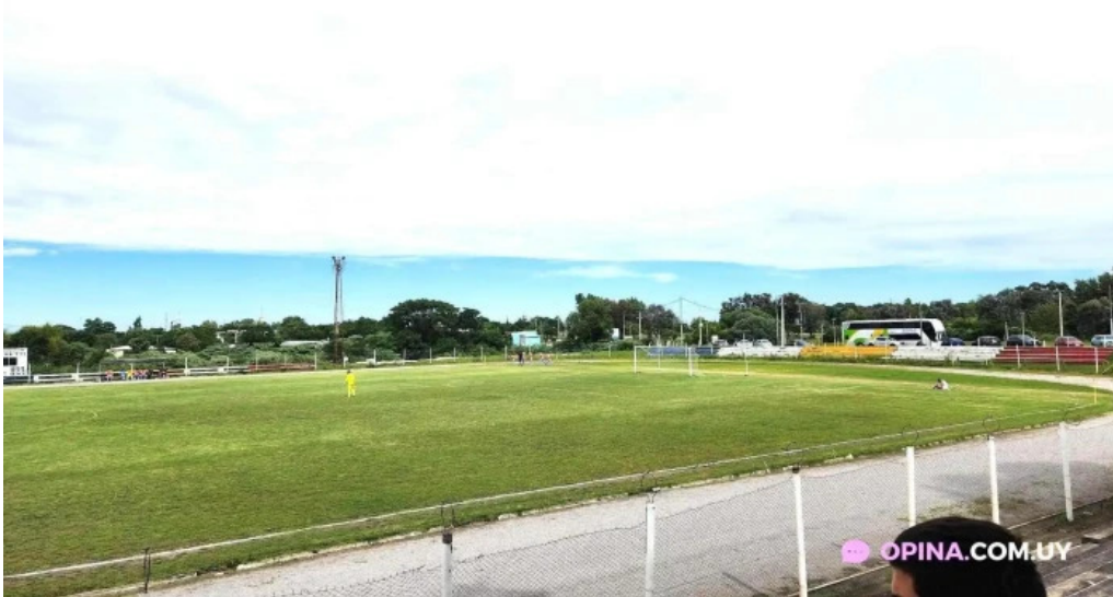
Estadio miguel campomar juan I lacaze