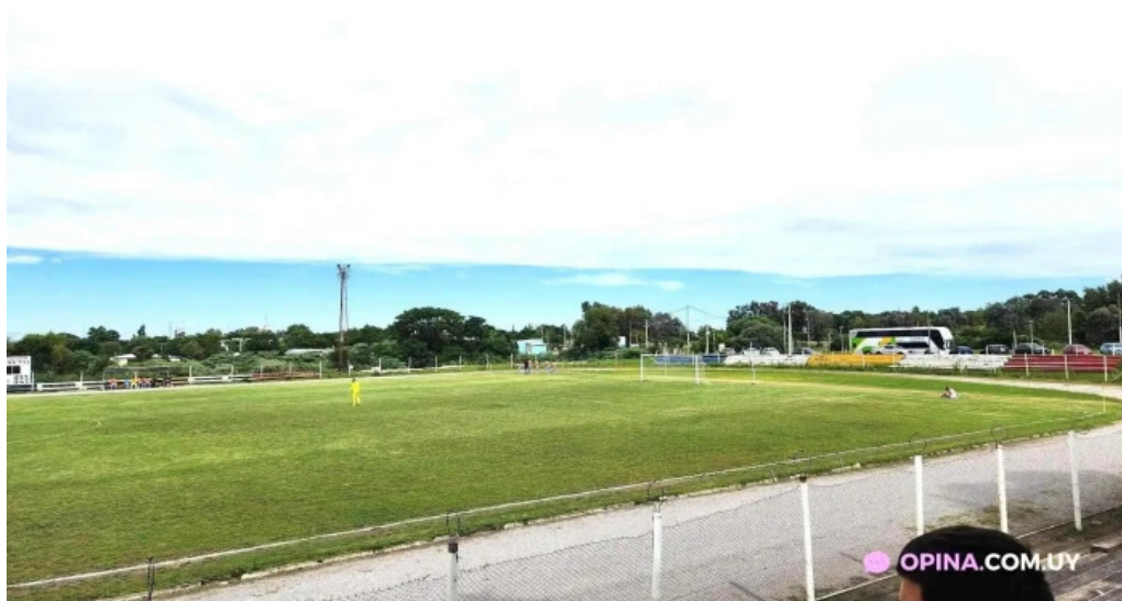
Estadio miguel campomar todo