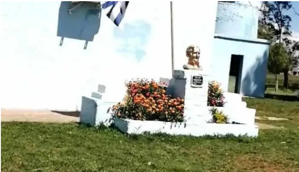
Escuela na57 videos