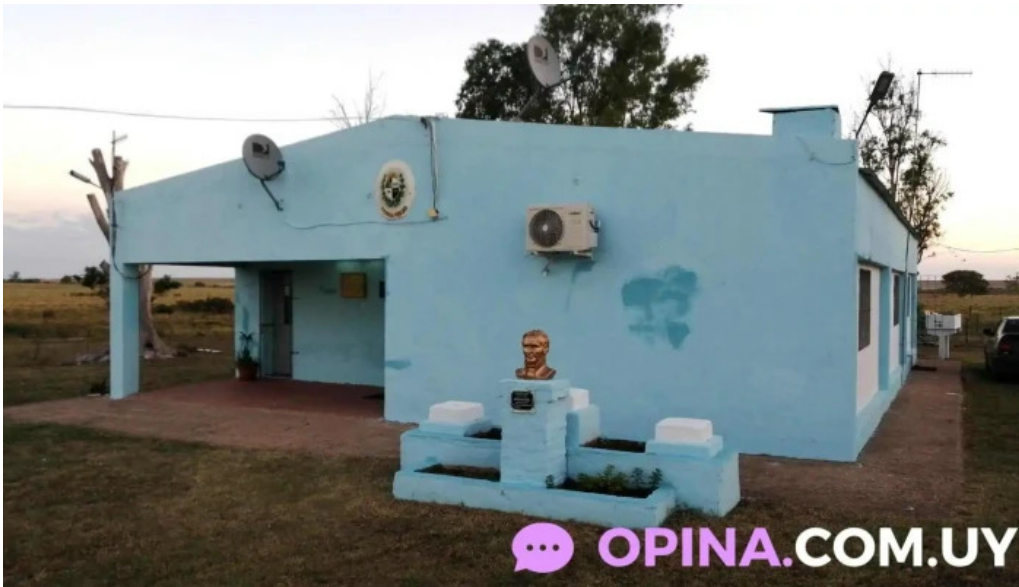
Escuela na57 opiniones