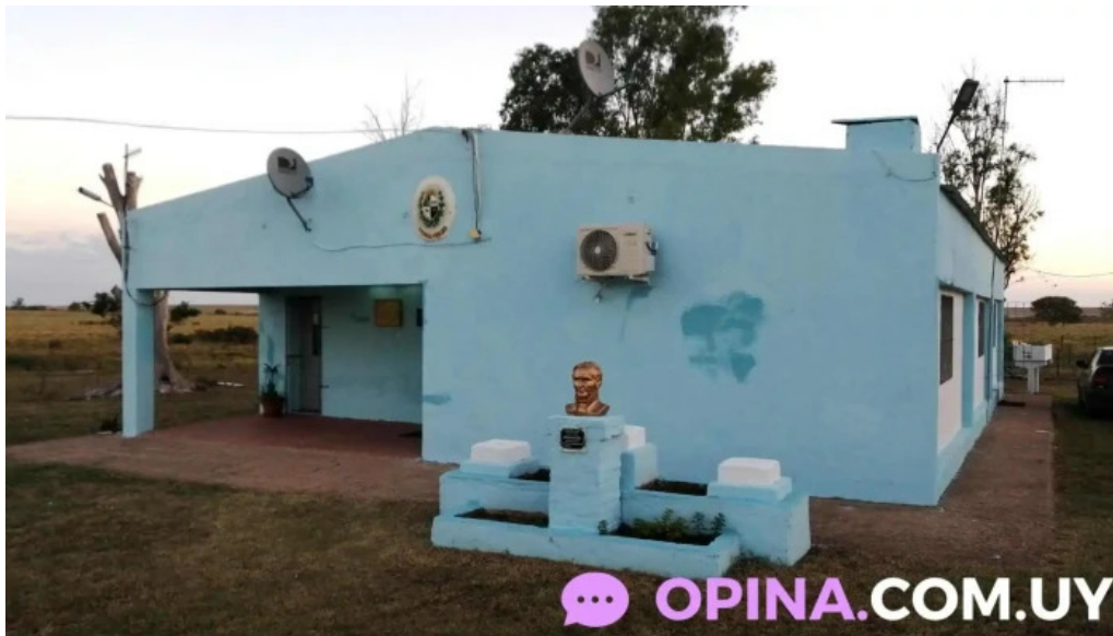
Escuela n a 57 paso del parque del dayman