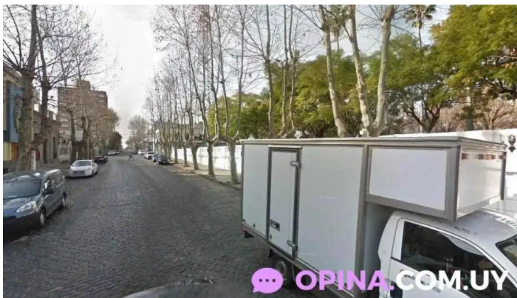
Escuela publica 2 col del sacramento