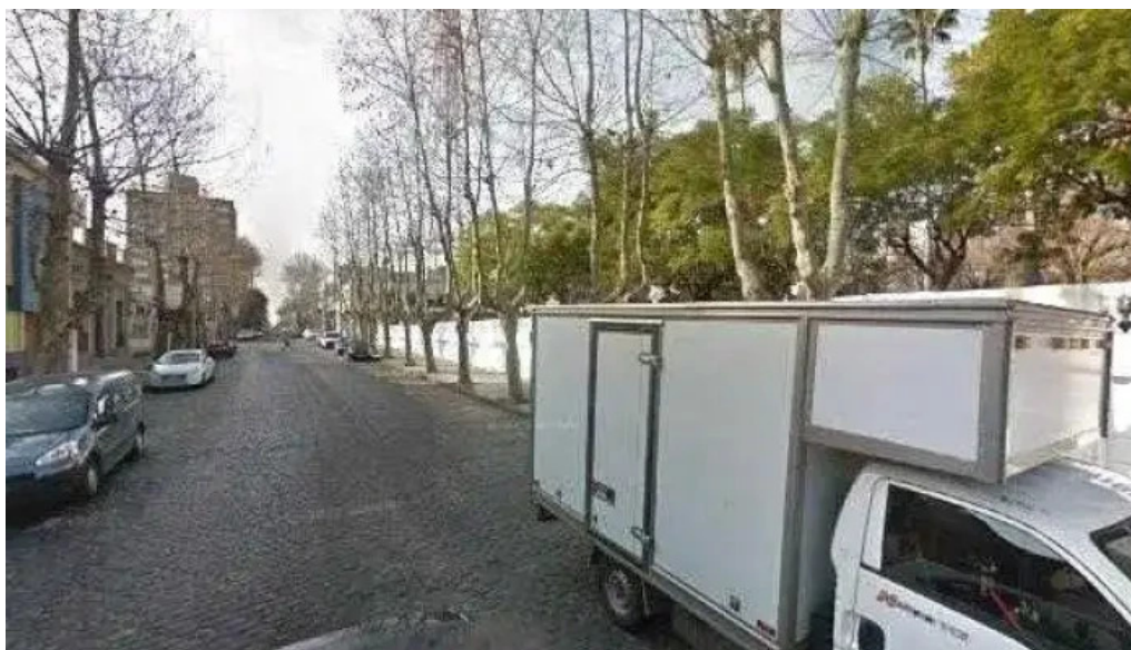
Escuela publica 2 cerca de mi