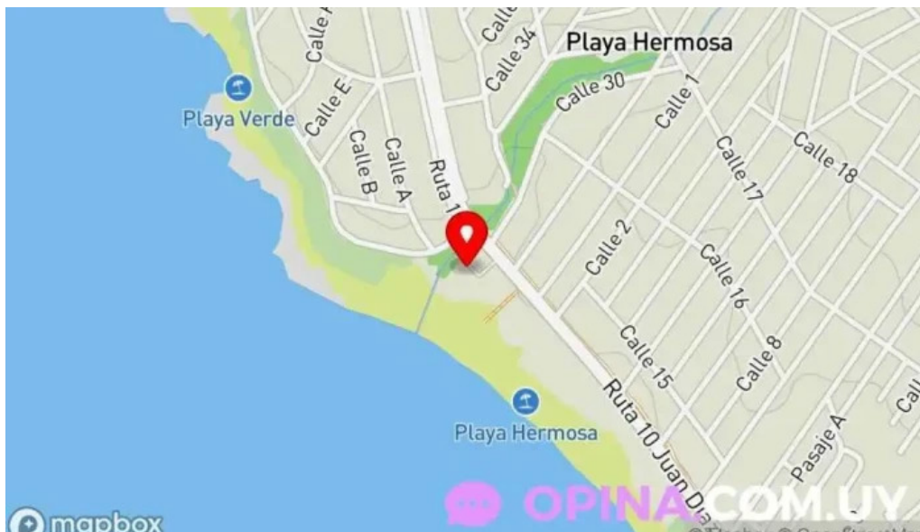
Licenciatura en medios audiovisuales de bellas artes ienba udelar mapa