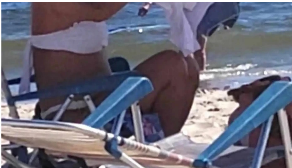
Licenciatura en medios audiovisuales de bellas artes ienba udelar videos