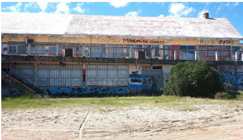
Licenciatura en medios audiovisuales de bellas artes ienba udelar cerca de mi