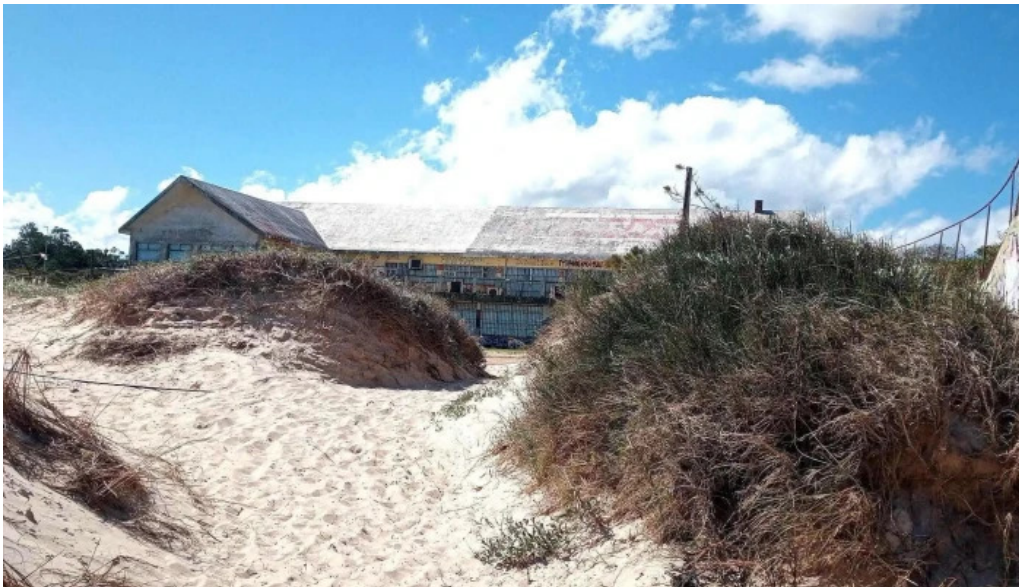
Licenciatura en medios audiovisuales de bellas artes ienba udelar playa hermosa