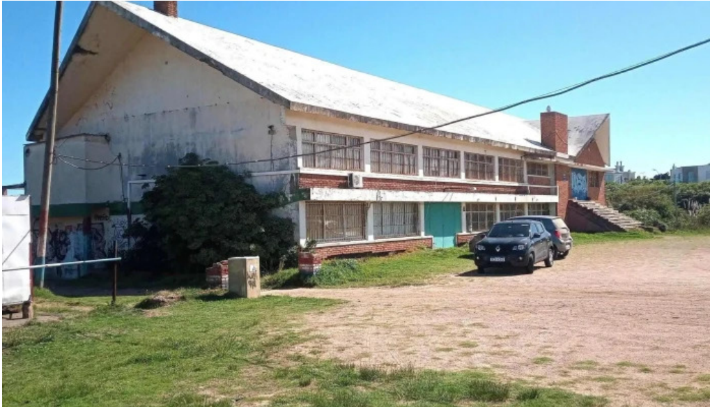
Licenciatura en medios audiovisuales de bellas artes ienba udelar puntaje