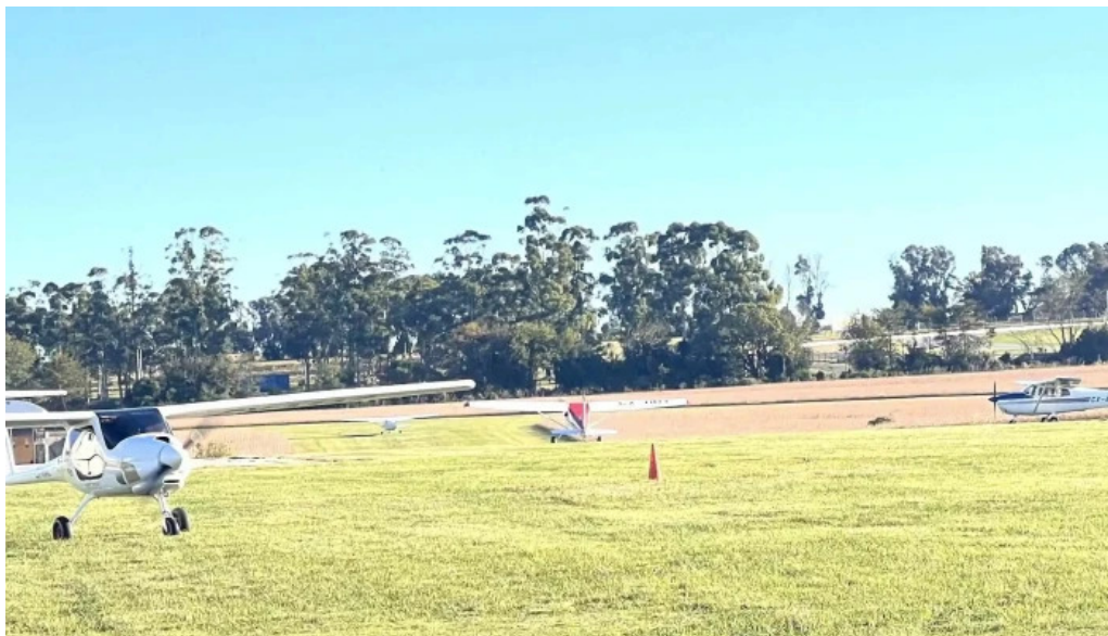
Aero club mercedes sitio web