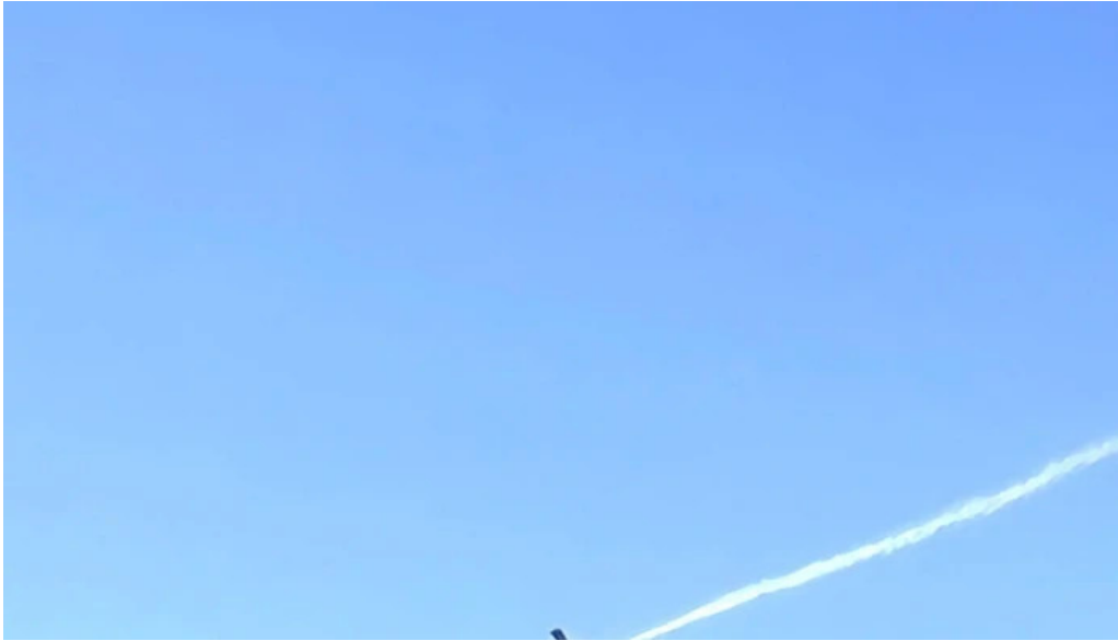
Aero club mercedes opiniones