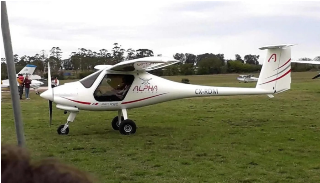
Aero club mercedes comentarios