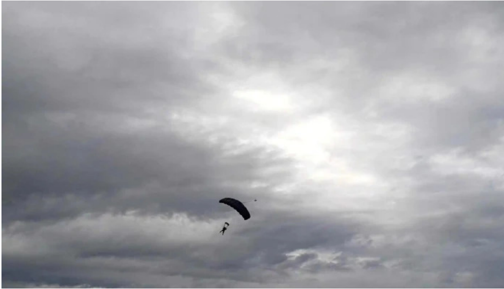
Aero club mercedes fotos