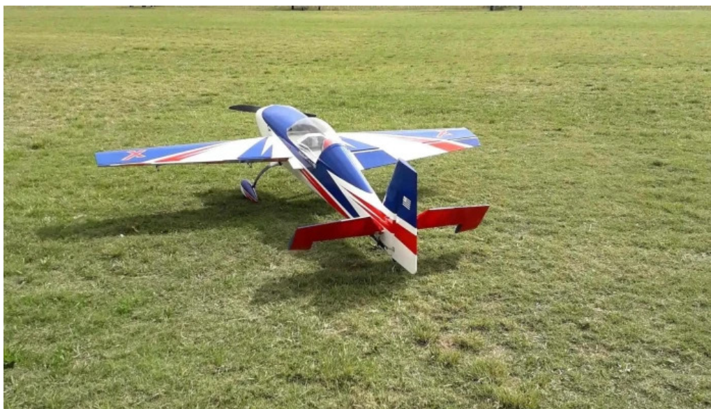
Aero club mercedes abierto ahora