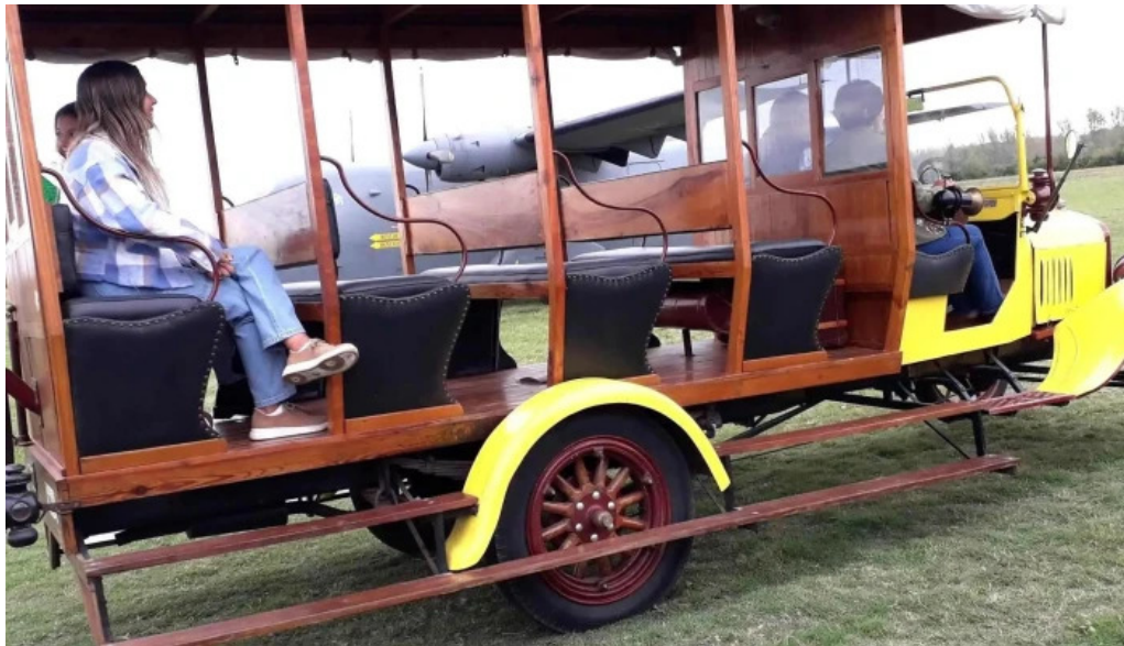
Aero club mercedes ubicacion