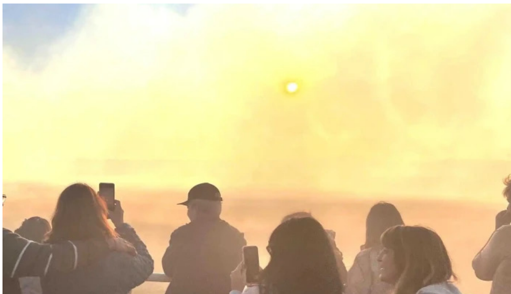
Aero club mercedes zona