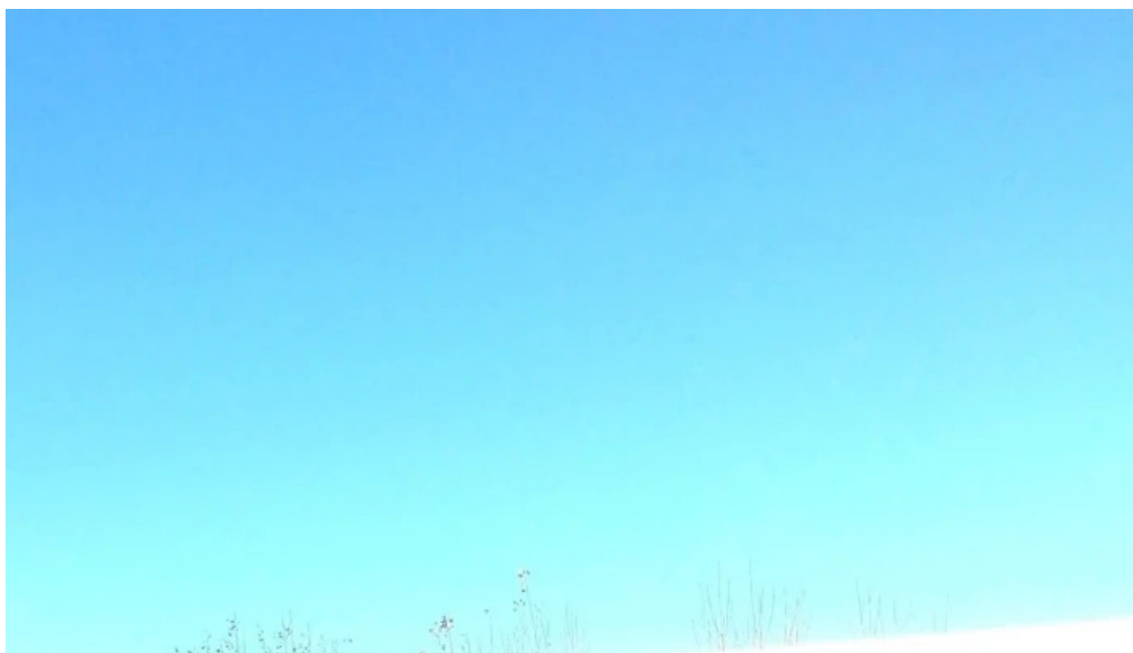
Aero club mercedes catalogo