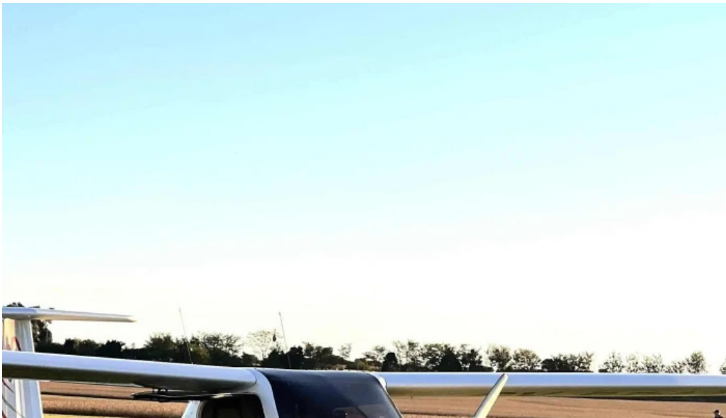
Aero club mercedes mercedes