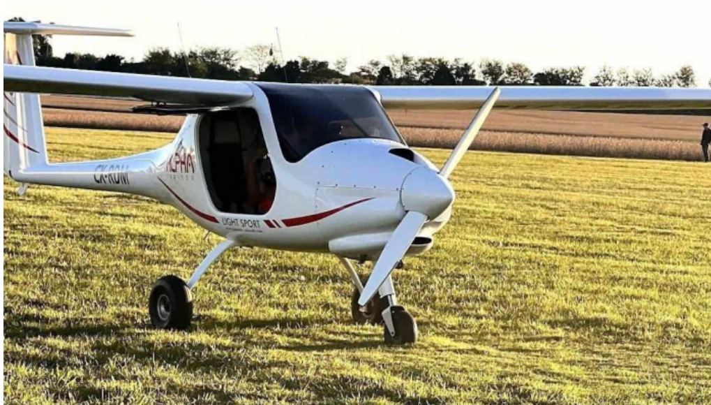
Aero club mercedes mas recientes