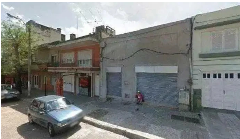
Colegio julio verne descuentos