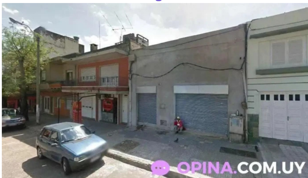
Colegio julio verne rivera