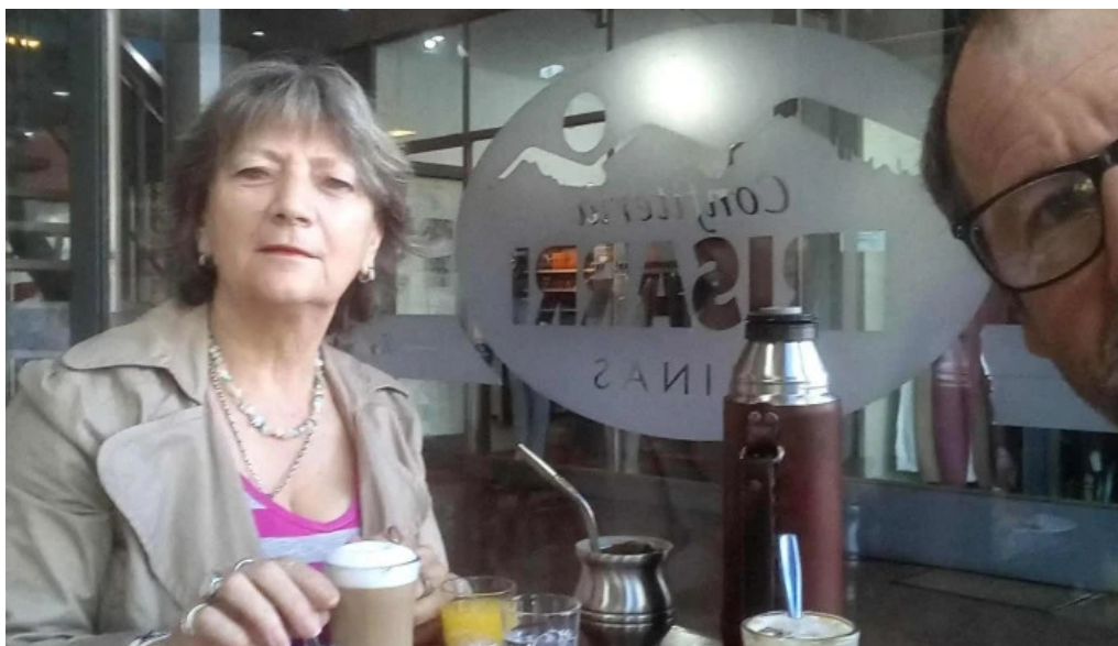
Escuela 102 minas