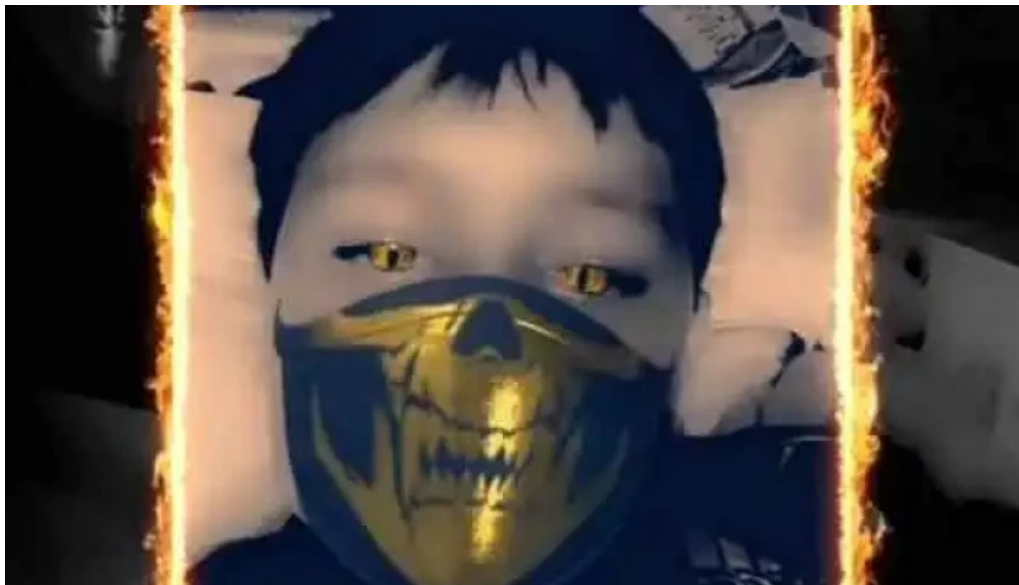
Escuela 102 videos