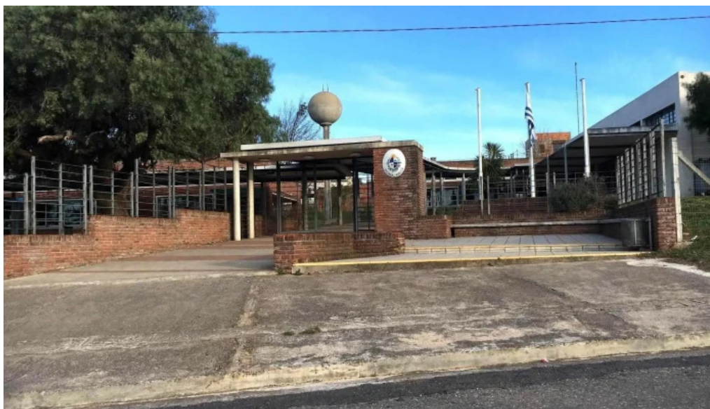
Escuela 102 comentarios