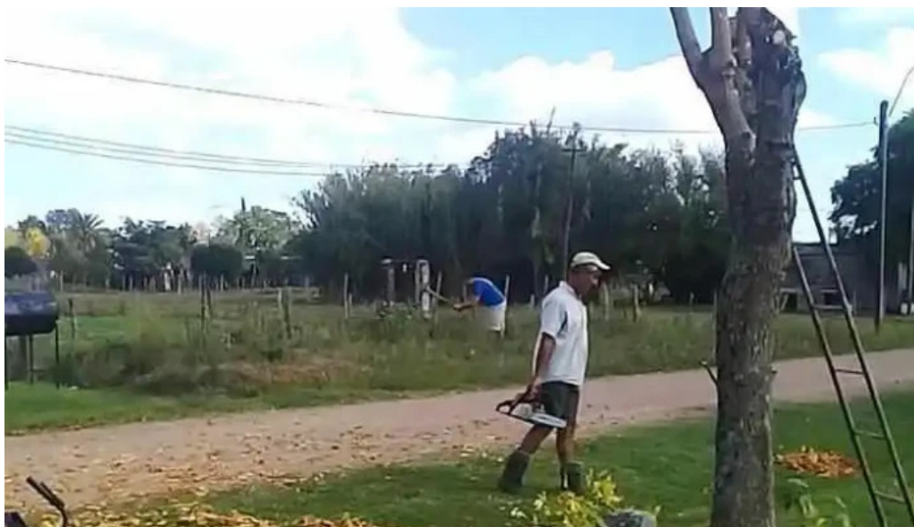
Covimon de los visitantes