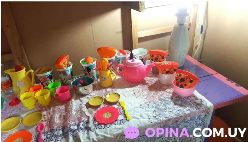
Covifum comida y bebida