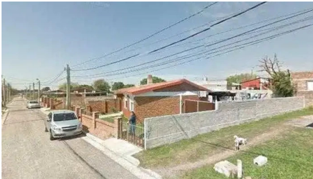
Covifum sitio webdeg