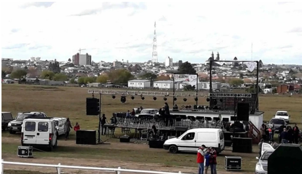
Covifum sitio web