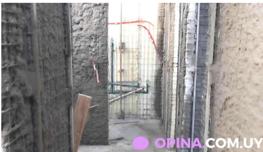
Cooperativa caminos nuevos de los visitantes