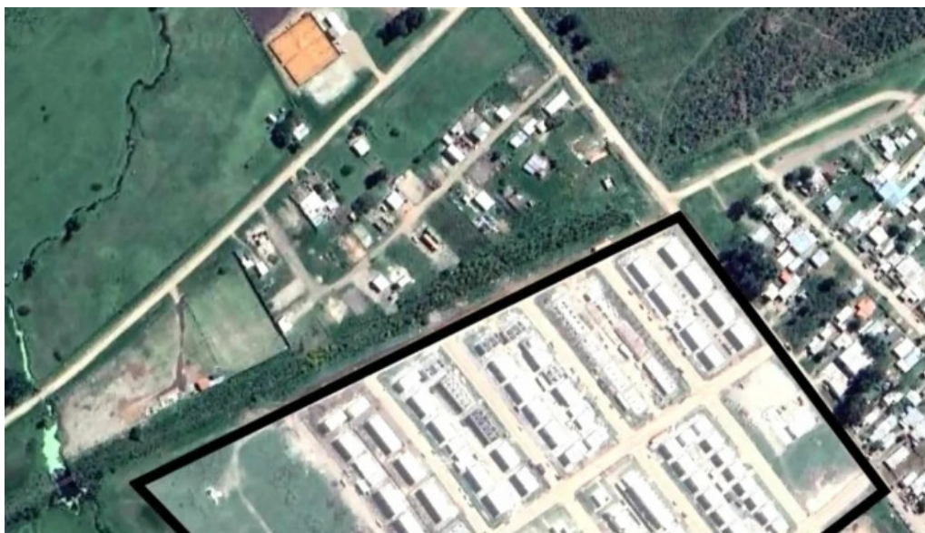
Cooperativa caminos nuevos durazno