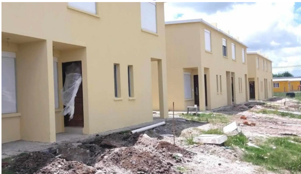
Cooperativa caminos nuevos videos