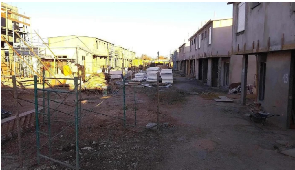
Cooperativa caminos nuevos exterior