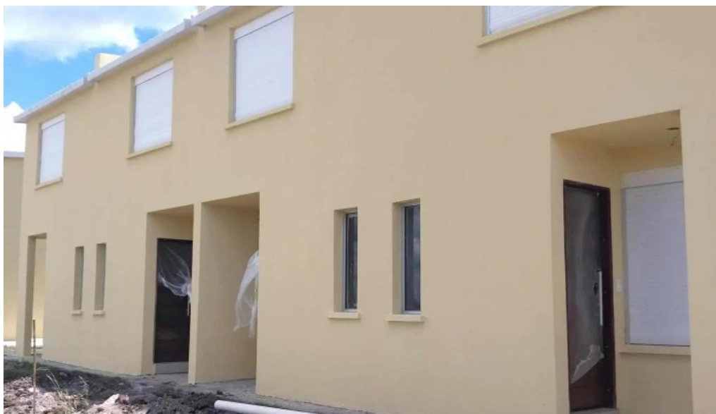
Cooperativa caminos nuevos telefono