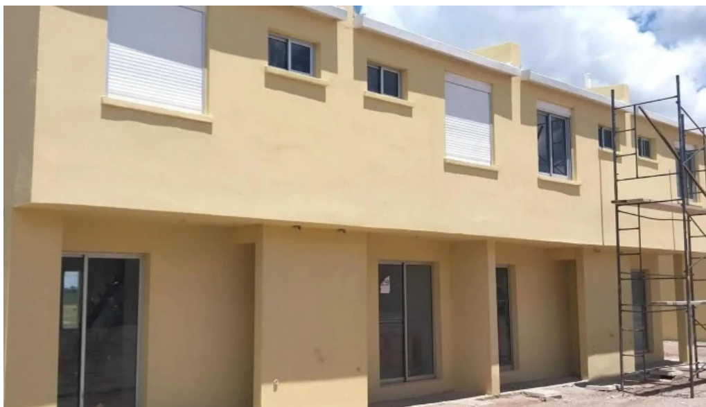
Cooperativa caminos nuevos donde