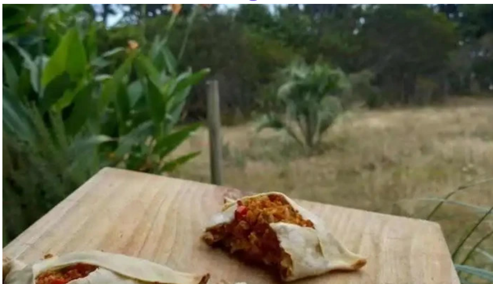
La cocina de pipa y flor todas