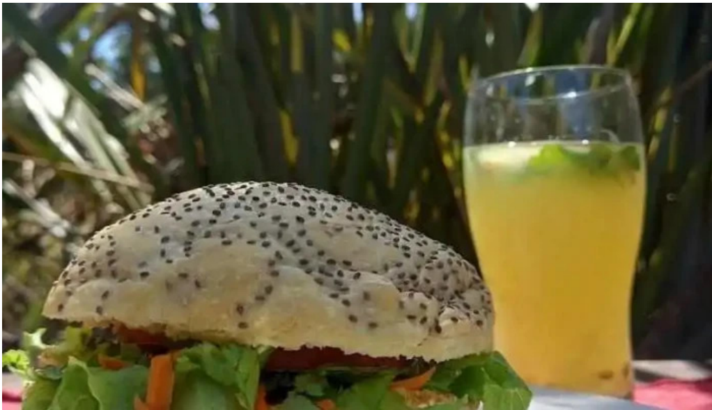
La cocina de pipa y flor hamburguesa