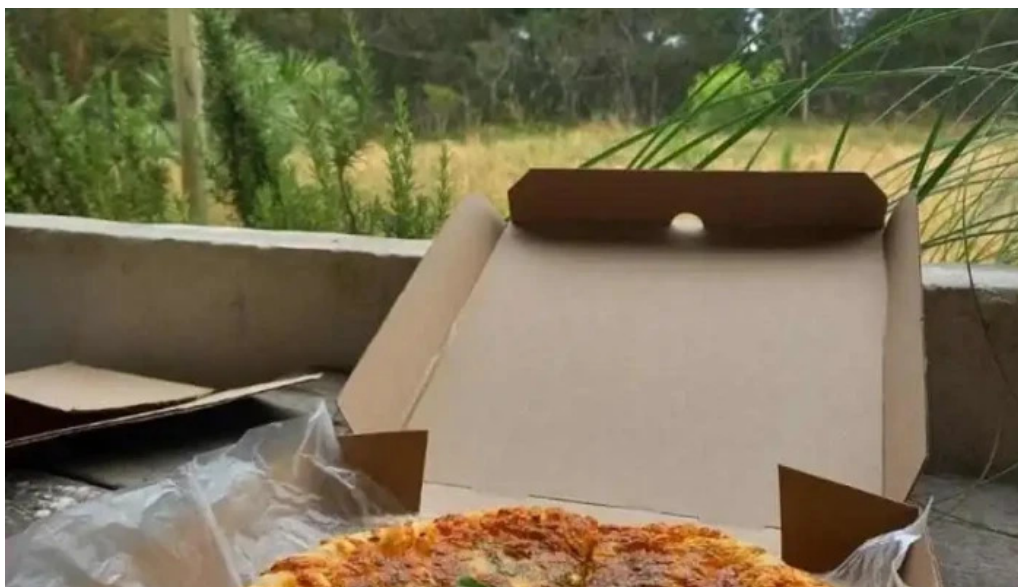
La cocina de pipa y flor del propietario