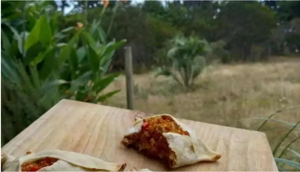
La cocina de pipa y flor la paloma