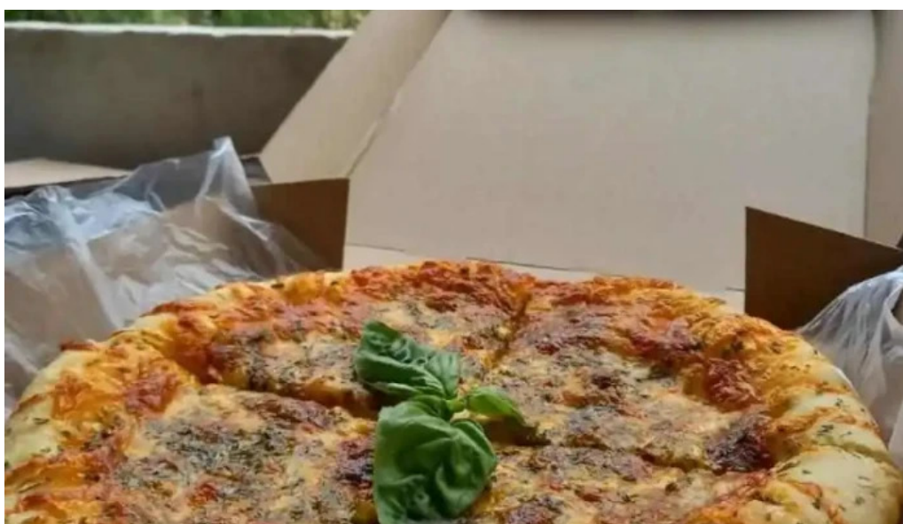
La cocina de pipa y flor comida y bebida