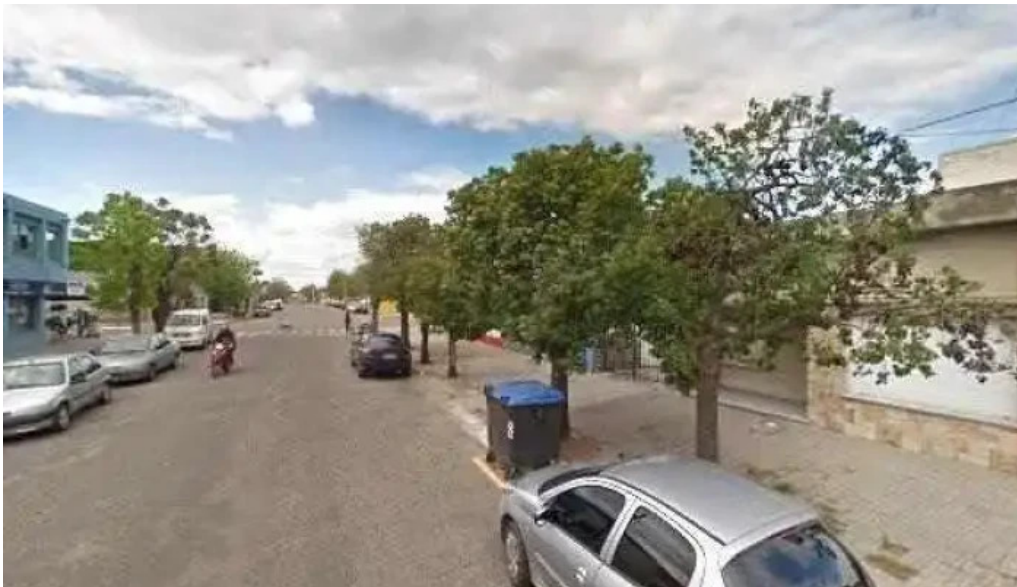
Fabrica de pastas veneto street view y 360