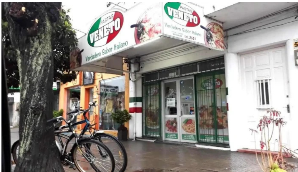
Fabrica de pastas veneto juan I lacaze