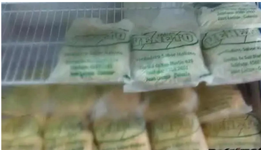
Fabrica de pastas veneto ambiente