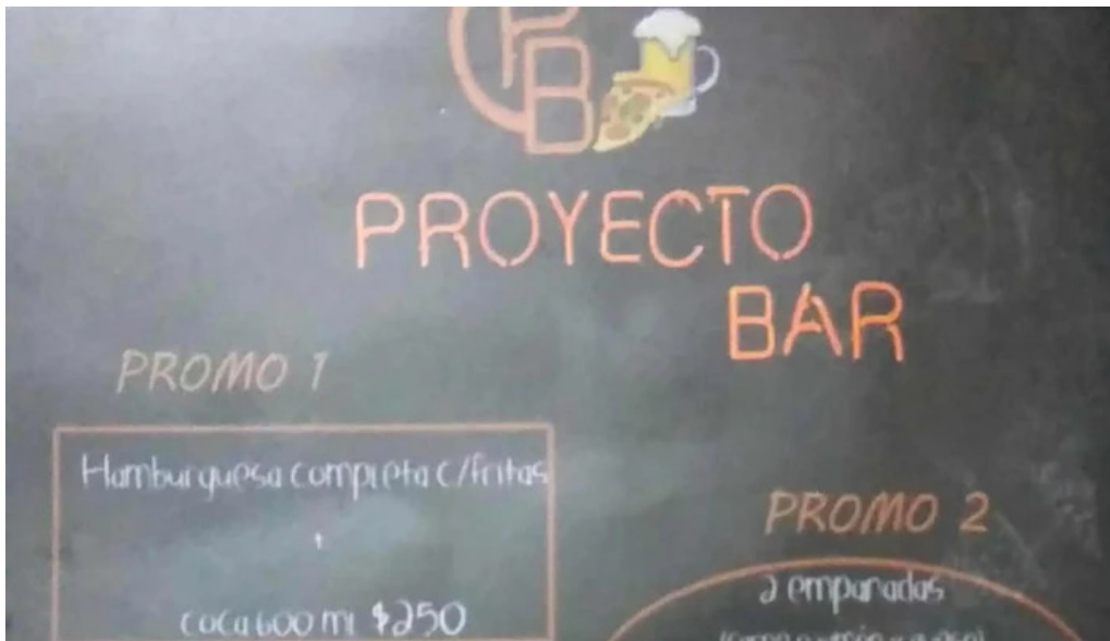
Proyecto bar comentario 7