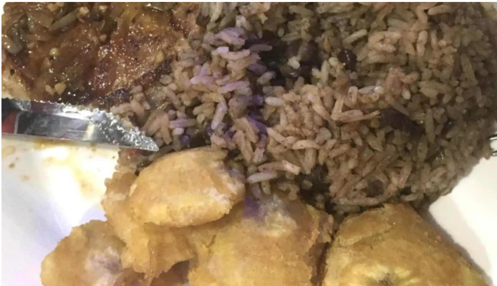
Proyecto bar comentario 8