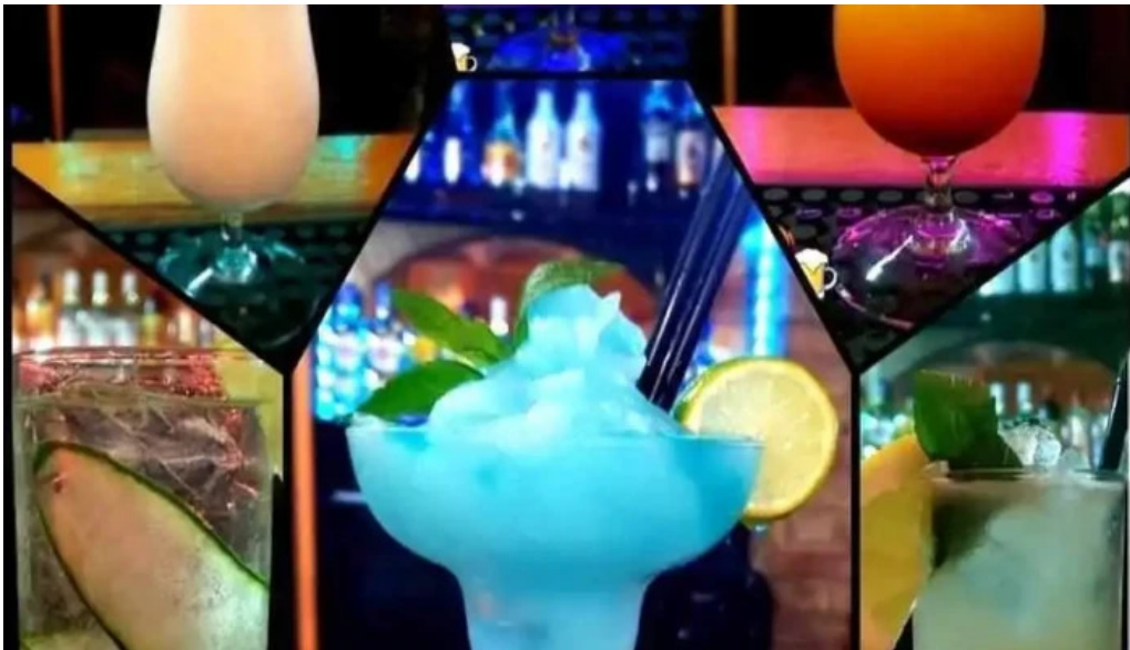
Proyecto bar montevideo