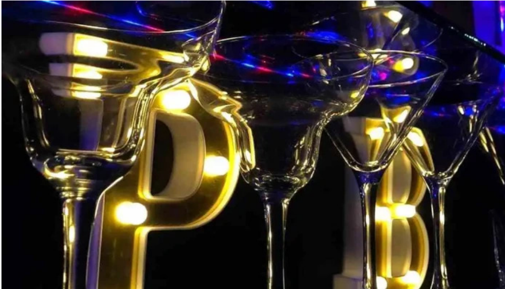
Proyecto bar comidas y bebidas