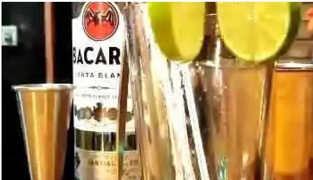
Proyecto bar videos