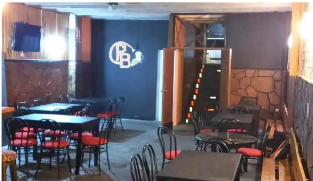
Proyecto bar ambiente