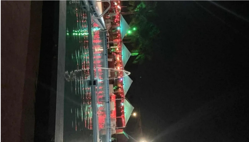
Piedra lisa comentario 6