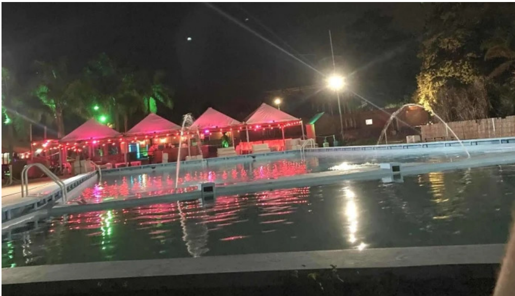
Piedra lisa comentario 7