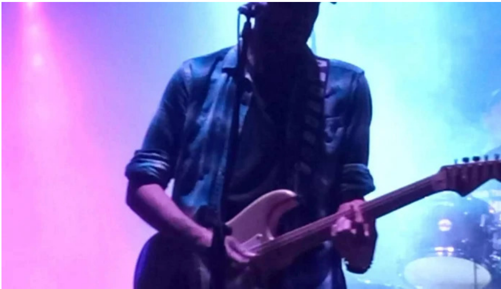
Piedra lisa comentario 3