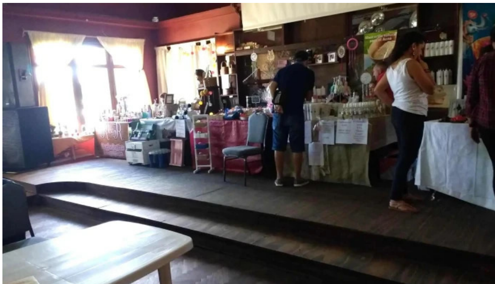
Piedra lisa ambiente