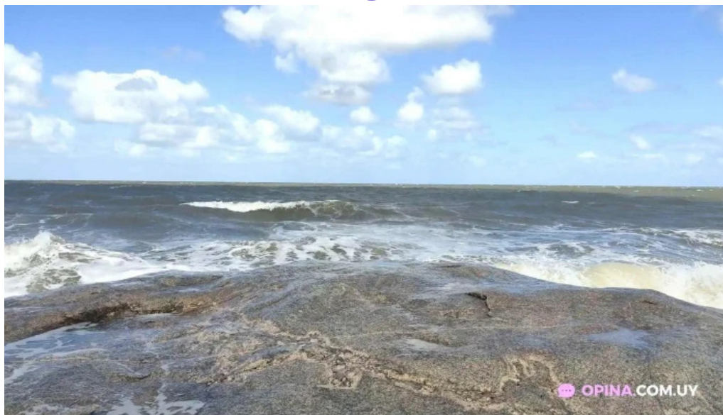
Piedra lisa videos