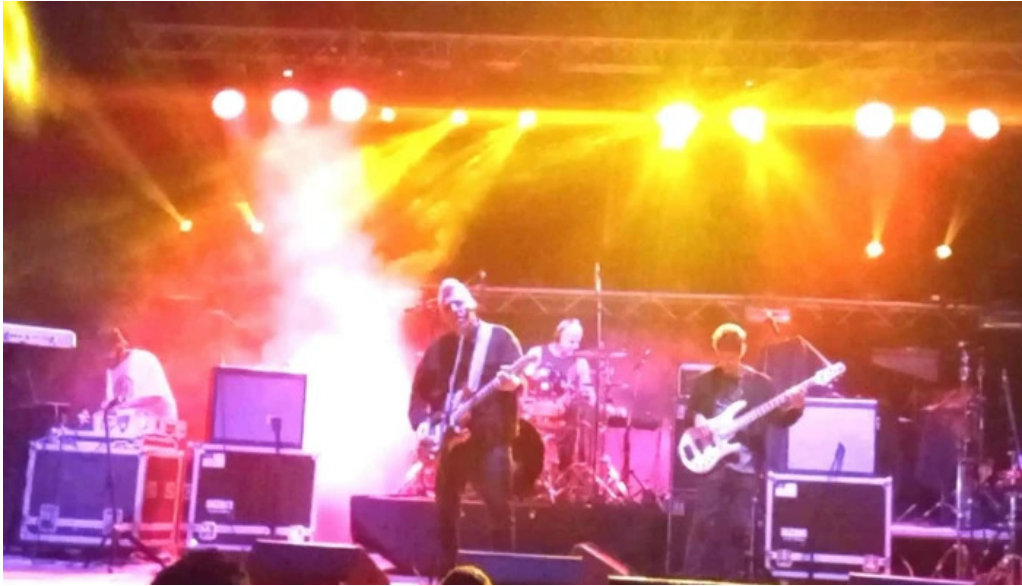
Piedra lisa comentario 4