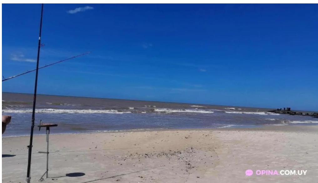
Piedra lisa todo