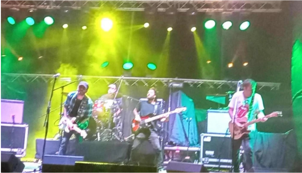
Piedra lisa comentario 2