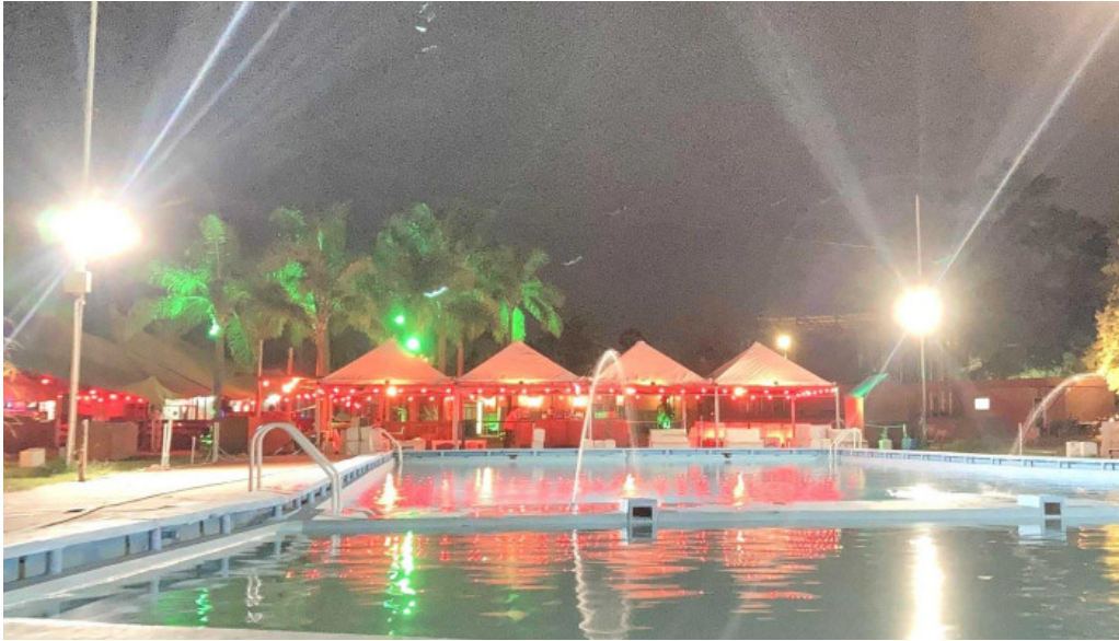
Piedra lisa comentario 8