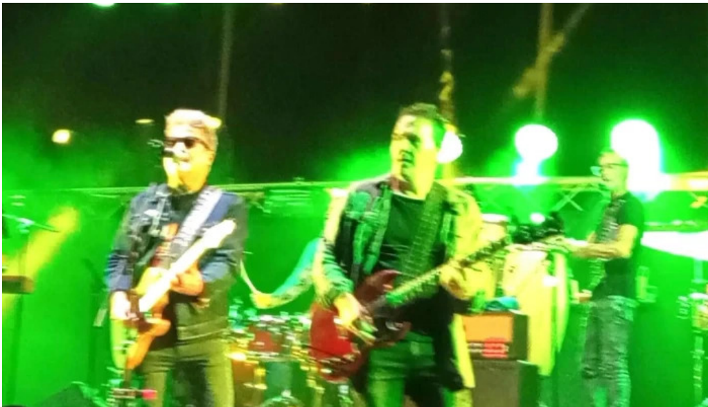
Piedra lisa comentario 1