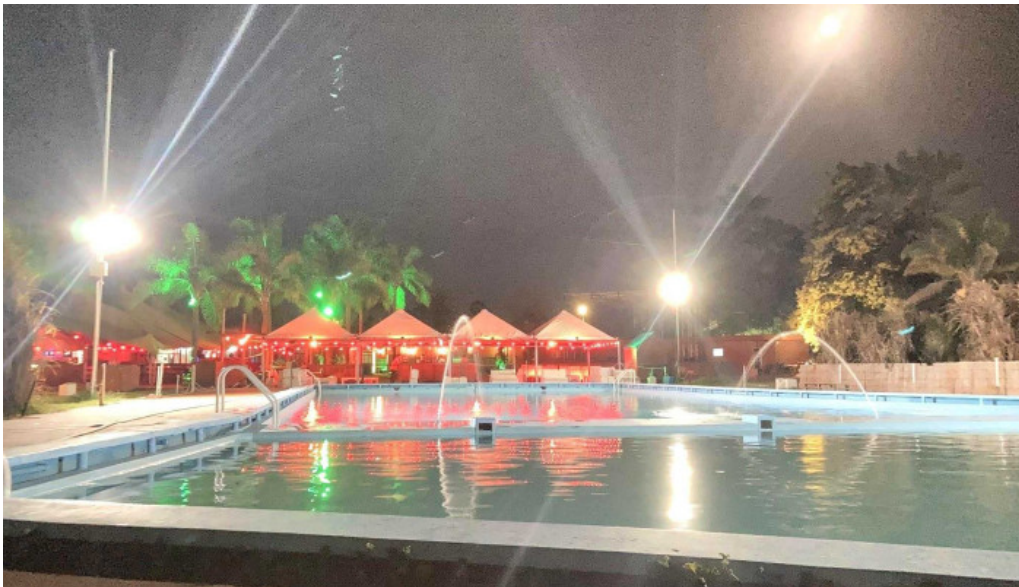
Piedra lisa piscina