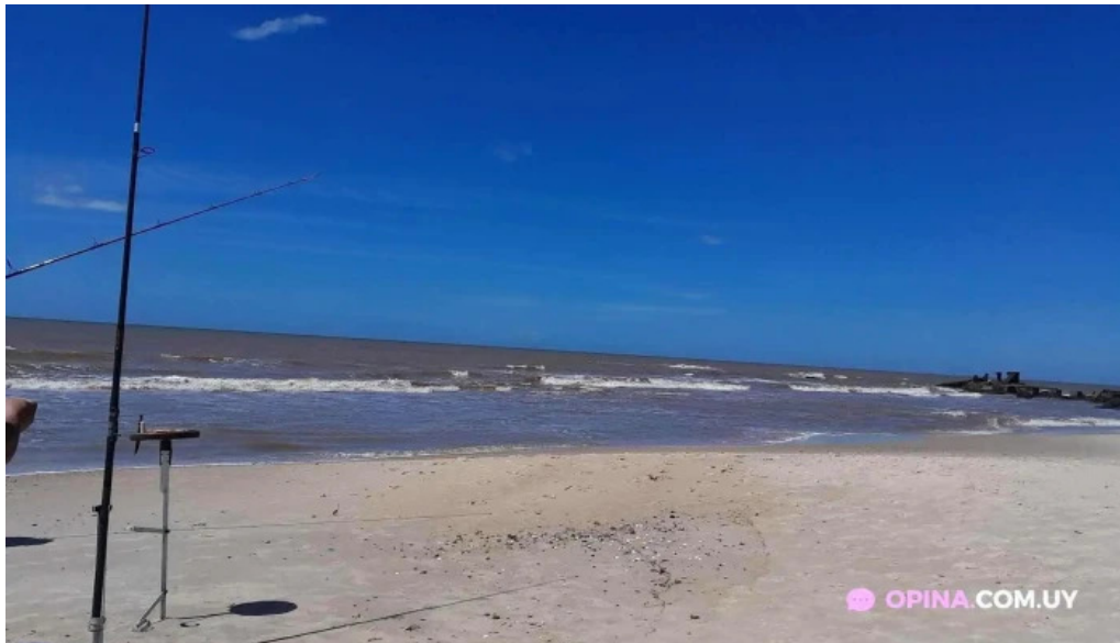
Piedra lisa atlantida