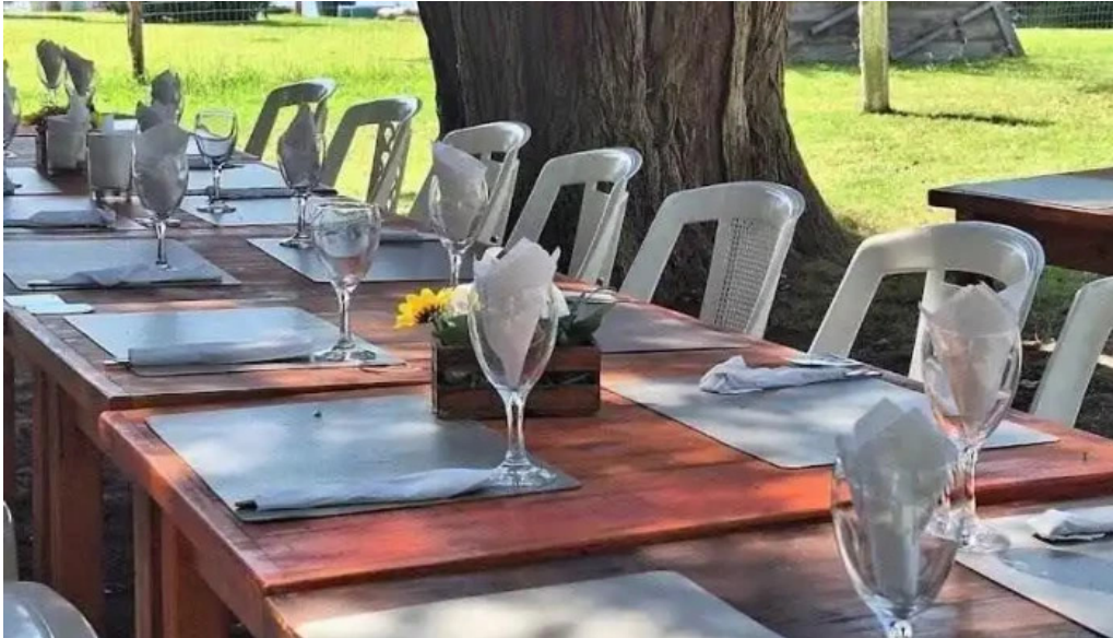
Yatch club uruguayo mas recientes