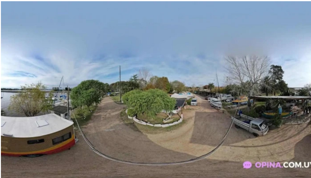
Yatch club uruguayo street view y 360