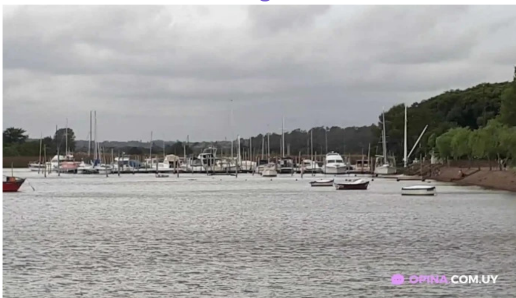
Yatch club uruguayo videos