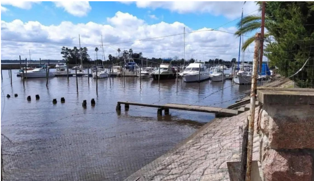
Yatch club uruguayo santiago vazquez