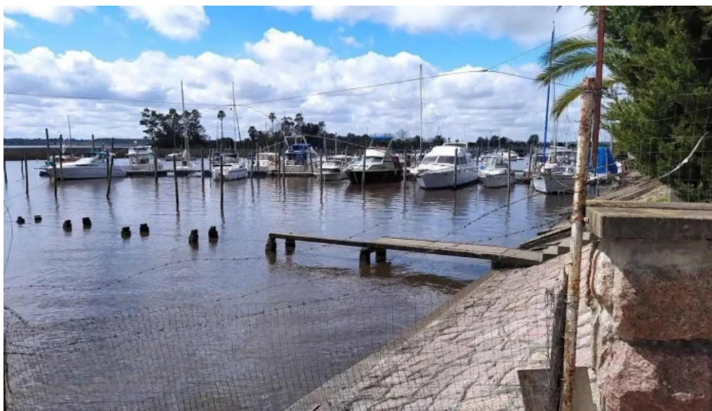
Yatch club uruguayo todas