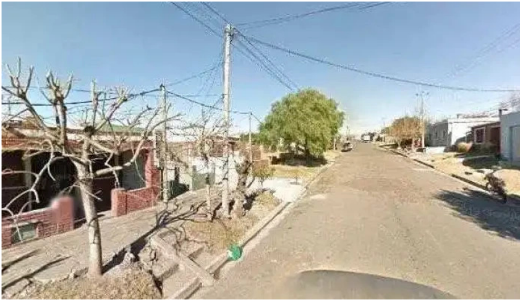
El bordo futsal mercedes catalogodeg