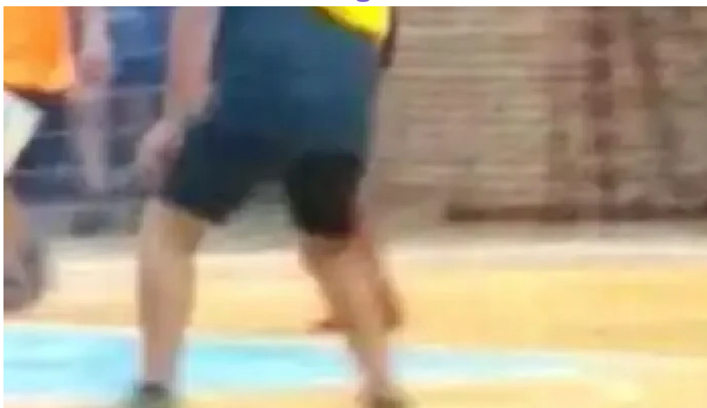
El bordo futsal mercedes videos