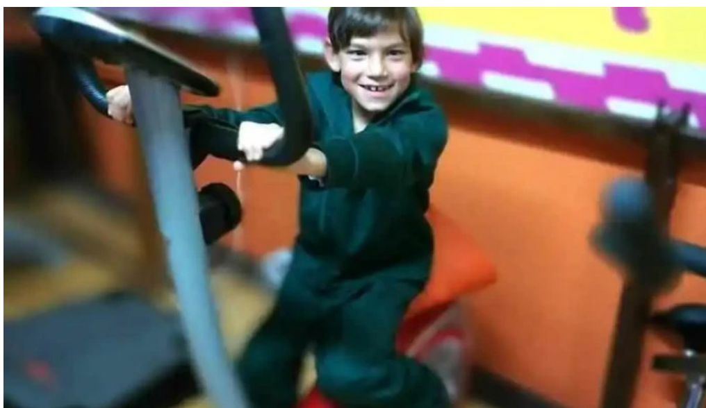
Clinica de fisioterapia lic carlos montiel rivera