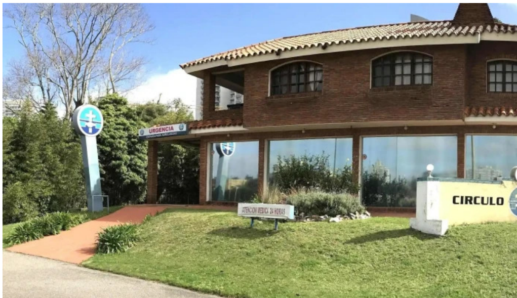
Circulo catolico filial punta del este numero