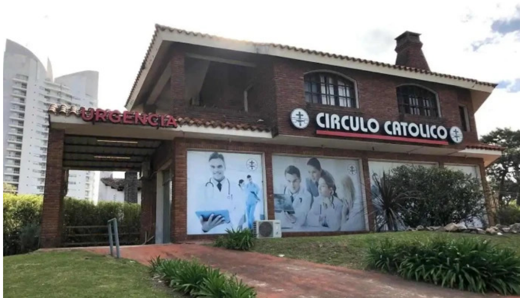
Circulo catolico filial punta del este punta del este