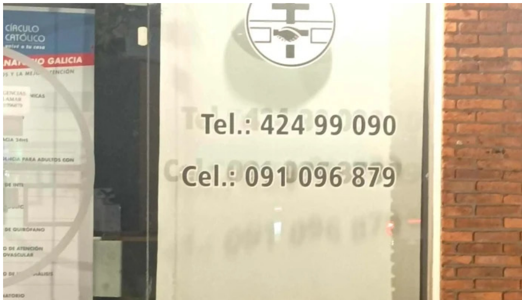
Circulo catolico filial punta del este punta del este