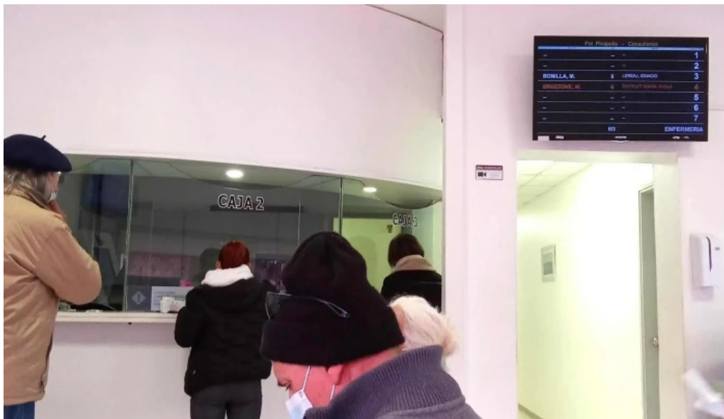
Policlinica piriapolis asistencial medica edificio