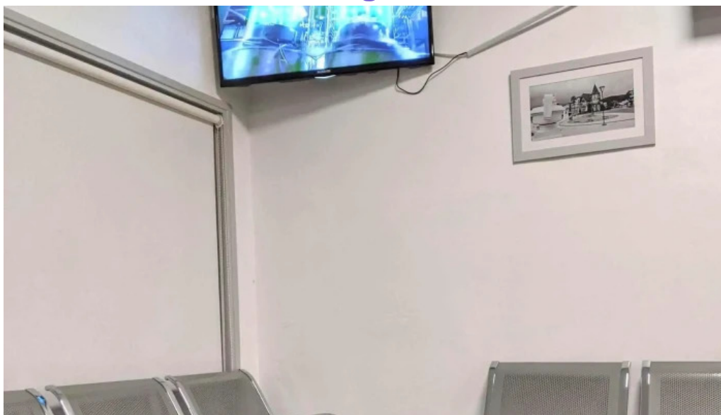
Policlinica piriapolis asistencial medica piriapolis