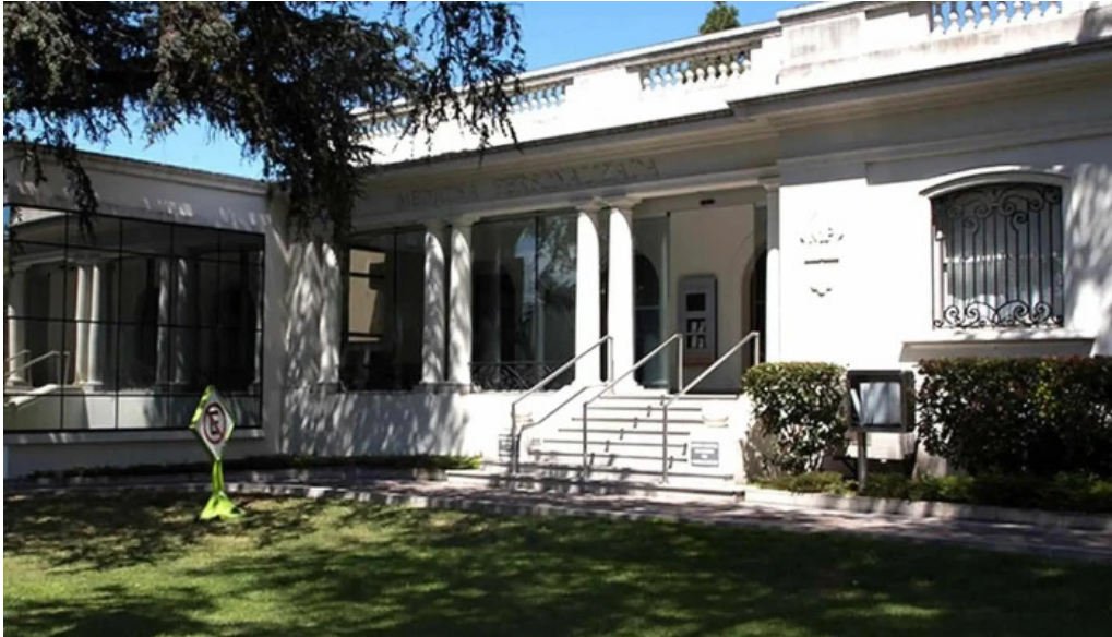
Medicina personalizada clinica carrasco montevideo