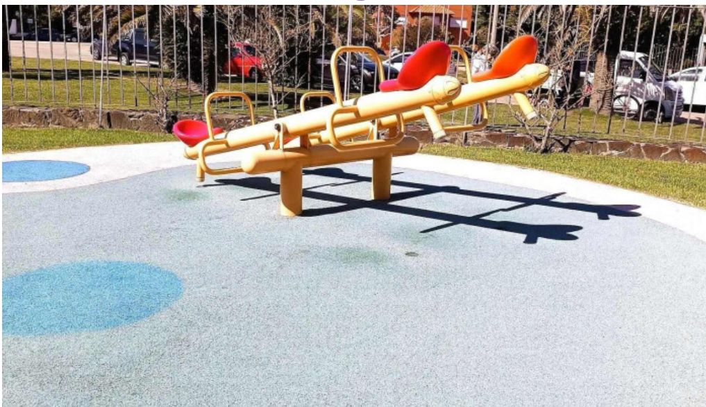
Medicina personalizada clinica carrasco opiniones