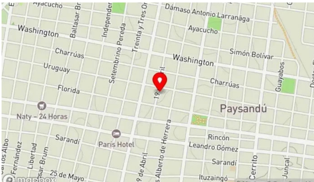
Trinca brewer mapa