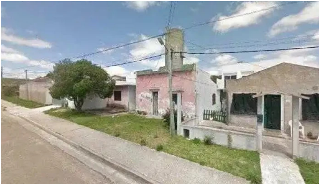
La oveja negra street view y 360