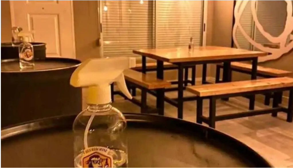
La oveja negra todas