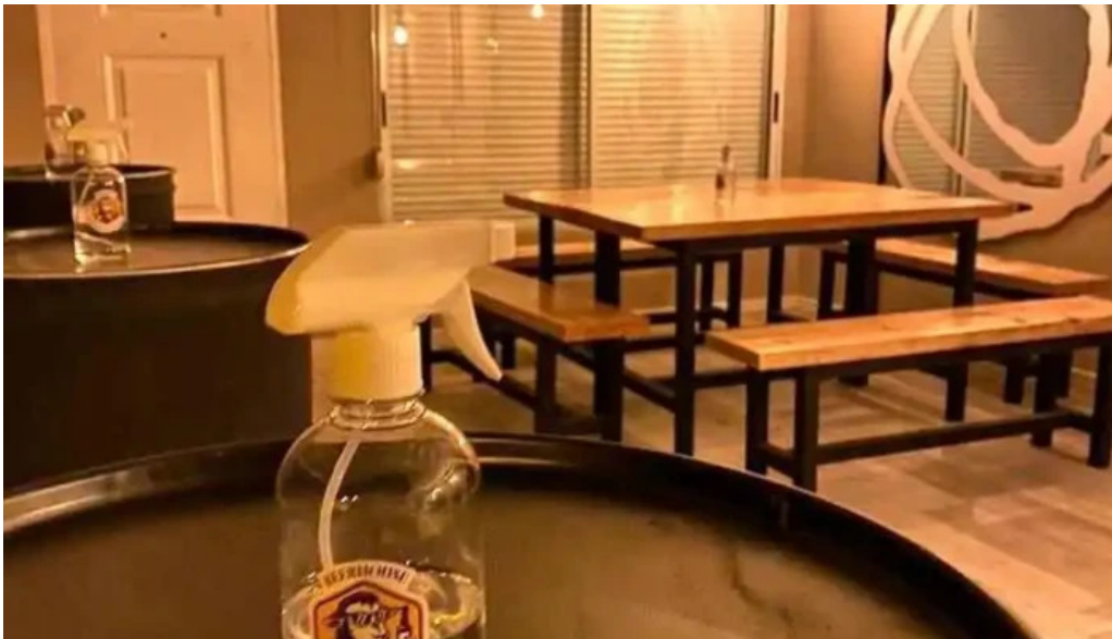
La oveja negra pan de azucar