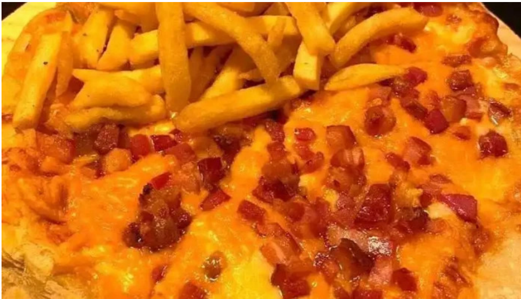
La oveja negra papas fritas