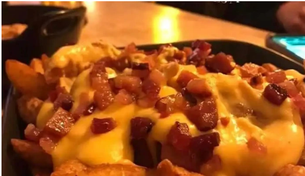
La oveja negra del propietario