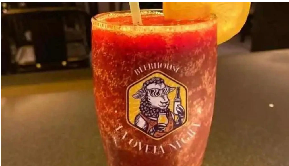
La oveja negra comida y bebida