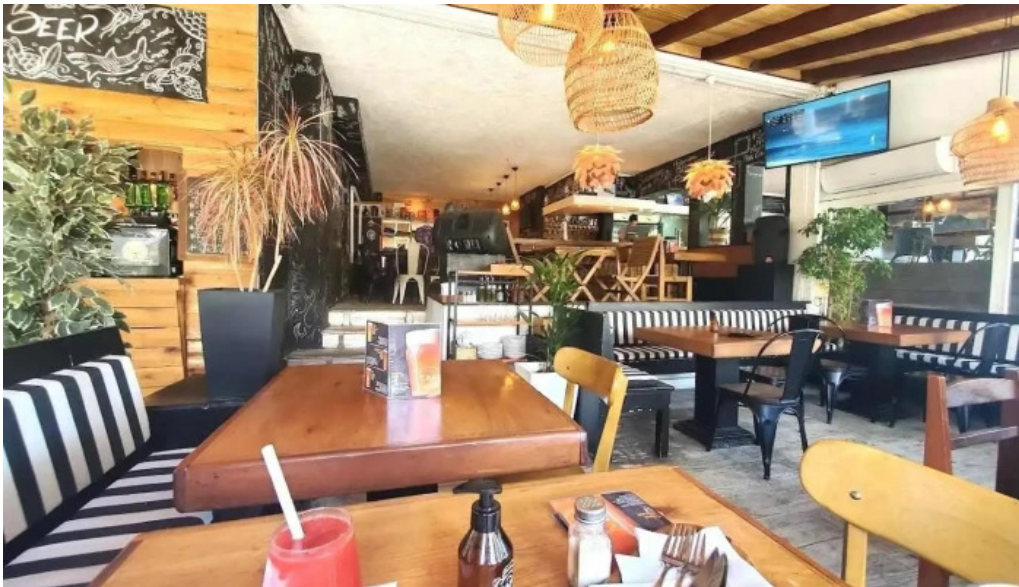
Capi bar ambiente