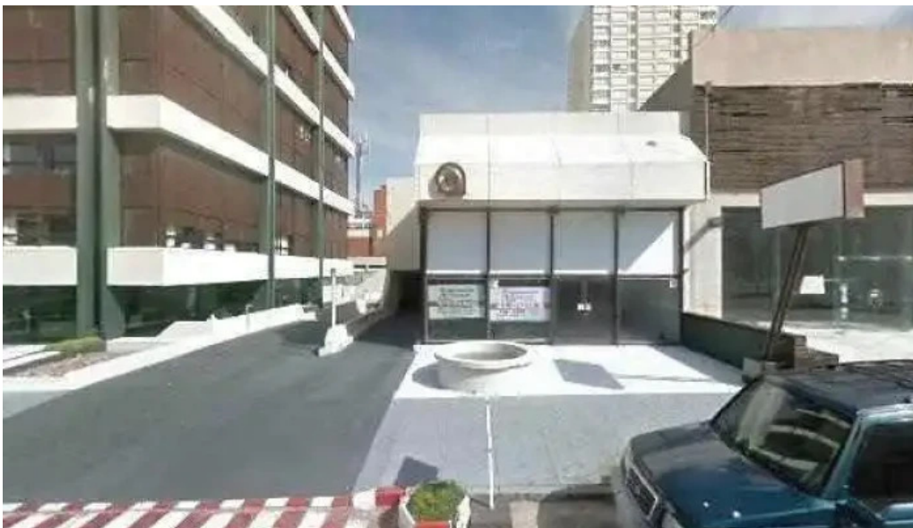
Capi bar street view y 360