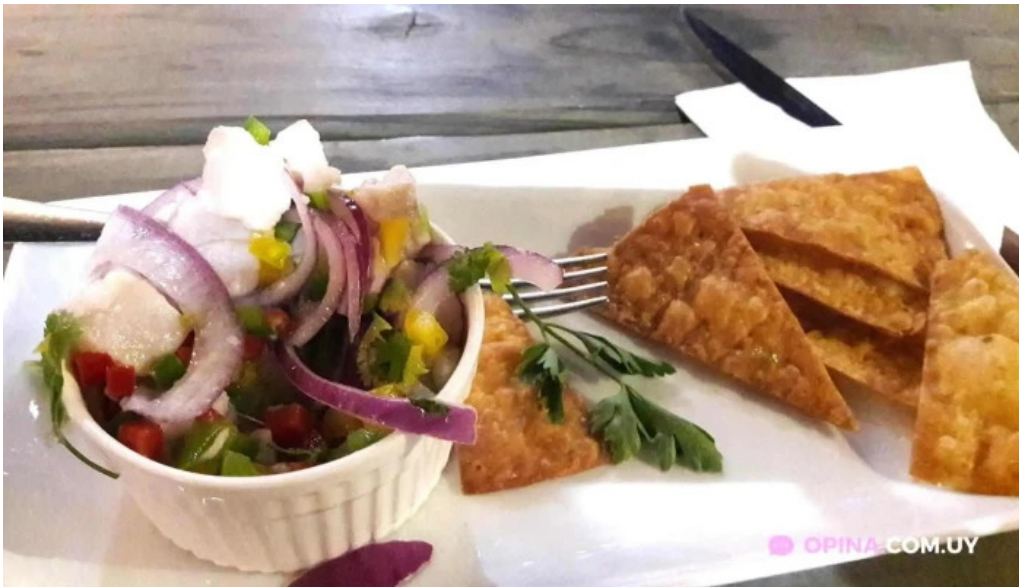
Capi bar ceviche