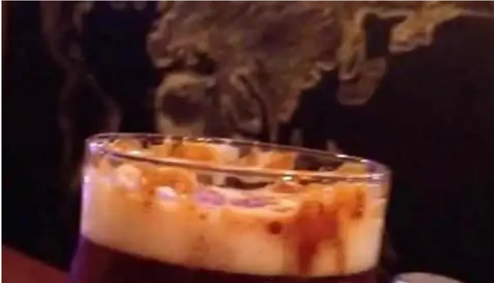
Capi bar cafe irlandes