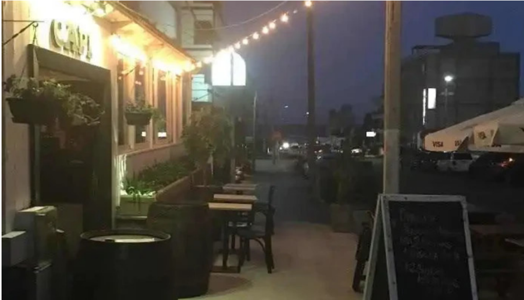
Capi bar del propietario