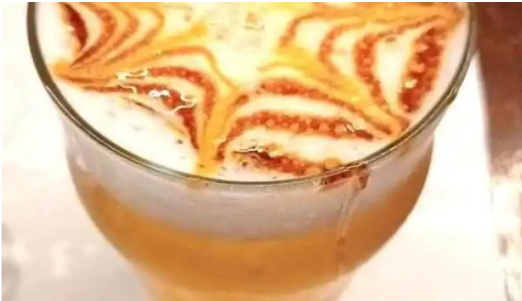
Capi bar capuchino