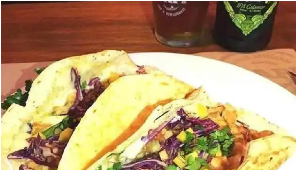
Capi bar comida y bebida