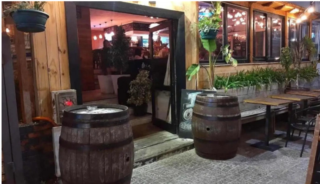
Capi bar punta del este