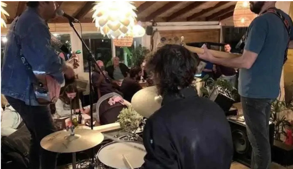
Capi bar mas recientes