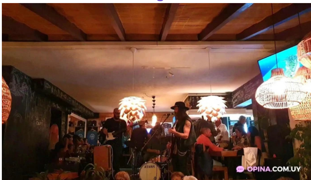
Capi bar videos