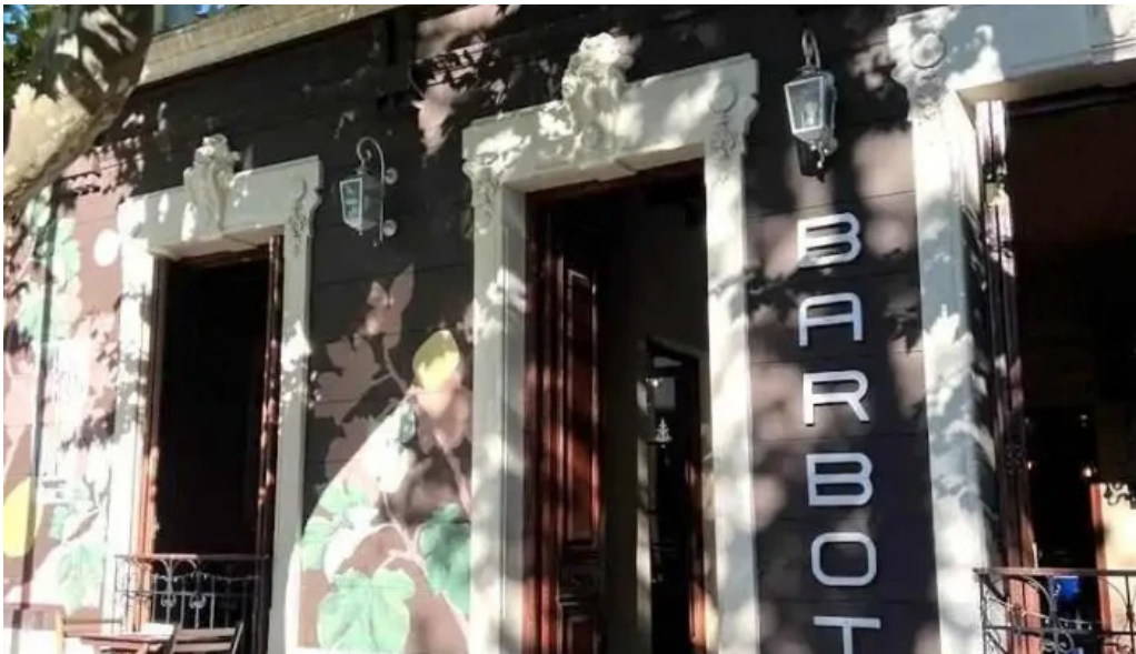
Barbot col del sacramento