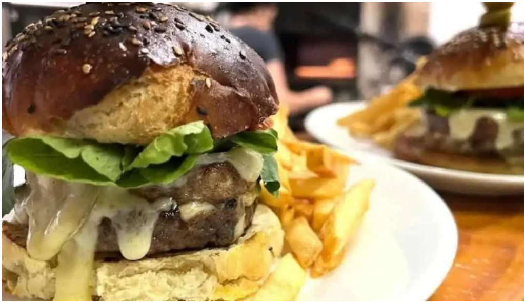
Barbot comida y bebida