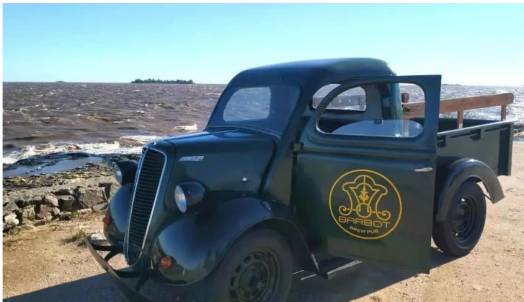
Barbot del propietario