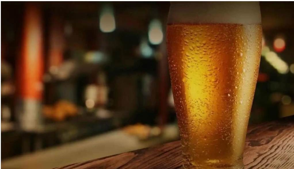
Volcanica bar shangrila comida y bebida