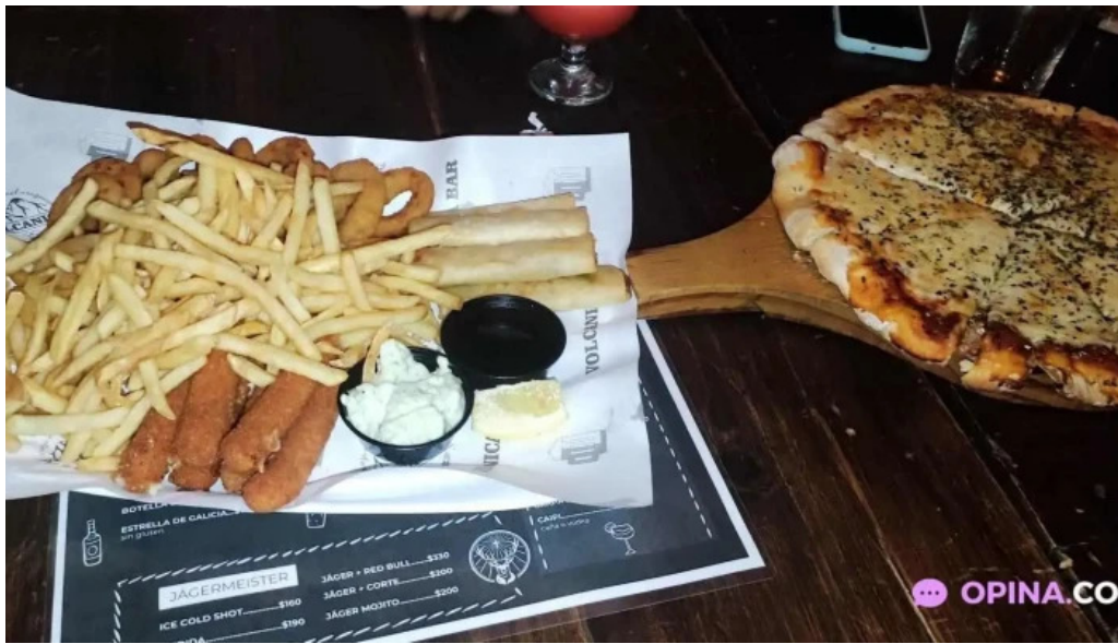
Volcanica bar shangrila menu