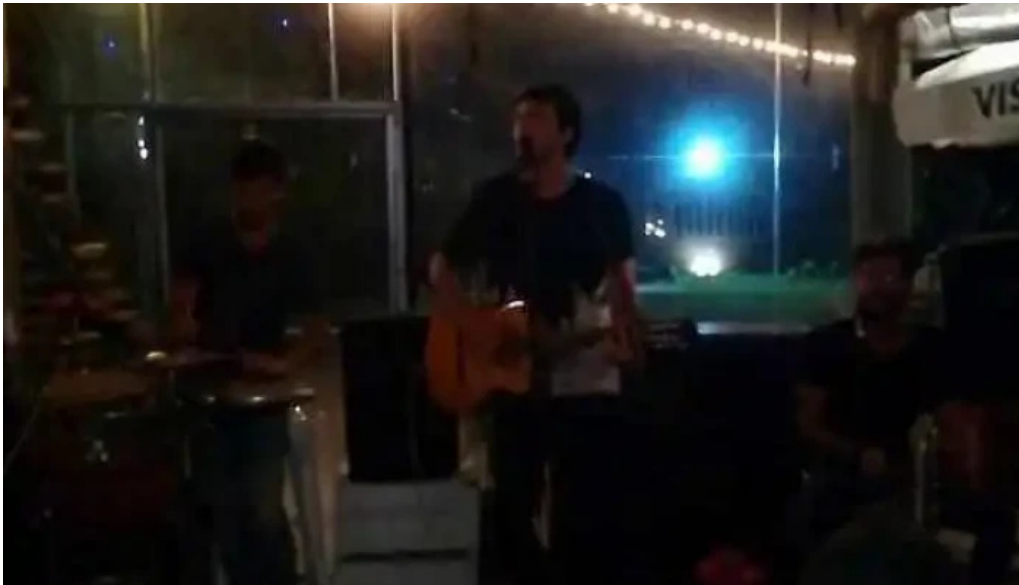
Volcanica bar shangrila videos