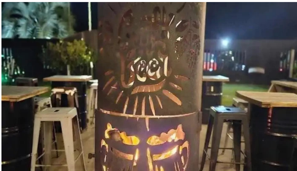
Volcanica bar shangrila mas recientes