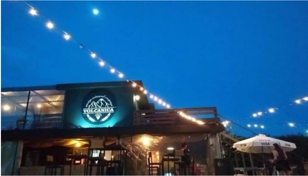
Volcanica bar shangrila ciudad de la costa