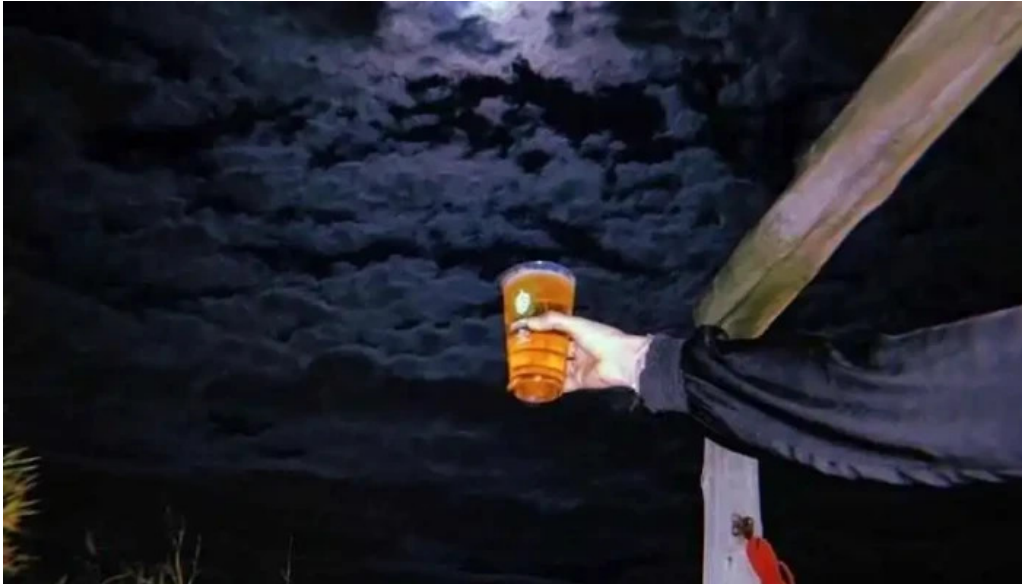
Volcanica bar shangrila del propietario