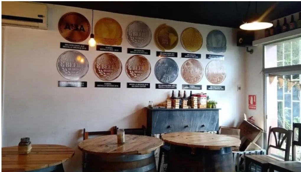
Volcanica bar shangrila ambiente