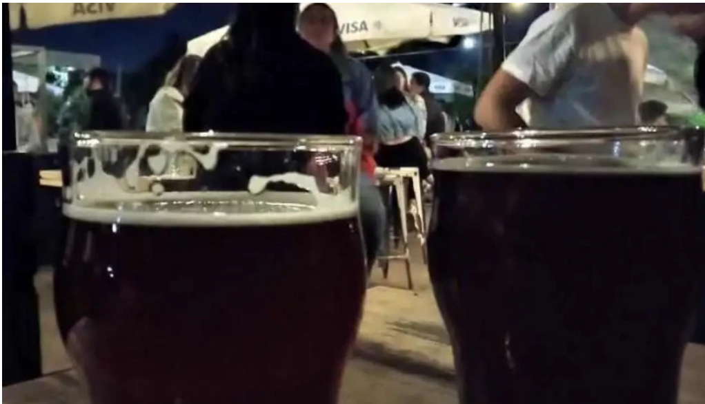
Volcanica bar shangrila cerveza