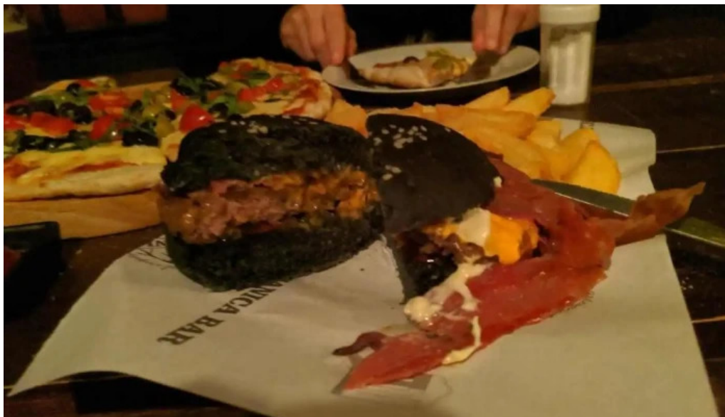
Volcanica bar shangrila hamburguesa