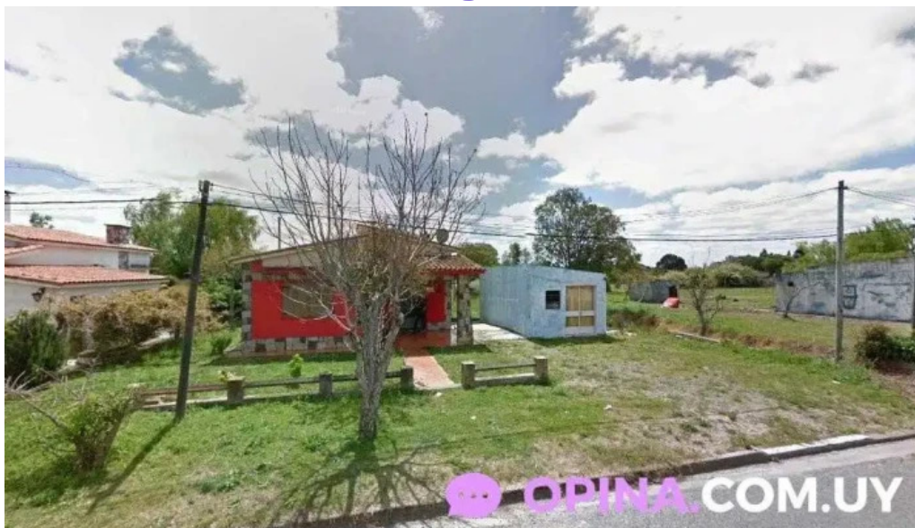
Amsj puntas de valdez