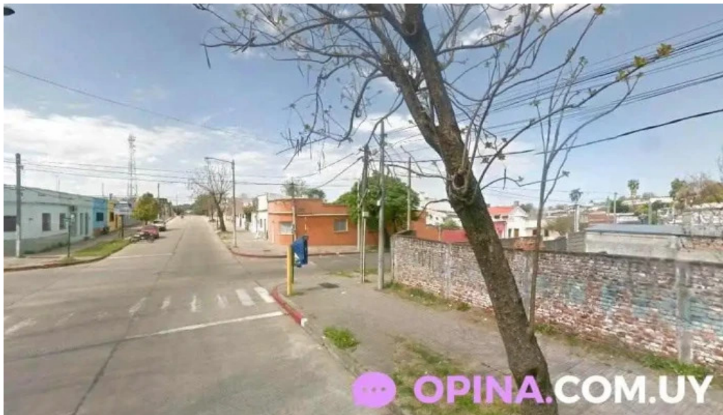
Casmer policlinica rivera chico rivera