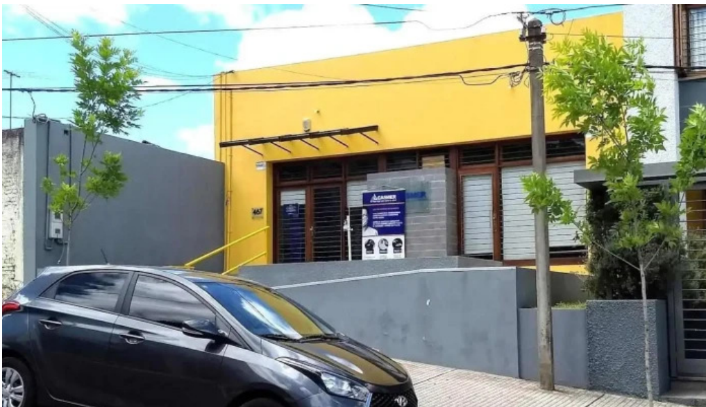
Casmer consultorios medicos rivera