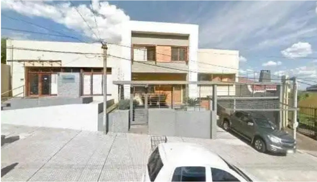
Casmer consultorios medicos opinionesdeg