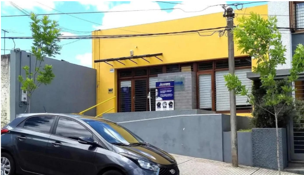
Casmer consultorios medicos opiniones