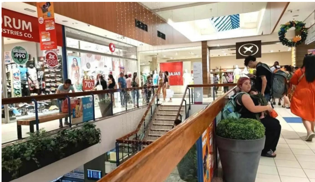
Terminal tres cruces interior