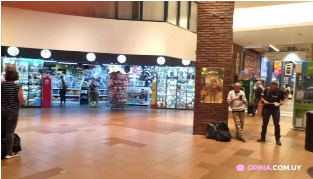
Terminal tres cruces videos