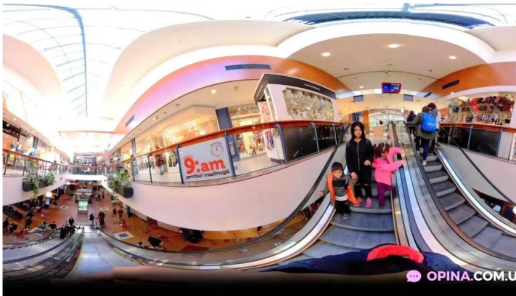
Terminal tres cruces street view y 360