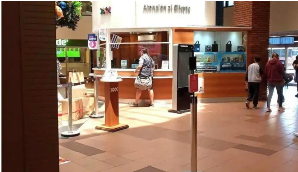
Terminal tres cruces montevideo