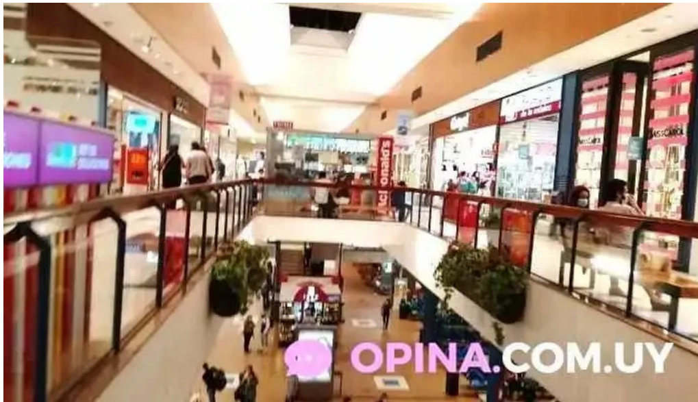
Terminal tres cruces todas